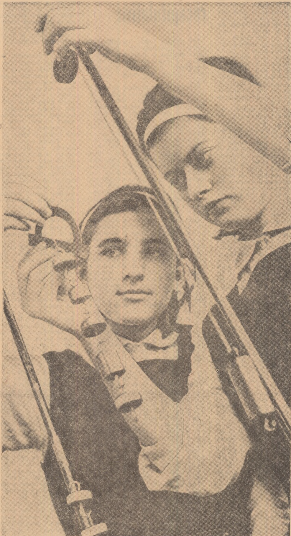
În laboratorul de fizică al Liceului nr. 2 din Roșiorii de Vede