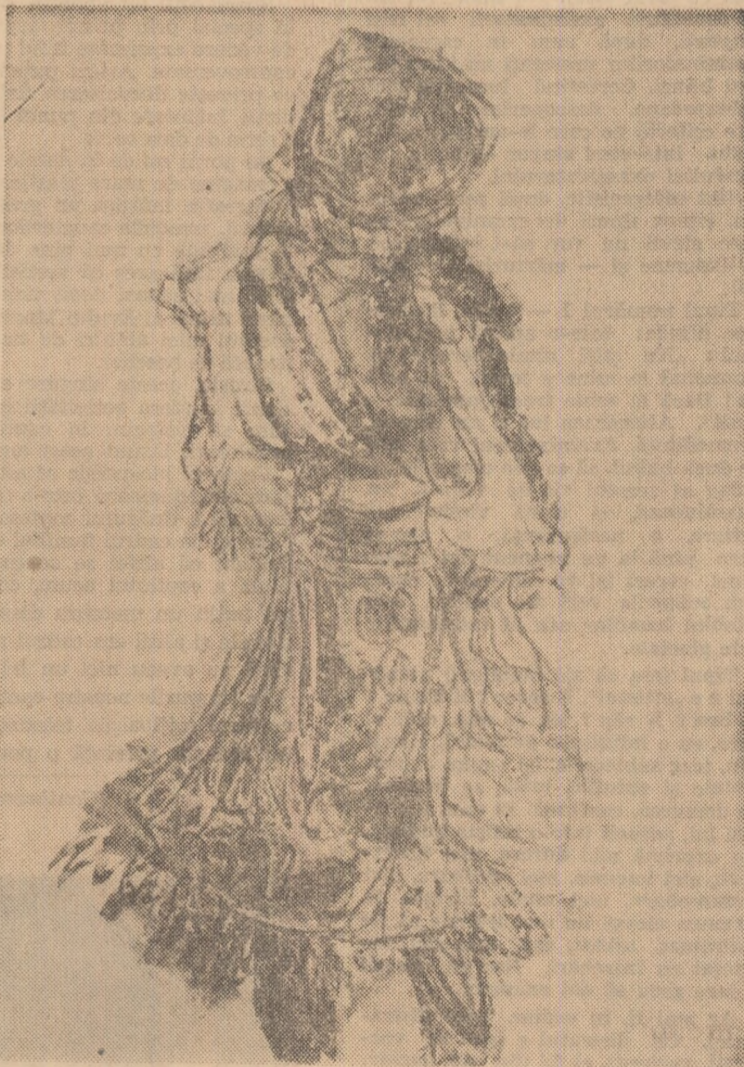
ANCA VASILESCU (15 ani)