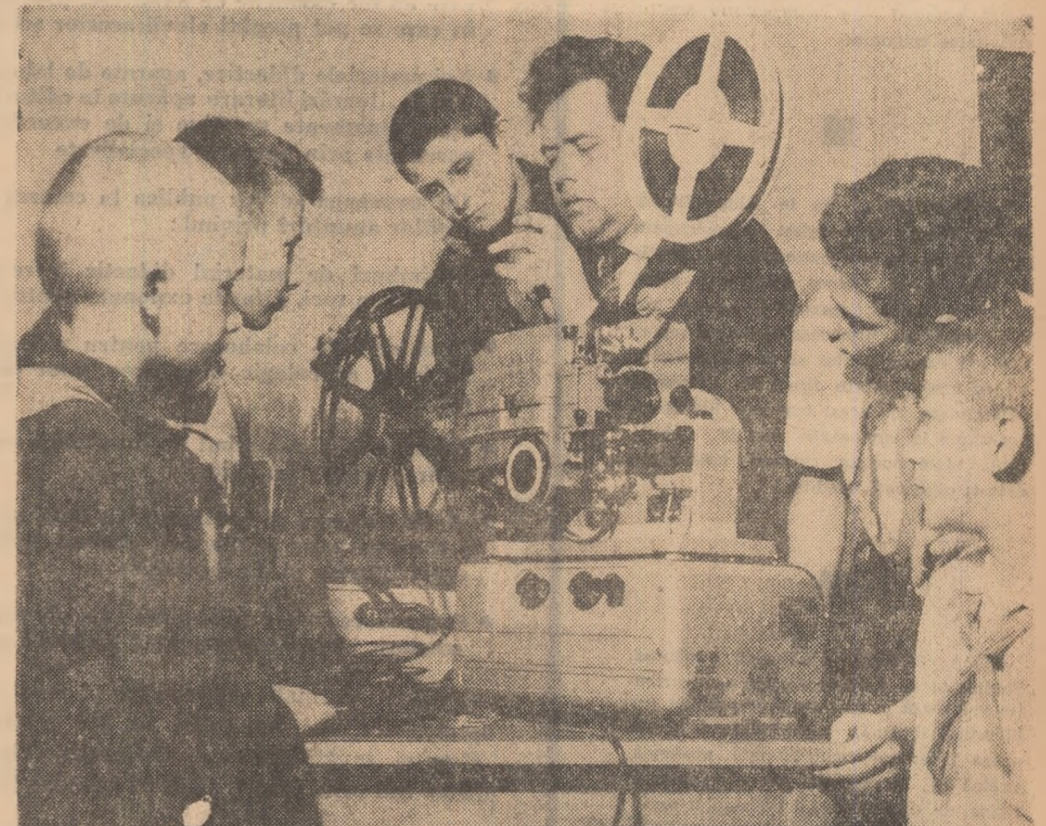
Moment din activitatea desfășurată la cîneclubul Casei pionierilor din Iași

preocupare. Îi vezi jucîndu-se în scuarurile special amenajate pentru ei, în curți și chiar pe străzi. Foarte des se văd pe trotuare, desenate cu cretă dreptunghiuri suprapuse care închipuie un joc arhimoscuit în toată țara. Ceasuri în-tregi copiii sar dintr-un dreptunghi în altul, împingînd în fața lor, cu piciorul, o bucăciță de țigla sau o pietricică. De ce e atît de răspîndit acest joc deajuns de monoton și lipsit de elemente educative? Am găsit explicația consultînd cîteva cărți care prezintă jocuri pentru pionieri și școlari. În general este vorba de jocuri interesante dar pretențioase din punct de vedere material. Potrivite pentru a fi jucate în tabere, ele sînt greu de organizat de către copii înșiși, acasă la ei. Nu oricînd dis-