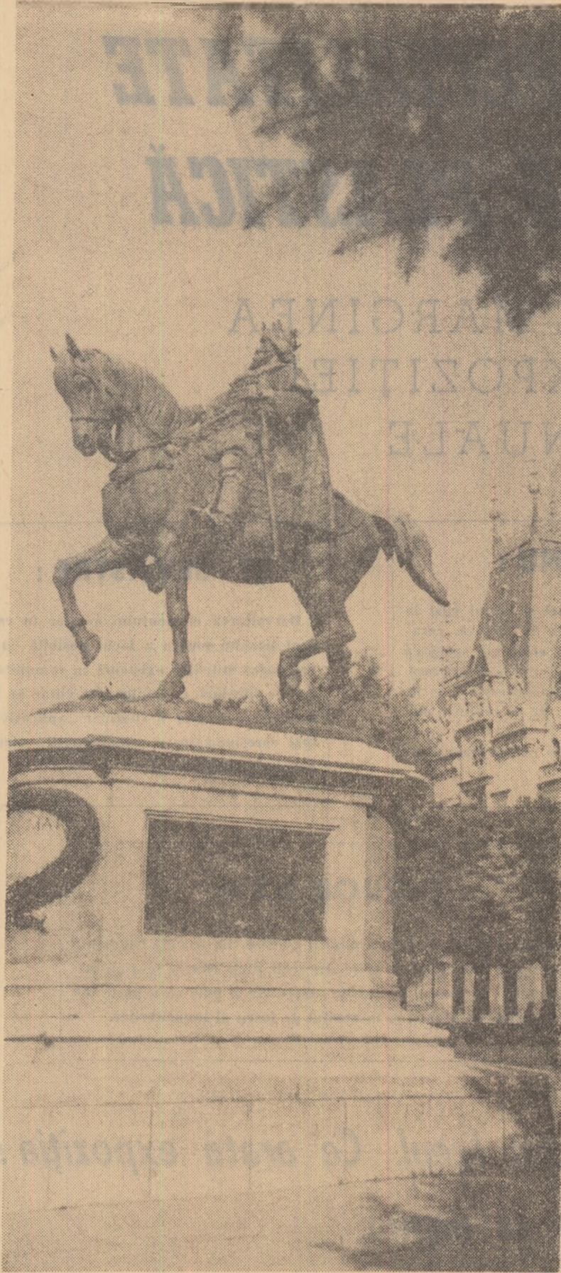
Statuia lui Ștefan cel Mare din fața Palatului Culturii de la Iași.

Construcții de nădejde noi vom fi, Avem o viață-ntr-o noapte, Cu țara-n cîntec toți te vom slăvi Mulțumindu-ți din suflet tierbinte.