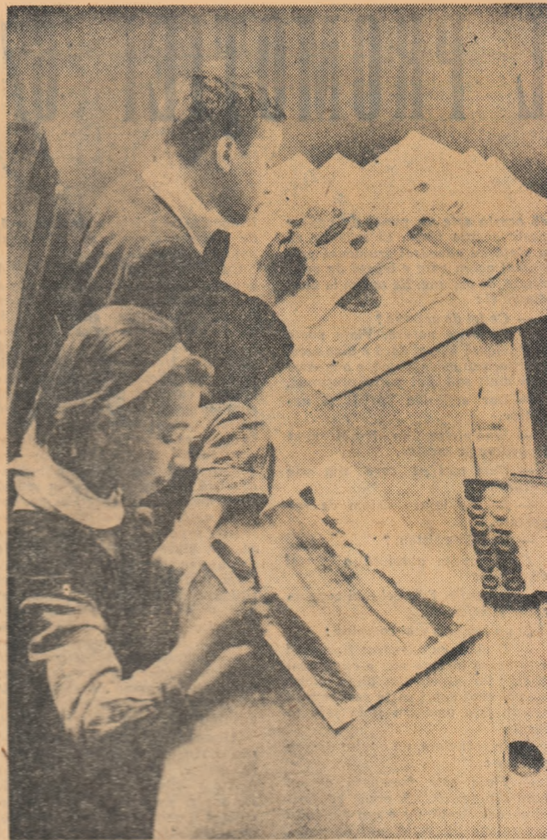
La cercul de artă plastică

În încheierea cuvîntului său, președintele Uniunii Sindicatelor din Instituțiile de Învățământ, Știință și Cultură a chemat pe toți activiștii sindicatelor din învățământ să-și desfășoare astfel munca încît să sporească substanțial ponderea contribuției acțiunilor sindicale în ansamblul strădănilor menite să ridice mereu mai sus școala României socialiste.