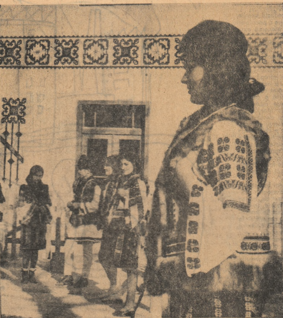
„In satele înnoite de lumina și belșugul vieții socialiste...”