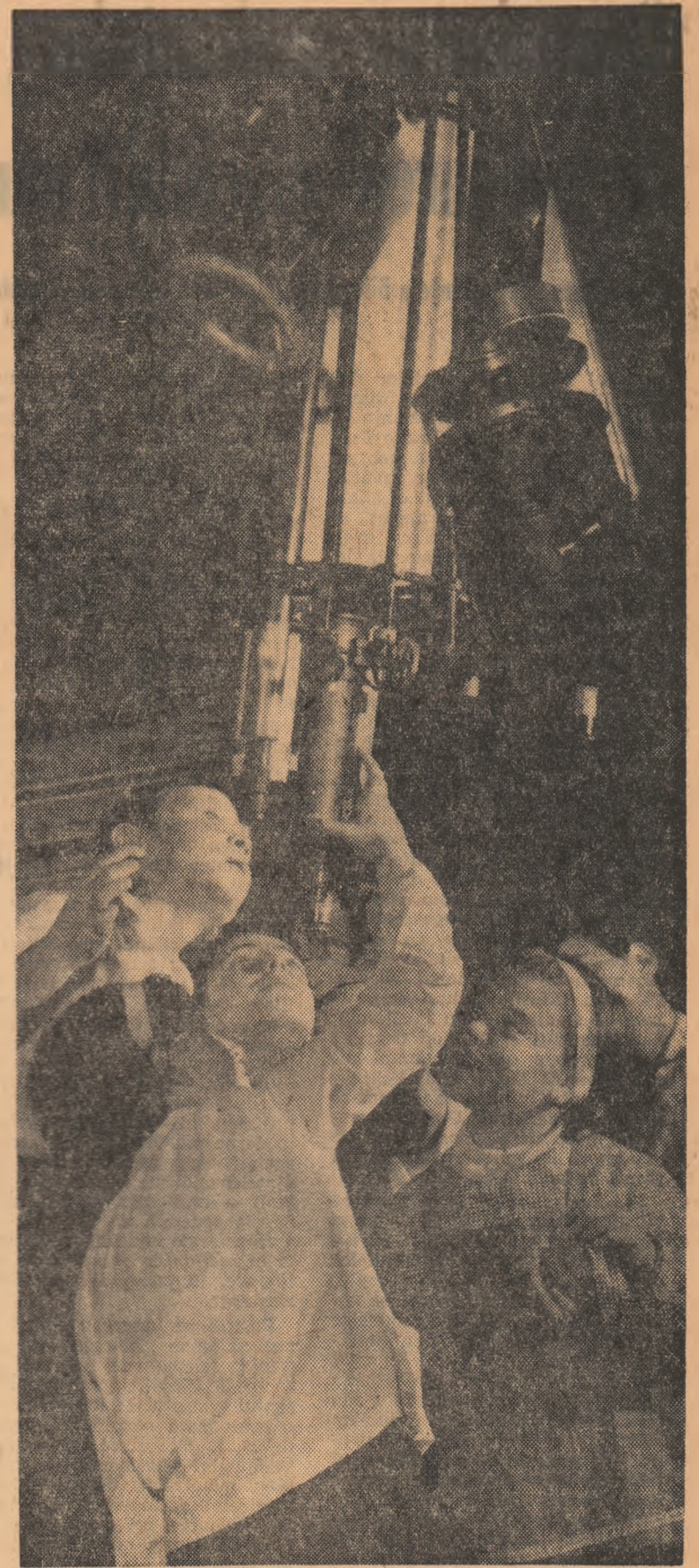
Ea Observatorul astronomia

Una dintre sălile Casei pionierilor din Fălticeni s-a transformat în aceste zile în expoziție de pictură. Ea găzduiește o serie de lucrări în tuș și acuarelă înfățișînd momente din istoria poporului român, precum și numeroase acuarele reprezentînd scene din povestirile lui Ion Creangă. Toate aceste tablouri — multe dintre ele vîndînd real talent — sînt executate de elevii Școlii generale din Dolhești Mari în cadrul cercului de desen al școlii.