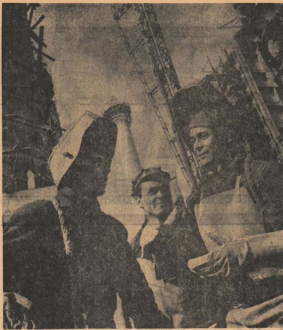
„In imensele hale ale marilor întreprinderi...”

Forța conducătoare a poporului, deschizător de drumuri în făurirea României moderne, partidul clasei muncitoare a adus pe scena istoriei chipul și faptele temerare ale oamenilor care au schimbat și schimbă fața țării. Printre aceștia un loc de cinste îl ocupă tineretul din fabrici și uzine, din întreprinderi și instituții, din școli și facultăți. Preluînd și ducînd mai departe stindardul tradițiilor de luptă și muncă al harnicului popor român, glasul și fapta eroică a tineretului sint consemnate pretutindeni pe plaurile țării de cronica noilor vremuri trăite. Fapta și glasul tineretului român răsună puternic în numele vieții noi pe care talentatul nostru popor și-o făurește cu pasiunea specifică oamenilor liberi și stăpîni pe soarta lor, creînd tinerii generații cele mai prielnice condiții, pe care socialismul, prin însăși esența sa, le oferă, de realizare a celor mai cutezătoare aspirații.