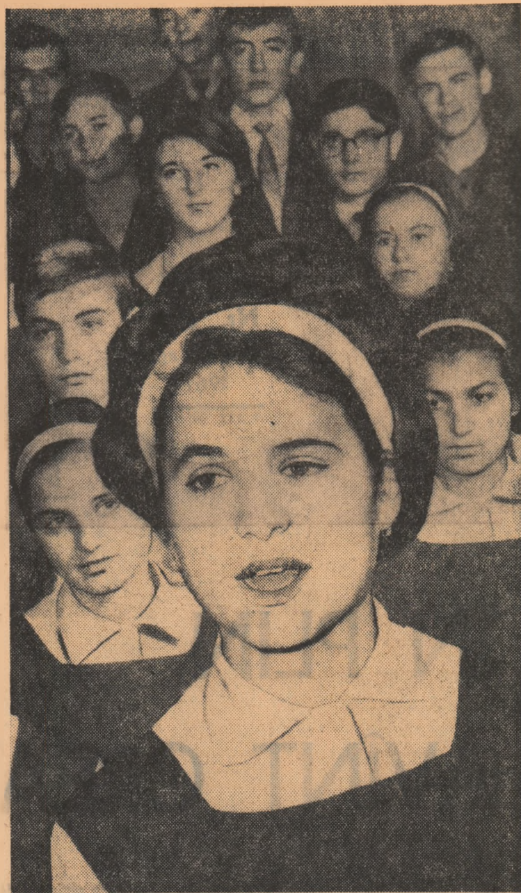
„sau pe băncile școlilor — pretutindeni tinerii aduși cu ei suflul viguros și proaspăt al entuziasmului, al romantismului, al visurilor înalte.”