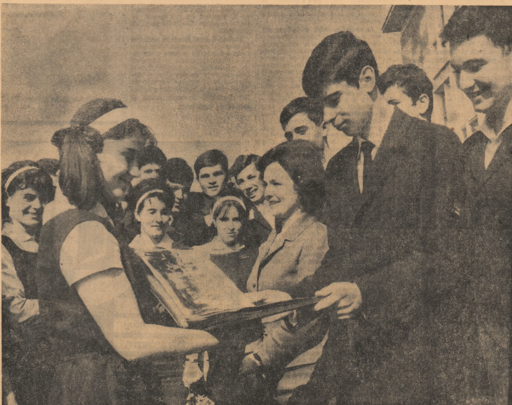
Elevii claselor a XI-a de la Liceul „C.A. Rosetti” predau „Albumul cu amintiri din școală” promoției care le urmează.