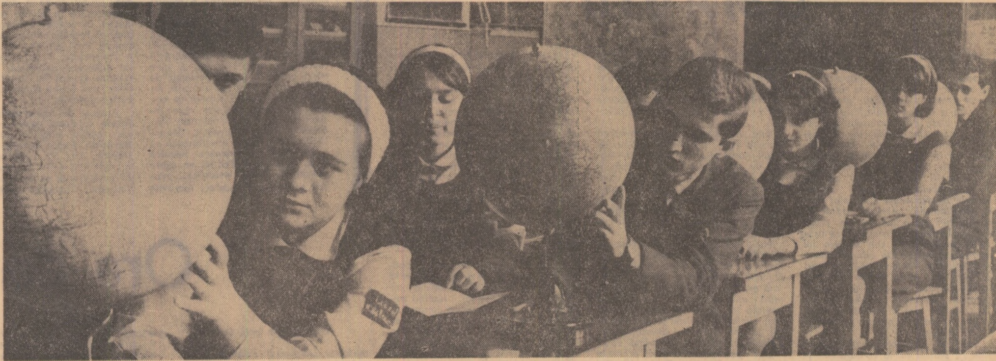
Cabinetul de geografie al Liceului „Nicolae Bălcescu” din București