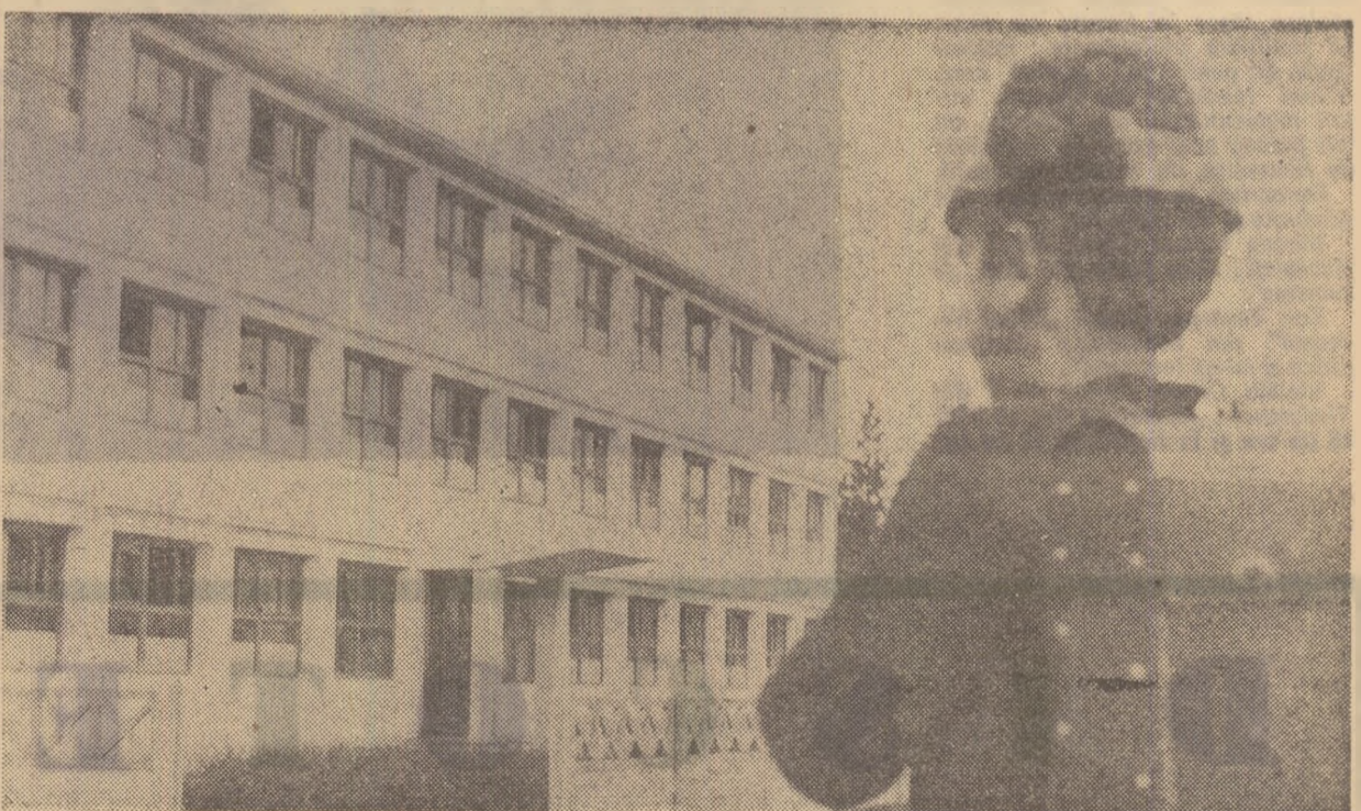
Școală nouă în Nagrești-Oaș

De asemenea, s-a urmărit o organizare pe baze mai științifice a procesului de învățămînt. În acest scop, se va proceda la o mai rațională așezare a materiilor de învățămînt, la eliminarea leștului și repetărilor. În planurile de învățămînt se vor bucura de o deosebită atenție disciplinele moderne, cursurile și metodele care sprijină cercetarea științifică etc. Se va organiza mai judicios conținutul unor obiecte, căutînd să se realizeze cursuri unitare pe cicluri, cursuri de recapitulare și sinteză (istoria civilizației, biologia generală). Vor fi eliminate sau reduse ca volum unele cursuri sau capitole. Planurile și programele vor fi mai rațional elaborate și corelate, astfel încît să nu se depășească un număr de 28-29 de ore de studiu pe săptămîină.