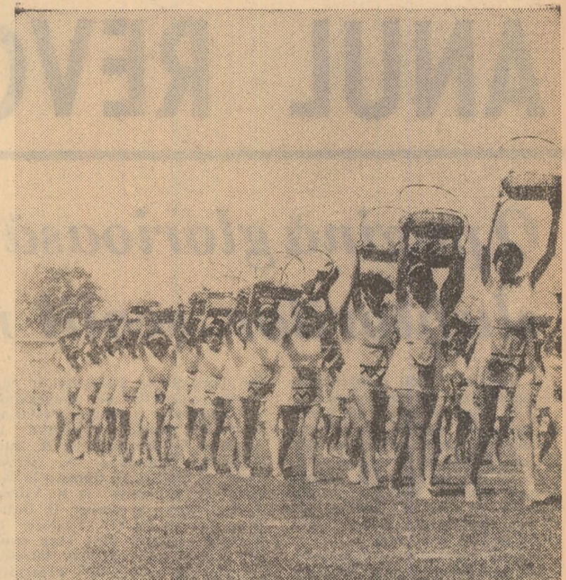
Moment din festivitatea cultural-sportivă închinată Zilei pionierilor