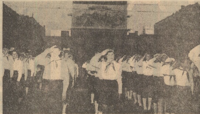
Elevi din Iași participînd la o manifestare închinată aniversării a 120 de ani de la revoluția din 1848