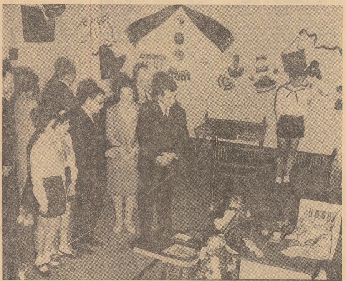
Conauctori de partid și de stat în vizită la expoziția „Tineri speranțe”.

Îngăduiți-mi ca, evocînd uimitorul zădărniciu pe care la 9 iunie pionierii au înscris-o pe retina noastră, să adaug notei maxime deja obținute un summum cum laude, post-scriptum al laudei, mulțumirilor și admirației noastre neprecupețite.