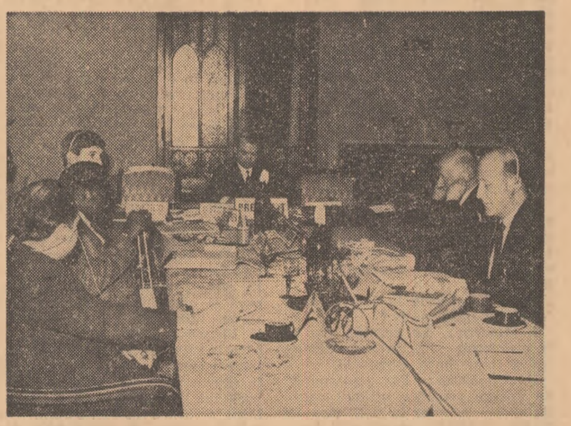
Aspect din timpul desfășurării lucrărilor Reuniunii internaționale a experților în problemele educației tineretului

tegrare cit mai armonioasă a noulor generații în spațiul relațiilor sociale. Puternica afirmare a tineretului în anii din urmă, în forme și modalități diferite, în funcție de condițiile social-istorice, impune reconsiderarea și perfecționarea tipurilor de structuri sociale în care acesta se integrează. Problemele tineretului contemporan au pătruns puternic în anii din urmă și în sfera de preocupări a U.N.E.S.C.O. Pe această linie se înscrie și recenta acțiune din capitala țării noastre. Avînd ca scop elaborarea unui studiu-raport privind măsurile și metodele concrete de aplicare a Declarației asupra promovării în rîndurile tineretului a idealurilor de pace, respect reciproc și înțelegere între popoare — Declarația inițiată de țara noastră și adoptată în unanimitate de Adunarea Generală a O.N.U. — reușina a permis un viu și fructuos schimb de idei. S-a dezbătut o gamă largă de probleme, într-un spirit de cooperare și adepziune unanimă la principiile Declarației. Așa cum au apreciat toți participanții la discuții, materialul de sinteză elaborat cu acest prilej cuprinde recomandări prețioase, preponderent operaționale, practice, în măsură să contribuie substanțial la aplicarea programului U.N.E.S.C.O. pentru tineret. Definind trăsăturile esențiale ale sistemului activităților educative menite să ducă la transparența în practică a principiilor Declarației, reuniunea s-a ocupat îndeaproape de tendințele actuale ale determinării conținutului, metodelor, for-