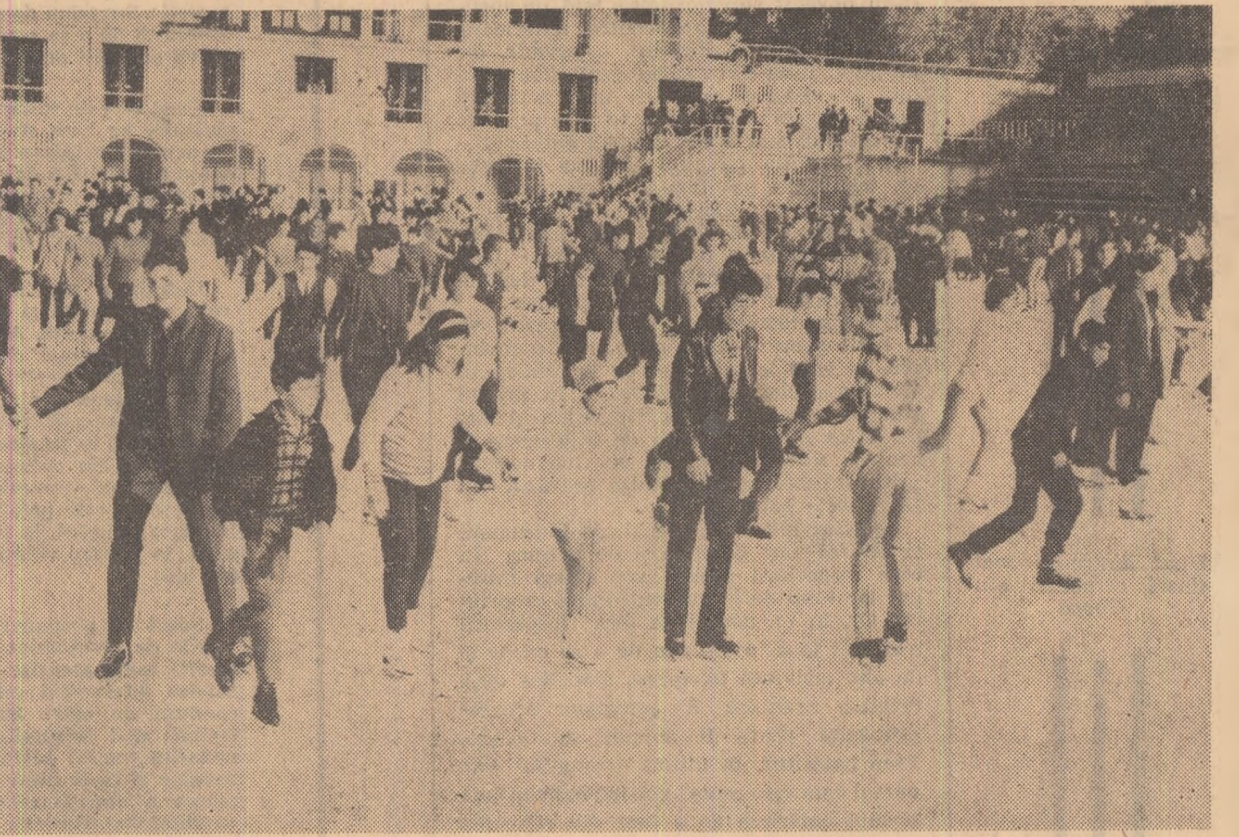
Una dintre cele mai antrenante preocupări de vacanță — patinajul