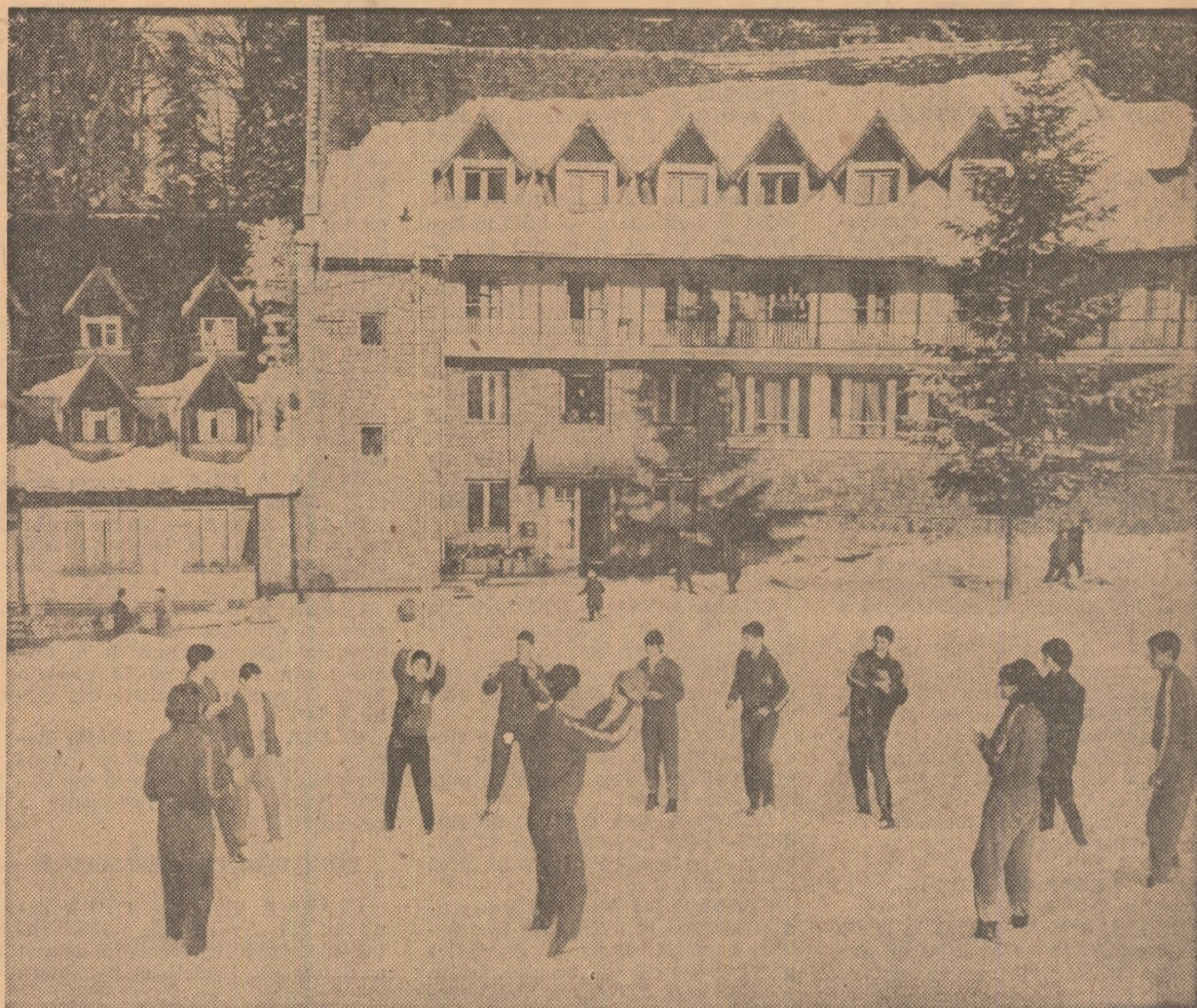
Preludiu la vacanța de iarnă