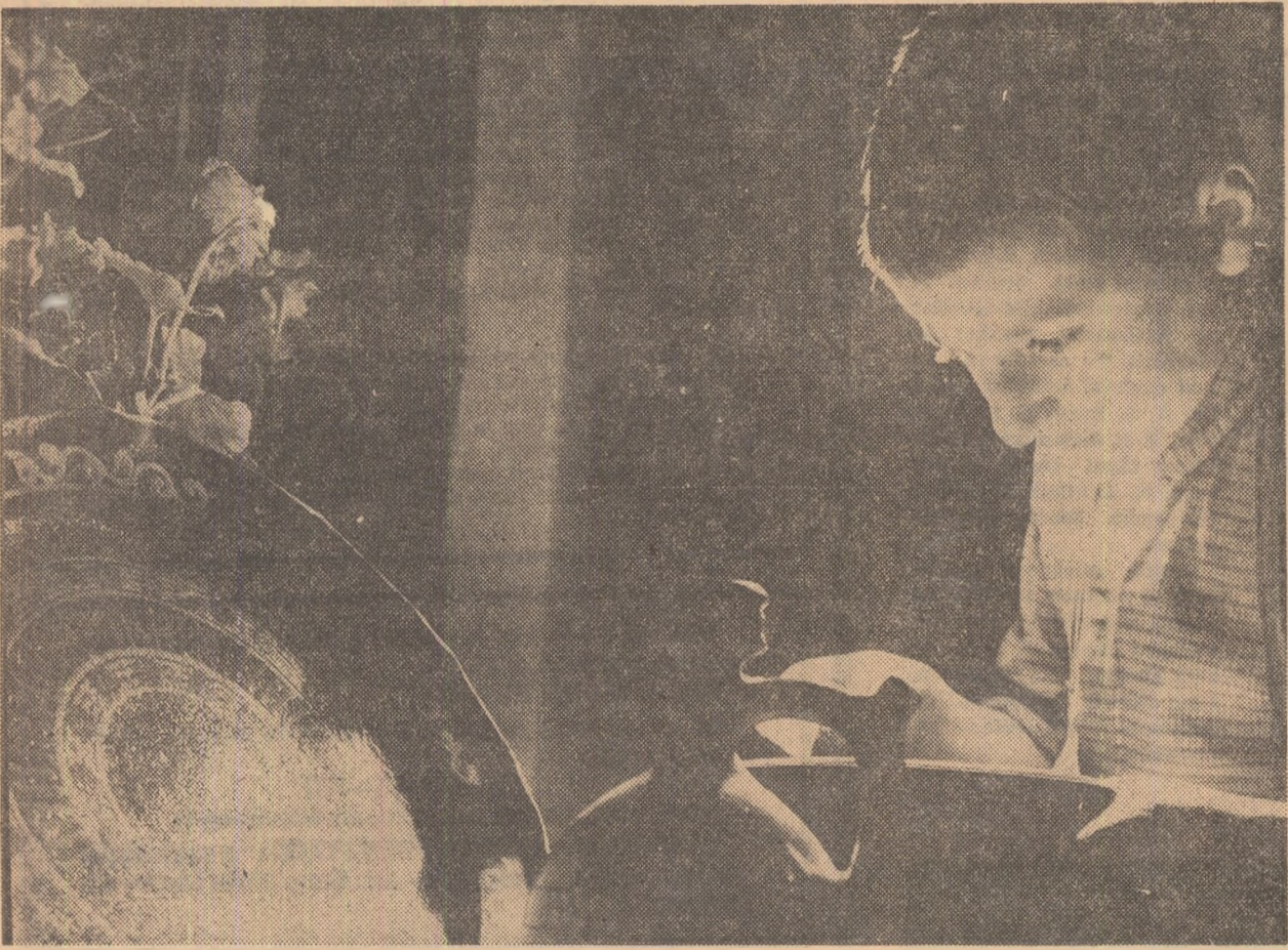
Unul dintre cei mai tineri ceramisti din Oboga