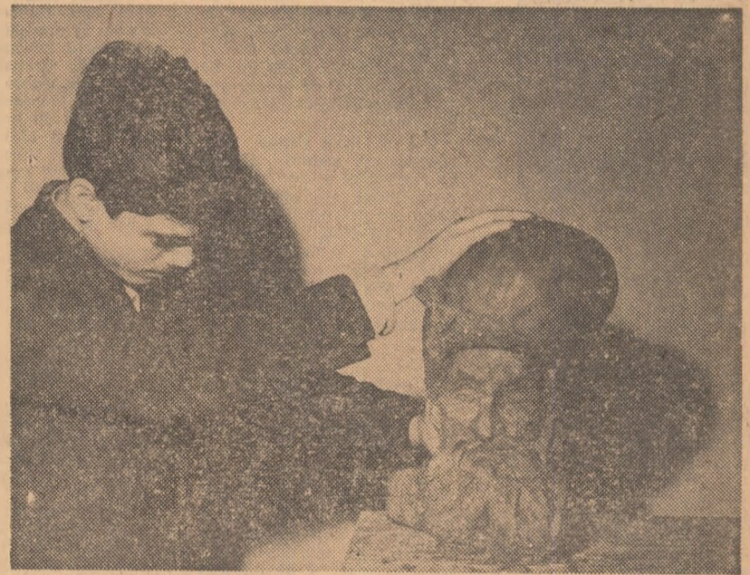
Trecutul eroic al poporului este o generoasă sursă de inspirație pentru viitorii artiști. În imagine un elev al Liceului de arte plastice din București sculptînd chipul lui Mihai Viteazul.