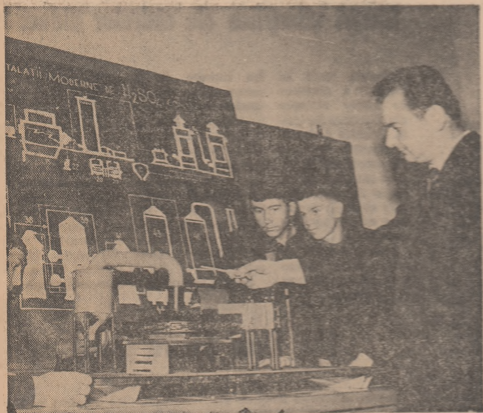
O lecție practică la Liceul industrial minier din Baia Mare