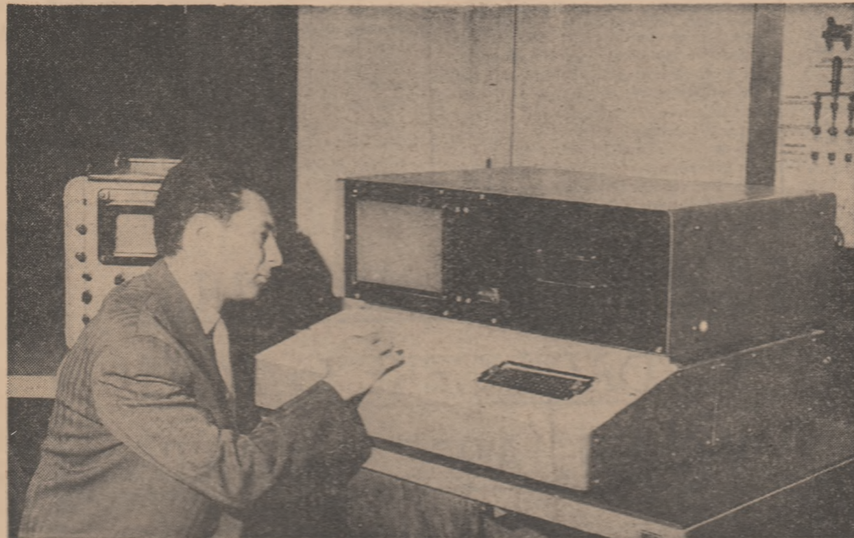
La Institutul politehnic din Timișoara a fost realizat un aparat pentru verificarea după program a însușirii cunoștințelor. Aparatul a fost realizat de un colectiv al Facultății de electrotehnică

Alături de ceilalți oameni ai muncii, slujitorii școlii, participînd activ la toate manifestările din cadrul campaniei electorale, își exprimă sprijinul neclintit față de însuflătoarele țeluri înscrise pe steagul partidului, își afirmă hotărîrea de a marca această perioadă premergătoare alegerilor prin noi și prețioase succese în muncă, în marea operă de edificare a României socialiste.