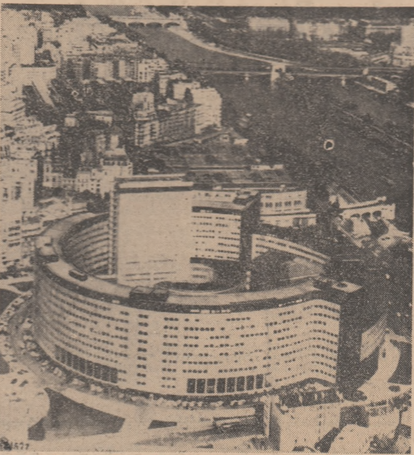
Clădirea radio-televiziunii franceze din Paris

Costa Rica: Școala normală superioară pare să răspundă în momentul de față cel mai mult stadiului de dezvoltare a învățământului din America Latină.