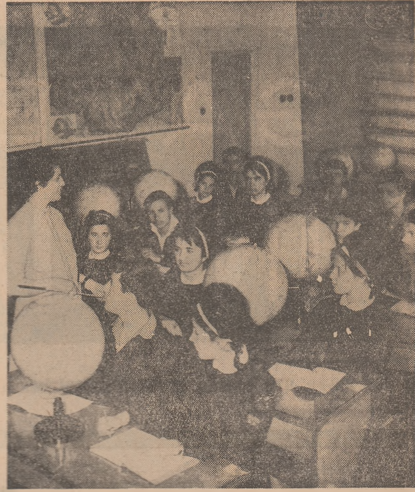
In cabinetul de geografie al Liceului „Dimitrie Bolintineanu” din Capitală