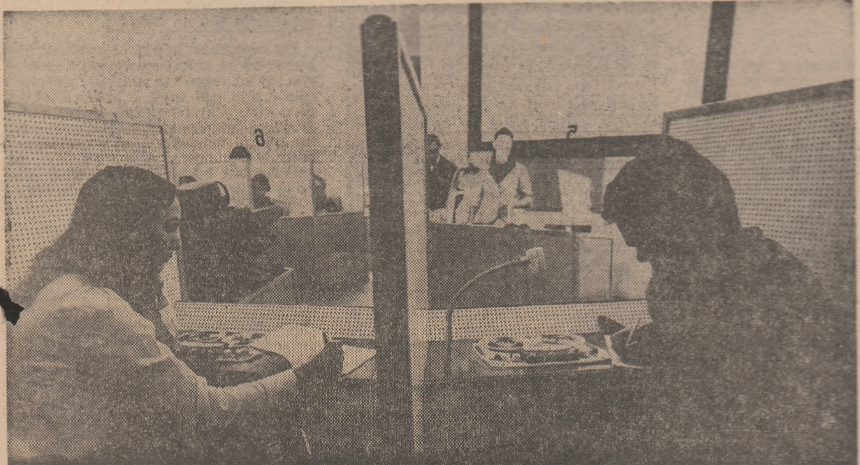
Învățământ modern în laborator