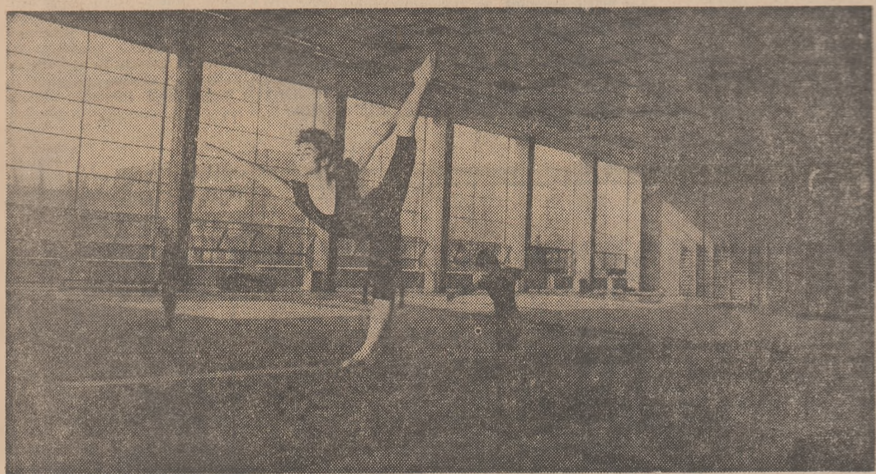
Săli și terenuri de sport bine utilizate stau la dispoziția tineretului