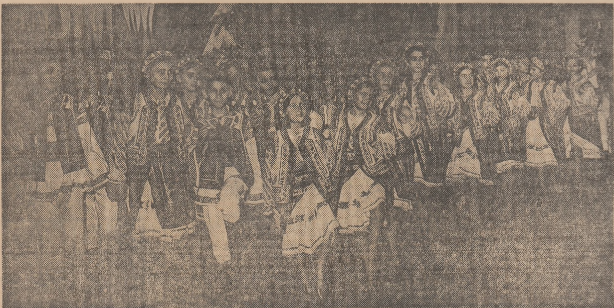
Școlarii învață să iubească portul, dansul și cîntecul popular