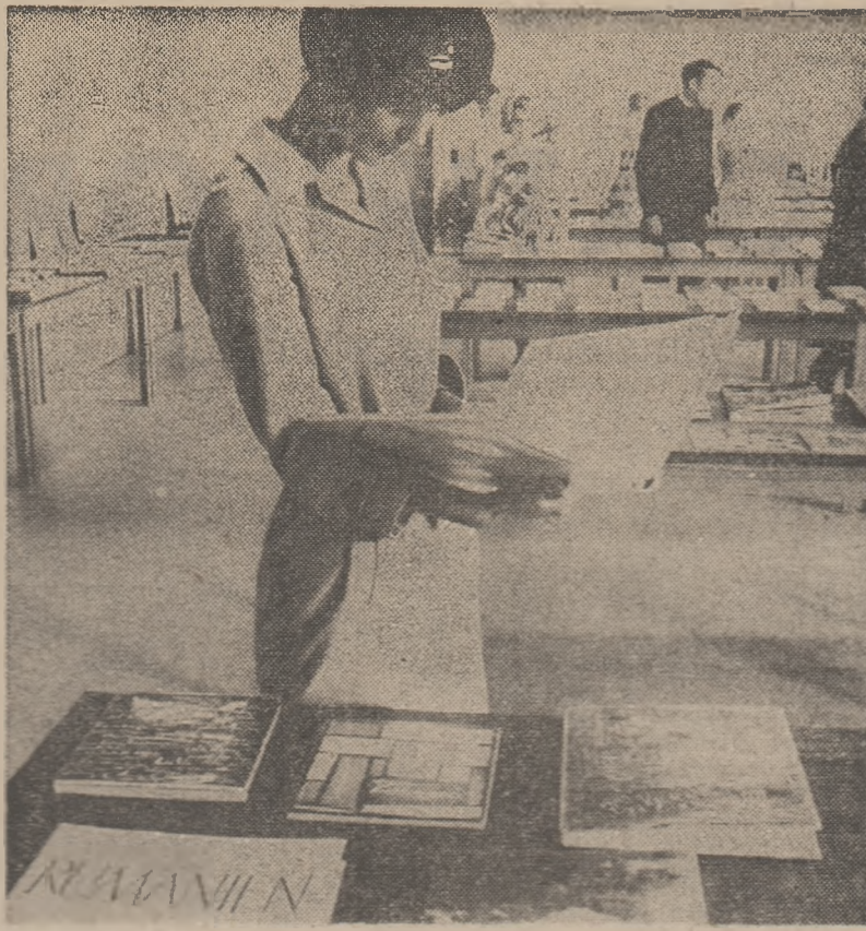
Aspecte de la Expoziția cărții românești organizată recent la Biblioteca orașului Aarhus din Danemarca