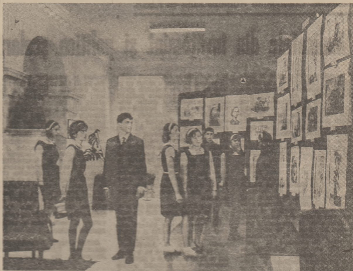
Expoziție de pictură și desene ale elevilor membri ai cercului de arid plastic de la Liceul „G. Lăscăr” din Sibiu.

Sîntem convinși că nu se va preocupă nici un efort pentru ca, în timpul care a rămas pînă la deschiderea viitorului an școlar, să se împlinescă toate condițiile necesare trecerii cu deplin succes la înființarea primei etape în generalizarea învățămîntului de 10 ani.