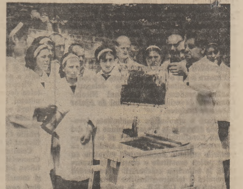
Lucrări practice de apiculatură executate de elevii Liceului agricol din Curtea de Argeș

Afișarea rezultatelor obținute de candidații reușiți, în ordinea descrescătoare a mediilor, se face în cel mult 24 de ore de la terminarea examenării orale. Dacă pe ultimul loc sînt mai mulți candidați cu aceeași medie, selecționarea se face în ordinea mediilor generale obținute la absolvirea ultimii clase a școlii generale.