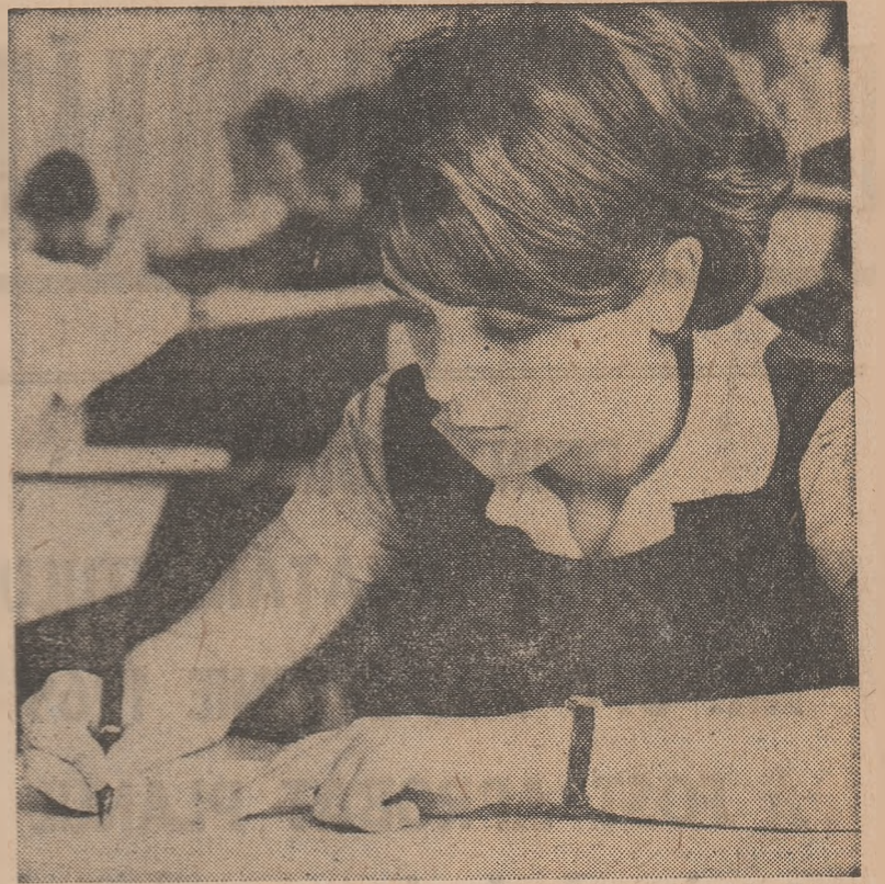
Bacalaureatul, care a început la 1 iunie, se desfășoară zilele acestea în întreaga țară

ÎN ÎNTÎMPINAREA CELUI DE AL X-LEA CONGRES AL PARTIDULUI