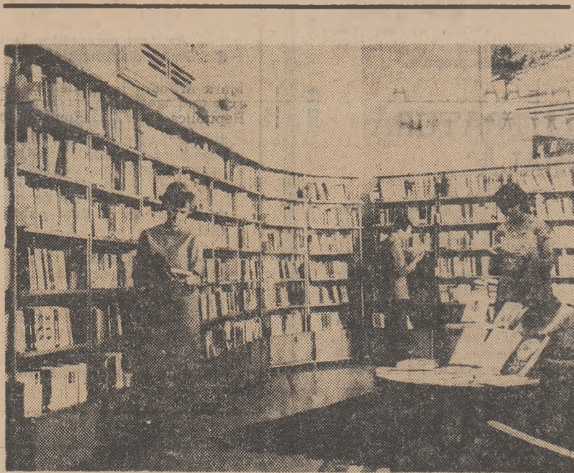
Studiu în bibliotecă