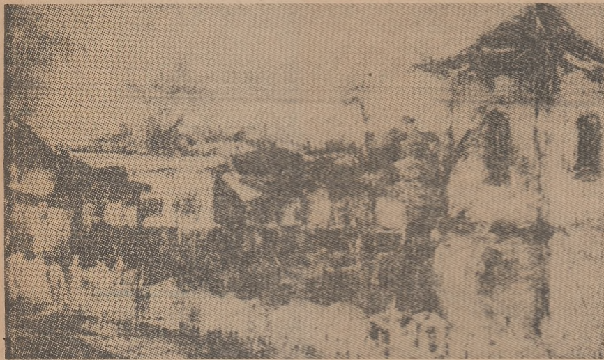
Prof. AUREL ISTRATI „Toamnă tîrzie” (ulei)