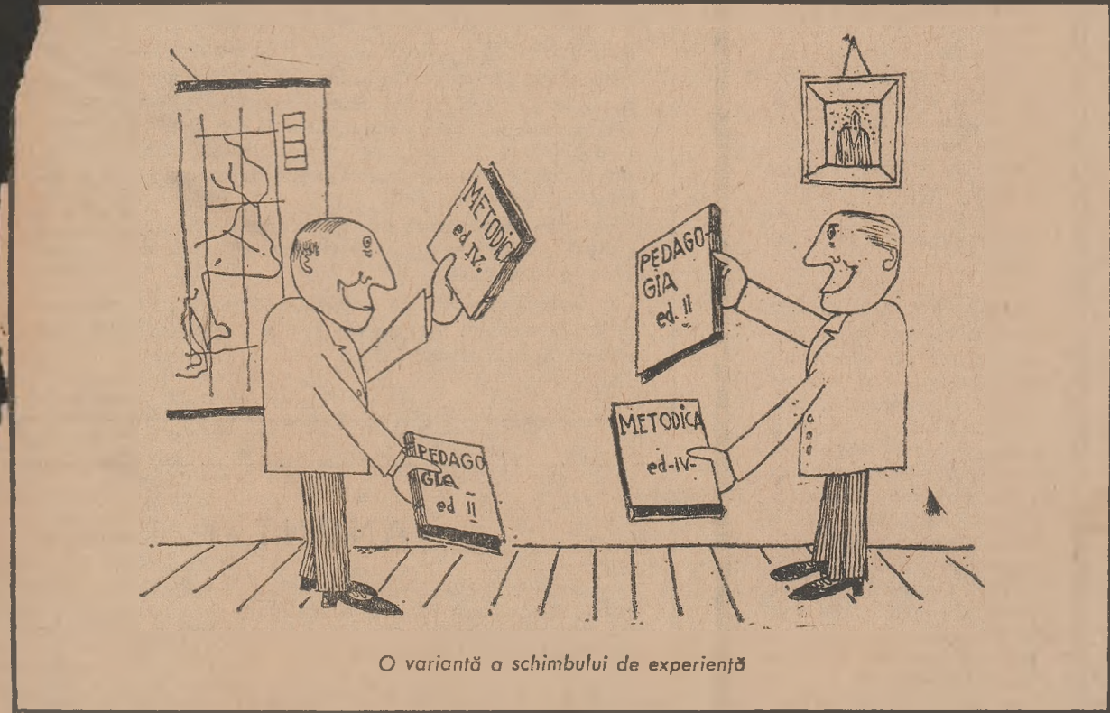
O variantă a schimbului de experiență