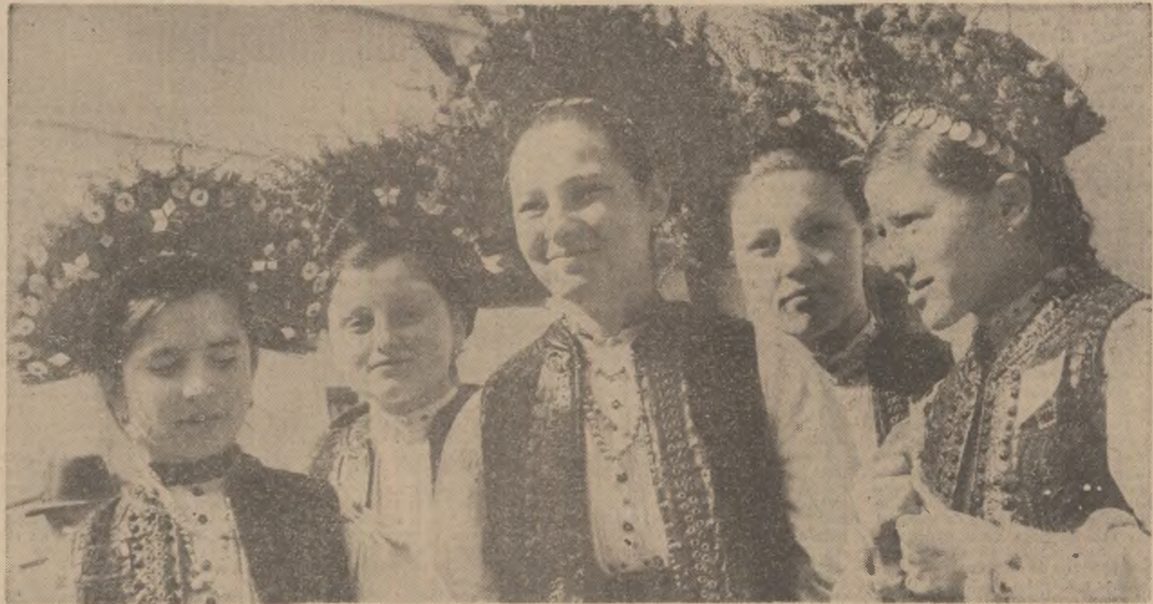
Școlari din județul Harghita îmbrăcați în frumoasele lor costume populare

Deocamdată sîntem numai la început de drum și toate cele menționate nu sînt decît proiecte. Ele vor trebui să devină însă în curînd program de lucru, pentru că noua instituție este o academie de lucru. Desigur, cercetarea depinde în primul rînd de pregătirea, pasiunea și competența cercetătorilor. Sarcina Academiei va fi să-i mobilizeze, să-i ajute să se organizeze, să se documenteze, să încheie contracte cu unitățile beneficiare, să introducă în practică rezultatele care se vor dovedi valabile etc. Întrucît mulți dintre psihologii și pedagogii noștri de valoare sînt membri ai secției de psihologie și pedagogie din cadrul Academiei de științe sociale și politice, lor le va reveni o bună parte nu numai din munca de organizare a cercetării, ci și din însăși activitatea de cercetare legată de dezvoltarea societății noastre socialiste. Sperăm, de aceea, că munca secției va fi încununată de succes, că ea va răspunde pe deplin menirii sale.