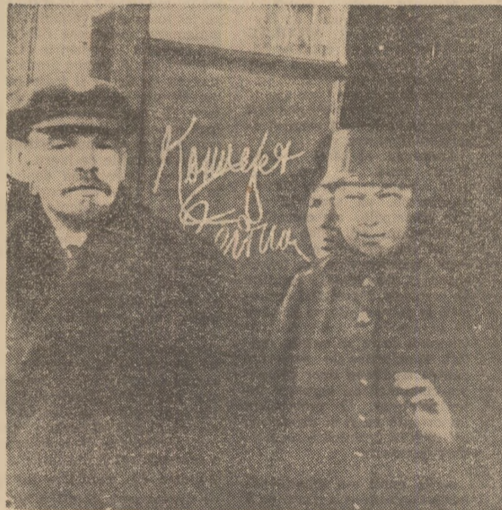
V. I. Lenin și N. K. Krupskaya teșind de la Casa sindicatelor după ședința primului Congres pe întreaga Rusie privind învățămîntul extrascolar.