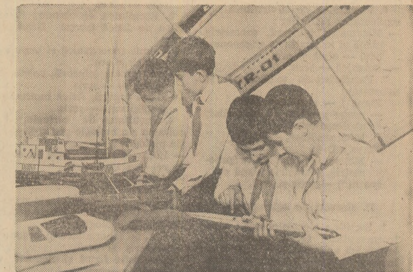
Cercul de navomodel de la Casa pionterilor din Timișoara

Dacă la toate acestea adăugăm necesitatea vitală a inițiativei, a spiritului receptiv și creator, a perspectivei, a sensibilității față de problemele vieții colectivelui și dorința fierbinte de a onora mandatul încredințat, voința de a ridica printr-o contribuție eficientă prestigiul organizației, vom întregi și încheia considerațiile expuse în legătură cu unele aspecte ce privesc activitatea sindicatelor din școli în această etapă.