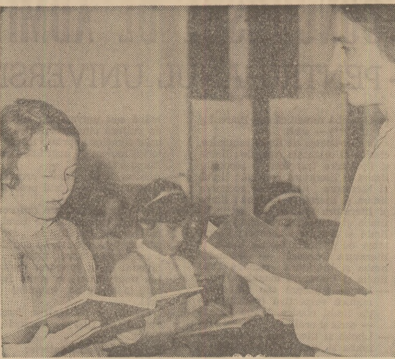
Oră de lectură în clasa a III-a, de la Școala generală din comuna Ogra, județul Mureș