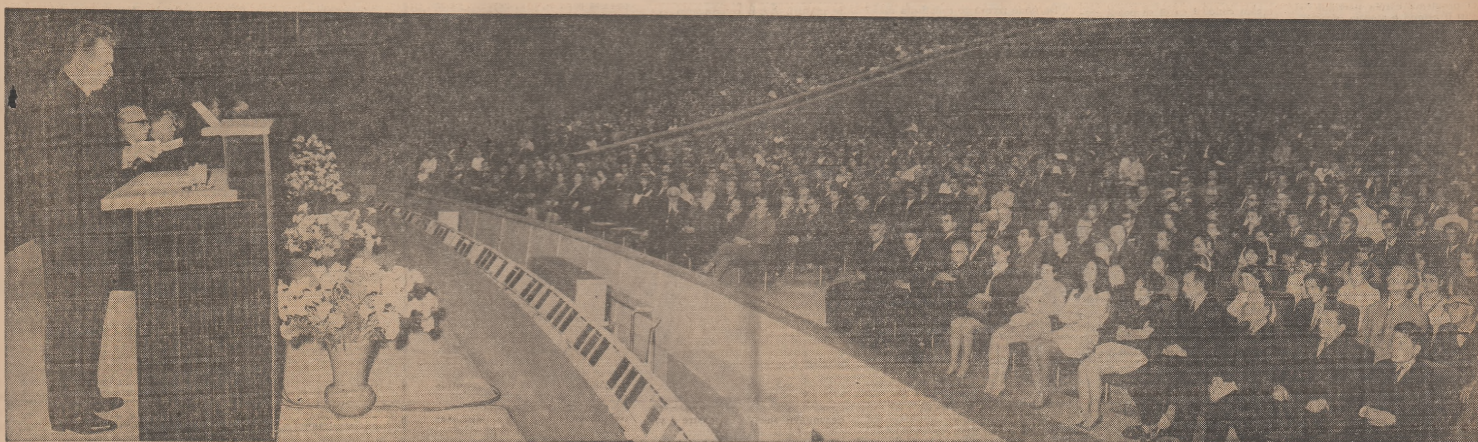
Cu o vie atenție și un profund interes, profesorii și studenții ascultă cuvîntarea secretarului general al partidului