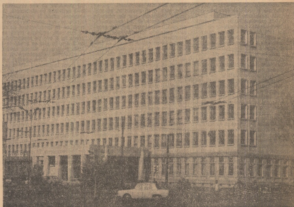
Academia de studii economice din Capitală.