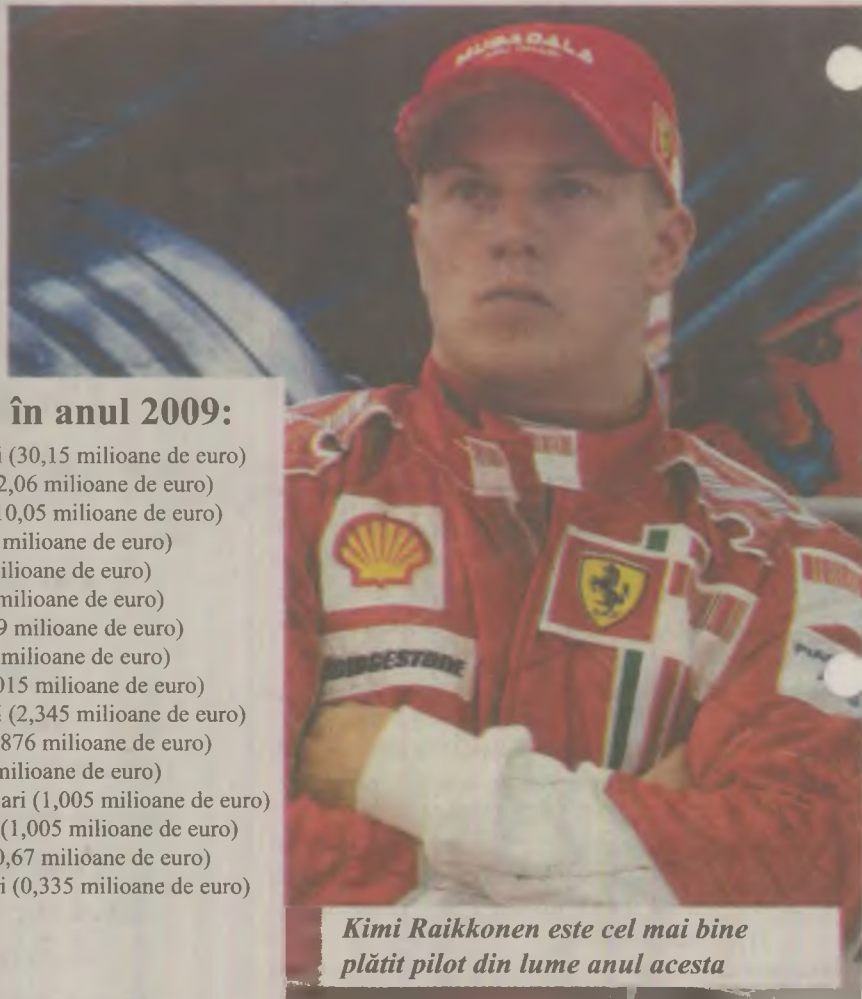
Kimi Raikkonen este cel mai bine plătit pilot din lume anul acesta