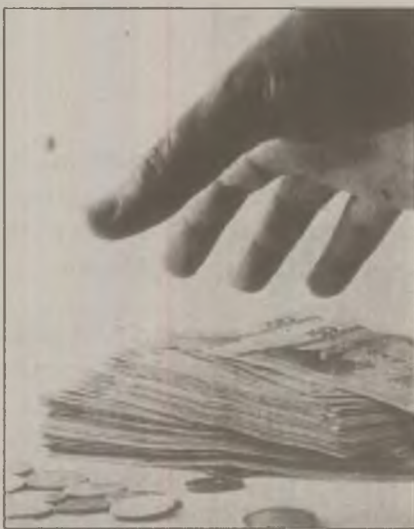
București că nu vor face o nouă evaluare, până când vor avea un Guvern cu drepturi depline cu care să negocieze.

comportă cu bugetul care conține pensii, salarii, investiții", a declarat președintele PSD, Mircea Geoană. În replică, Emil Boc susține că bugetul de stat pe 2010 este un aspect foarte important, care nu poate fi abordat în pripă. "Eu cred că e bine să așteptăm câteva momente să vedem care majoritate își asumă răspunderea pentru acest buget, pentru că bugetul trebuie să fie însoțit de niște măsuri cu respectarea acelor lucruri care sunt trecute acolo. Bugetul va îmbrăca forma oficială în câteva zile", spune Boc. Între timp, visteria țării este aproape goală... Fondul Monetar Internațional a refuzat să vireze cea de-a treia tranșă din împrumutul acordat țării noastre, îngrijorat de instabilitatea politică din România. Mai grav, au transmis autorităților de la