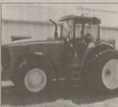
creșterea performanței în sectorul agricol. Inițiativa legislativă, adoptată cu 58 de voturi "pentru" și o "abținere", a fost dezbătută de Senat în calitate de primă Cameră sesizată.