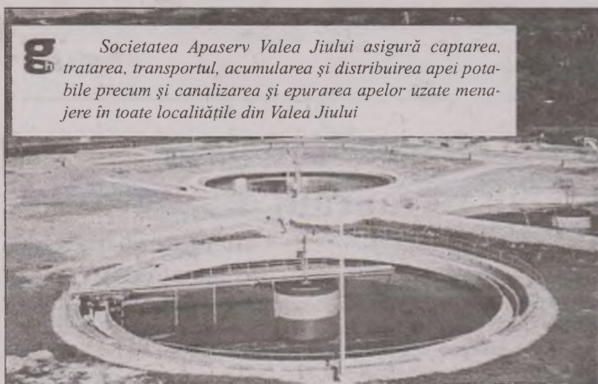
Societatea Apaserv Valea Jiului asigură captarea, tratarea, transportul, acumularea și distribuția apei potabile precum și canalizarea și epurarea apelor uzate menajere în toate localitățile din Valea Jiului