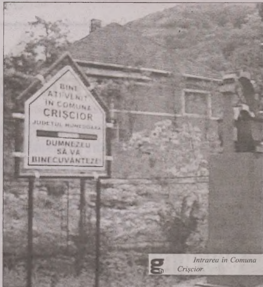
Intrarea în Comuna Crișcior