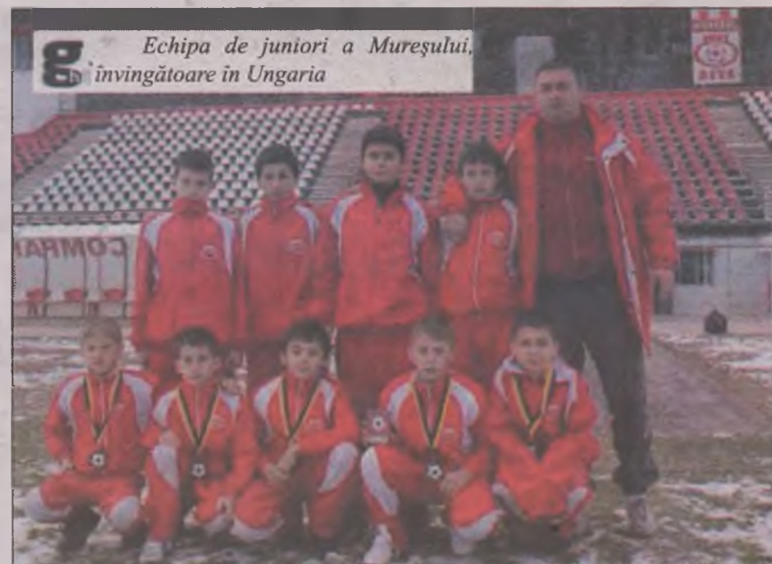
Echipa de juniori a Mureșului, învingătoare în Ungaria