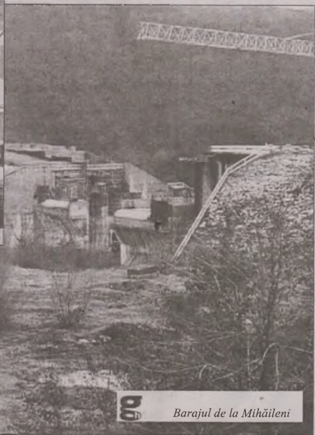
Barajul de la Mihăileni

Crișcior, pe străzile Crișului, Bunei, Trandafirilor și drumul dintre Crișcior și Valea Arsului, 4 km. Tot în acest proiect este prins și programul „After School”. Dacă acest proiect va fi aprobat, nu vor mai exista străzi neasfaltate în comuna Crișcior. Nu știm însă dacă se va aproba, deoarece din cauza gradului de sărăcie e posibil să nu înțrinim punctajul necesar. În anii '90, când s-a stabilit gradul de sărăcie, erau mulți mineri în zonă; numai la Barza erau aproximativ 6.000 de muncitori, plus vreo 1.500 la Atelierele Centrale, mergea totul din plin, zona era una favorizată industrial. Zona a fost considerată astfel ca având un grad minim de sărăcie. Acum, deși minele s-