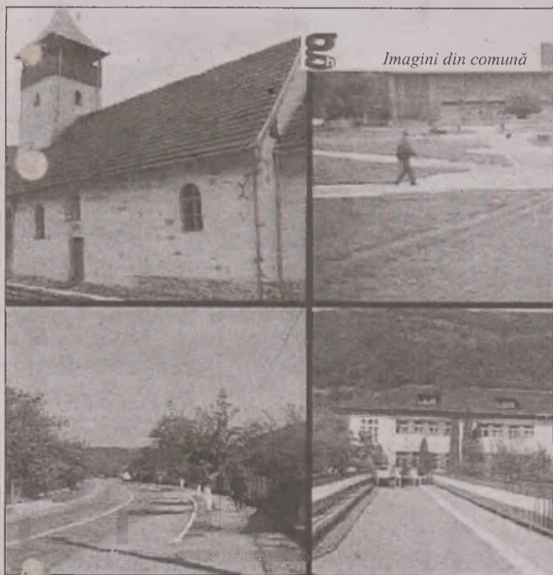
Imagini din comună