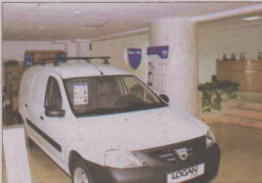
Dacia este principalul beneficiar în programul de reînnoire a parcului