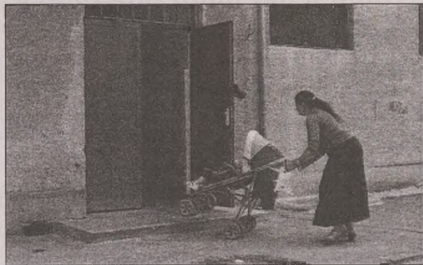
Asistații sociali nu pun niciun preț pe munca în folosul comunității

Pentru a achita ajutoarele sociale, Primăria Deva cheltuiește, lunar, cam 40.000 de lei. Doar 64 de persoane lucrează în folosul comunității primind în schimb remunerația lunară de 600 de lei. „Serviciile prestate de aceștia constau în curățenia anumitor zone din oraș în funcție de programul lunar stabilit, iar numărul de ore prestate este în funcție de cuantumul ajutorului social și de algoritmului de calcul. Ei prestează aceste activități în contul ajutorului social pe care îl primesc. Aceste persoane nu pot refuza activitățile impuse. Cei care refuză nu își primesc ajutorul social pe luna în care nu