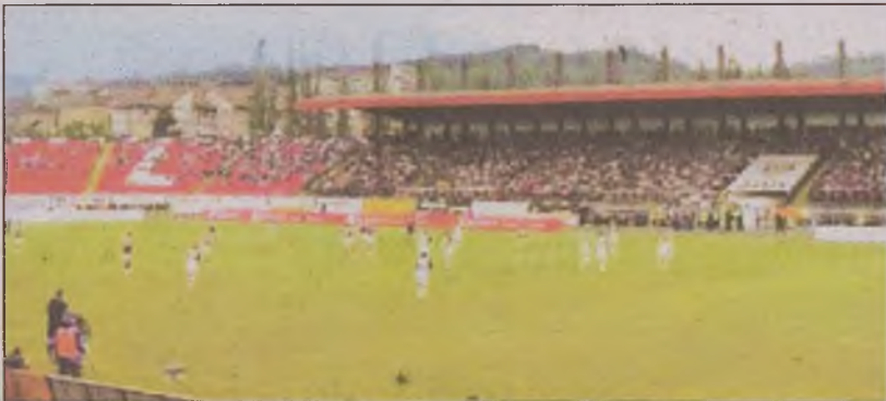
Stadionul Jiul din Petroșani ar putea rămâne pustiu