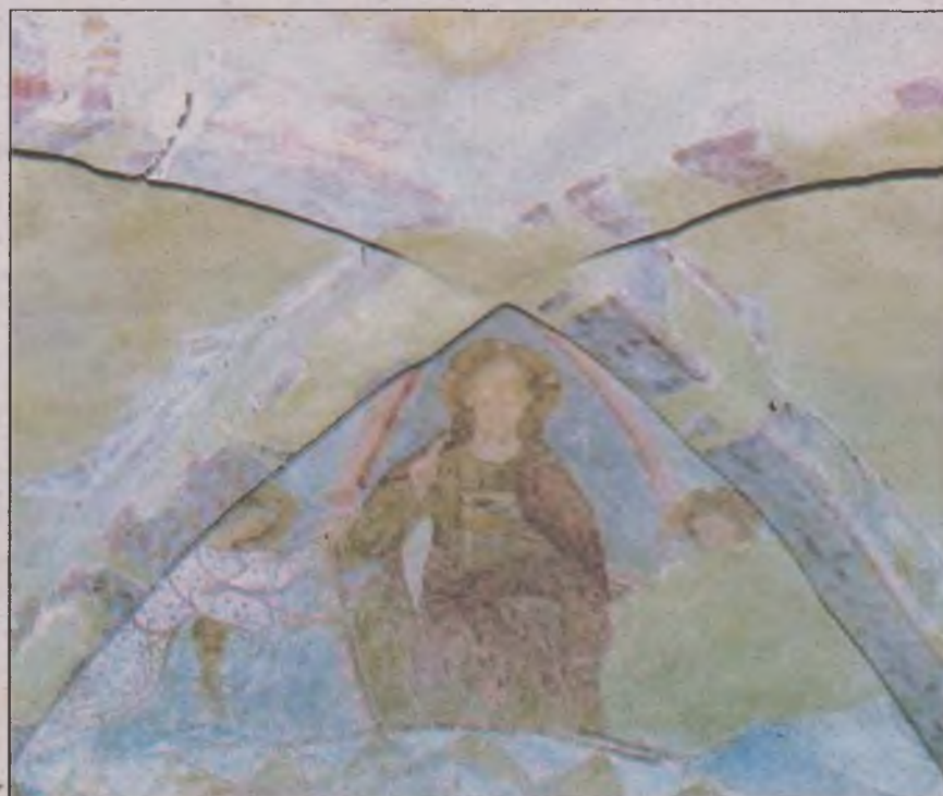
Ișus în glorie

obiceiul de a asigura mortului plata cerută de străjerii porților pentru trecerea în lumea de dincolo. Una dintre monede are două perforații, semn că ea a făcut parte dintr-o salbă. S-au mai descoperit o verigă din aliaj de argint, o verigă de bronz și un nasture din bronz de formă