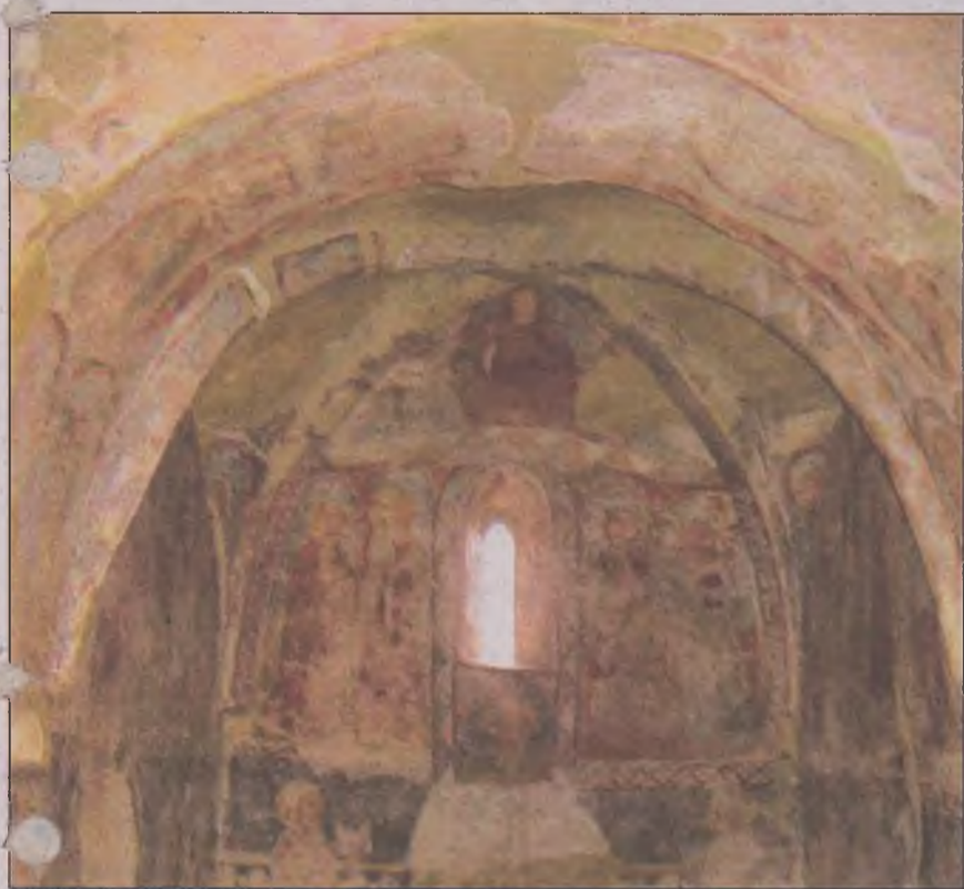
Vedere spre altar