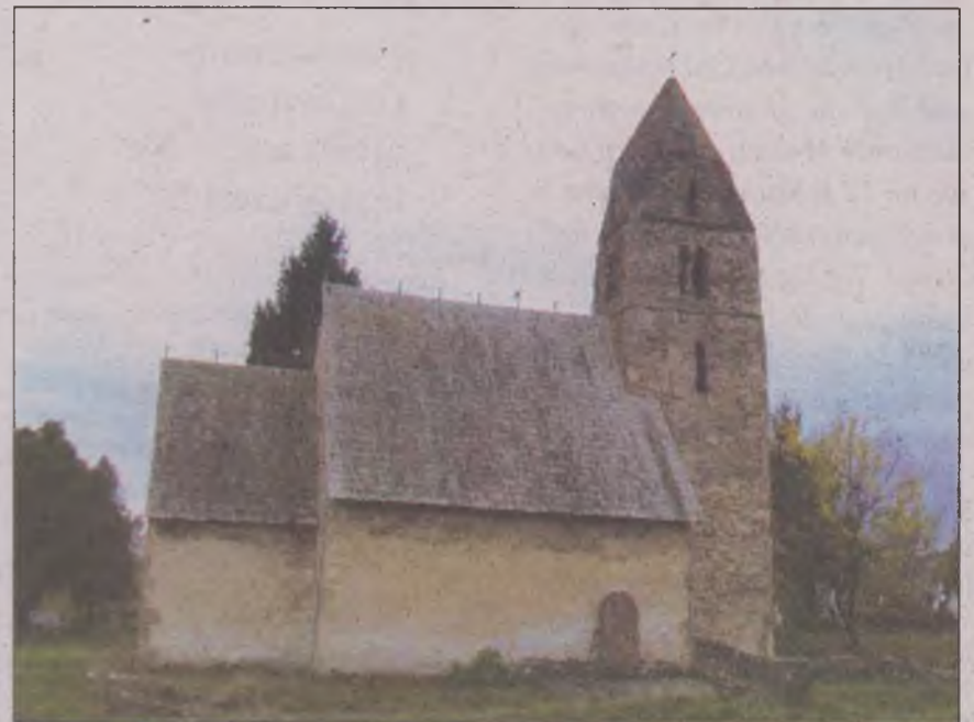
Biserica medievală din Strei

În cursul săpăturilor din interiorul bisericii au fost descoperite și două inele din aur. În mormântările aparțin tuturor categoriilor de vârstă, dar surprinde procentajul copiilor de peste 25 %, ceea ce sugerează că mortalitatea infantilă era extrem de ridicată. Atrage atenția un mormânt în care au fost descoperite urme ale unui sicriu îmbrăcat în țesătură cu fir auriu și fixat cu ținte de bronz. El a aparținut unui personaj cu un statut social superior, posibil un membru al familiei nobile din Strei.