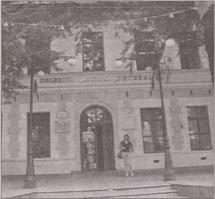
Eleva care a obținut cel mai important premiu din acest an de la vreo olimpiadă națională studiază la Colegiul Național „Decebal” din Deva