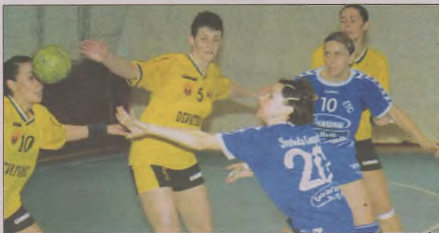
Deva și Baia Mare au oferit mai mereu dispute spectaculoase pe semicerc