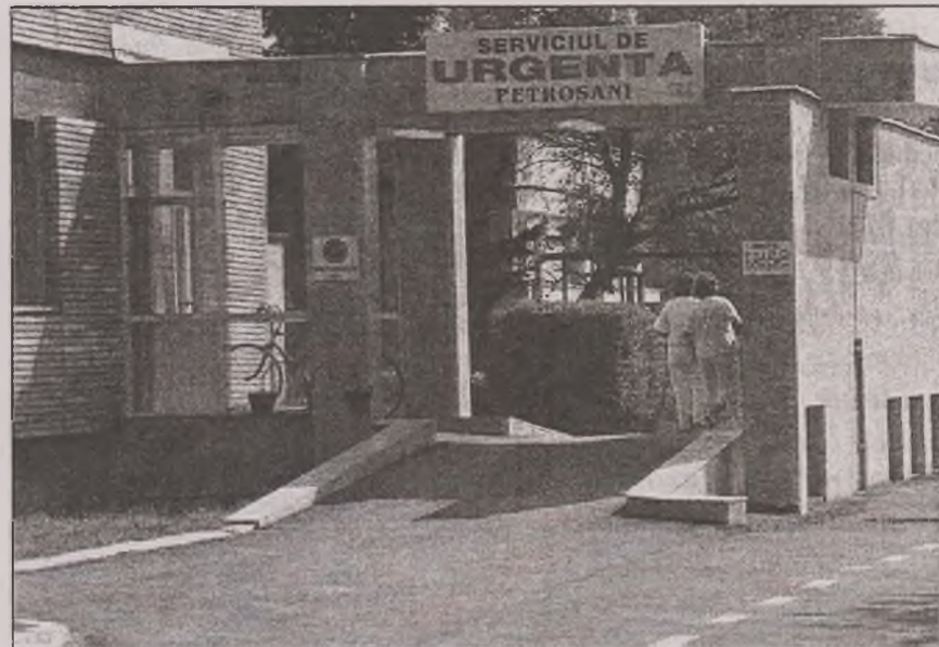
Victima a fost internată luni după masă la Spitalul de Urgență

În urma sesizării, echipa operativă din cadrul Biroului de Investigații Criminale Petroșani s-a deplasat la Spitalul de Urgență. „Ofițerul de serviciu al Poliției Municipiului Petroșani a fost sesizat telefonic de către Spitalul de Urgență Petroșani cu privire la faptul că la secția Urgență s-a prezentat un tânăr care acuză probleme de sănătate datorate consumului unor substanțe halucinogene. Tânărului i s-au recoltat probe biologice în vederea analizării naturii substanțelor ingerate și a stabilirii faptului dacă acestea sunt interzise la consum sau deținere. În cauză, se efectuează verificări pentru a