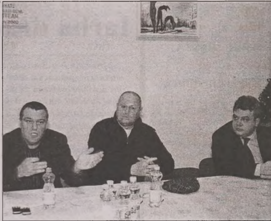
Comisia de licitație a așteptat o jumătate de oră