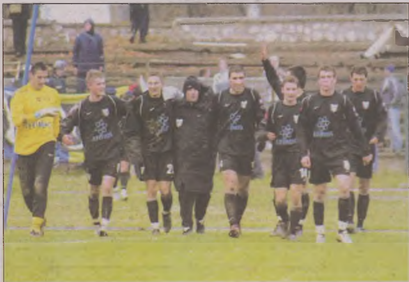
Ultima reunire a lotului Jiului a avut loc anul trecut și sunt puține șanse să se repete și în 2010