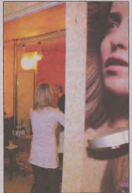
Saloanele de înfrumusețare din județ au în general clientele fidele care vin odată pe săptămână

meilor se aplică după tipul de ten. În anotimpul rece, cele mai căutate sunt cele de hidratare și oxigenare, dar și cele de purificare a tenului.