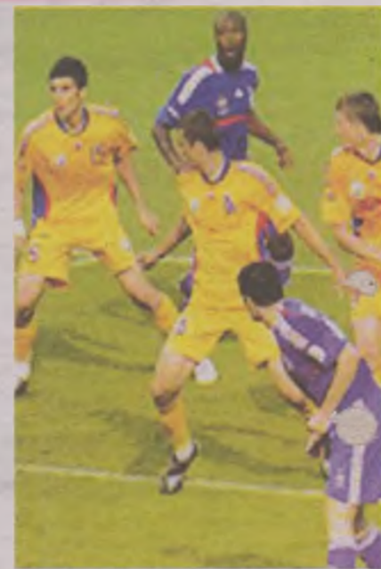
Din nou Chivu și ai săi întâlnesc Franța, iar Nașul speră ca de data aceasta să „luăm fața” Cocosului galic