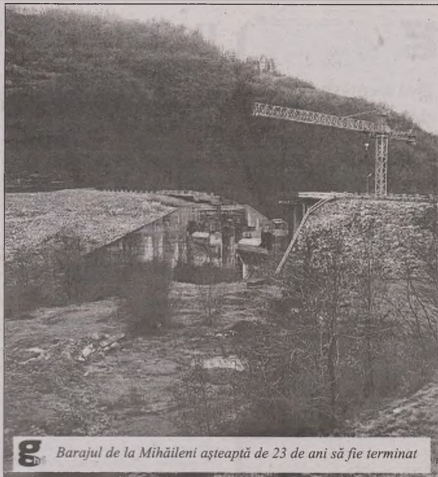
Barajul de la Mihăileni așteaptă de 23 de ani să fie terminat