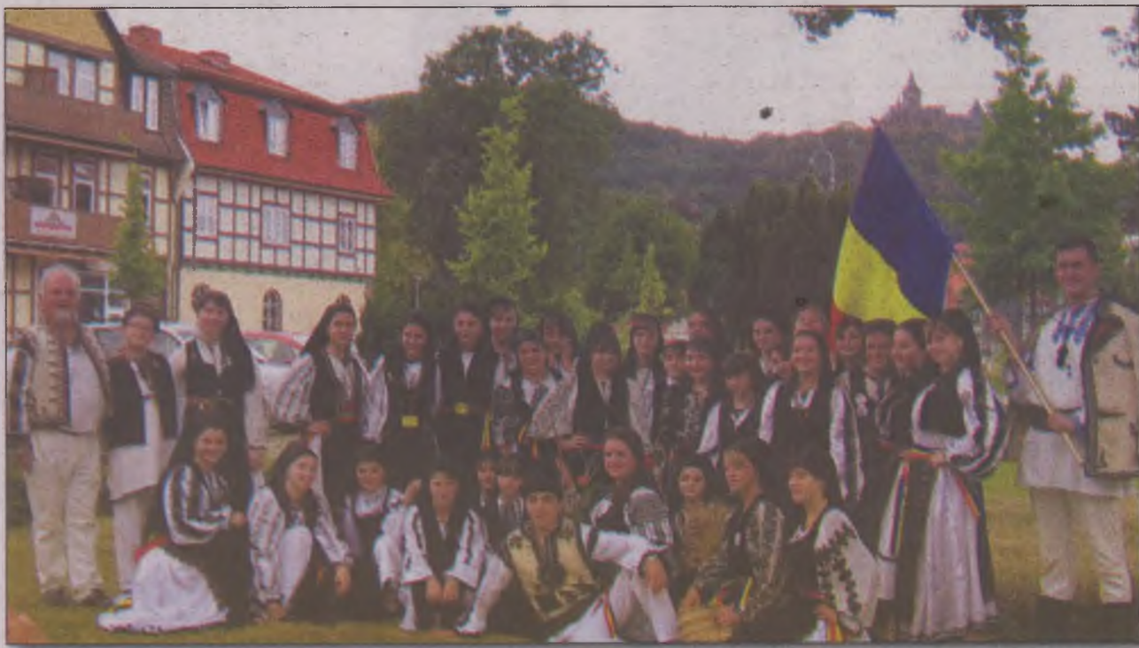
Vlăstarele Orăștiei se pot lăuda că au cântat inclusiv în fața Suveranului Pontif

Rezultatele de excepție ale corului „Vlăstarele Orăștiei” au fost posibile și datorită susținerii financiare pe care Primăria Municipiului Orăștie și Consiliul Local au acor-