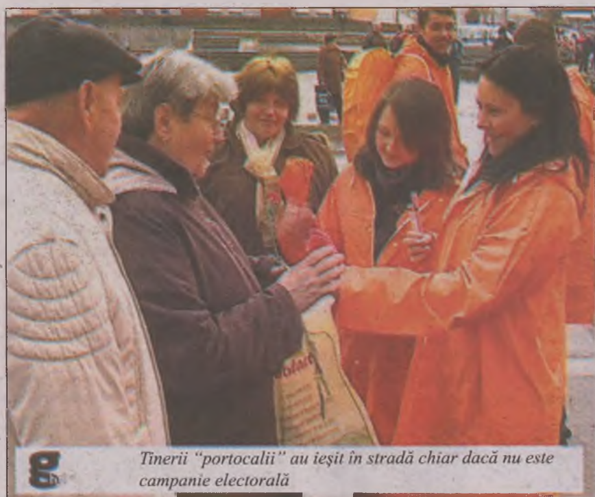
Tinerii „portocalii” au ieșit în stradă chiar dacă nu este campanie electorală