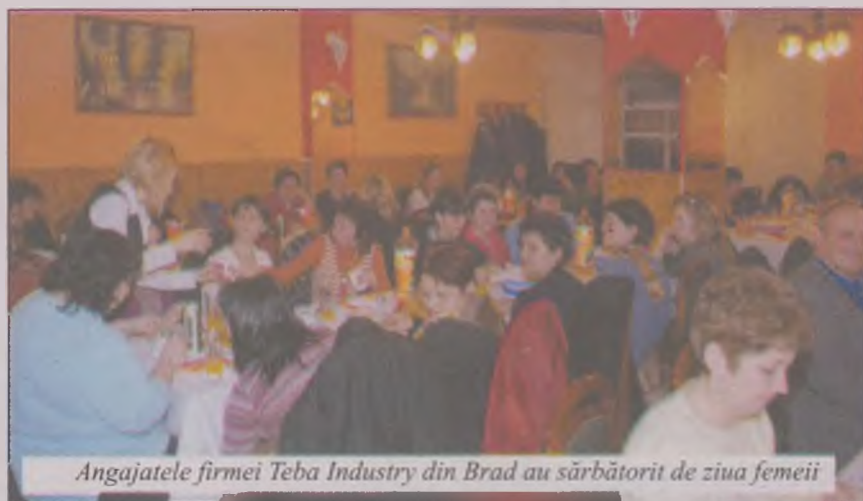
Angajatele firmei Teba Industry din Brad au sărbătorit de ziua femeii