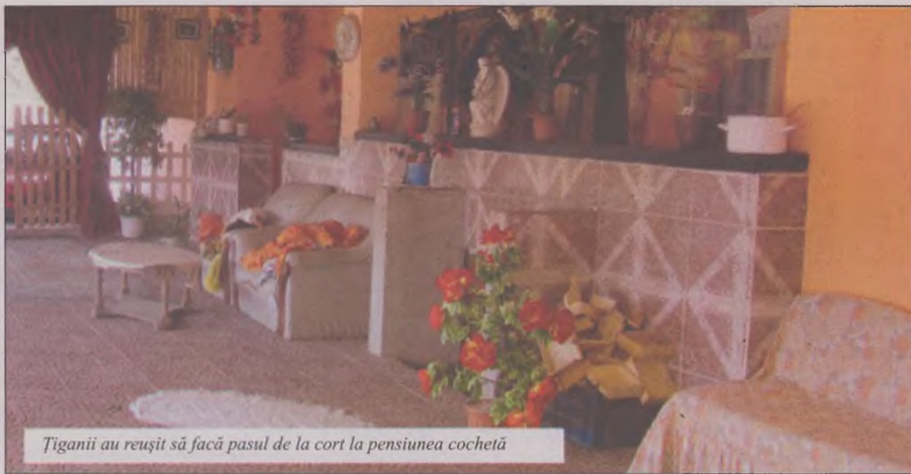
Țiganii au reușit să facă pasul de la cort la pensiunea cochetă