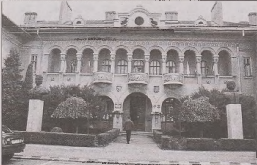
După Curtea de Conturi, la sediul Primăriei vor descinde și alte instituții de control