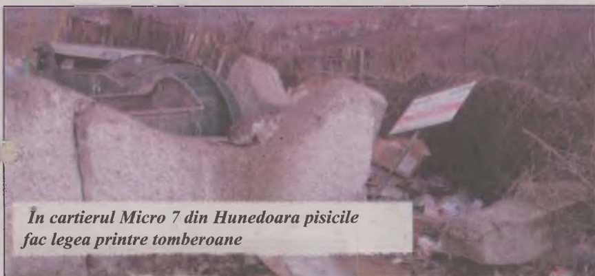
În cartierul Micro 7 din Hunedoara pisicile fac legea printre tomberoane