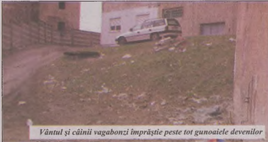
Vântul și câinii vagabonzi împrăștie peste tot gunoaiele devenilor