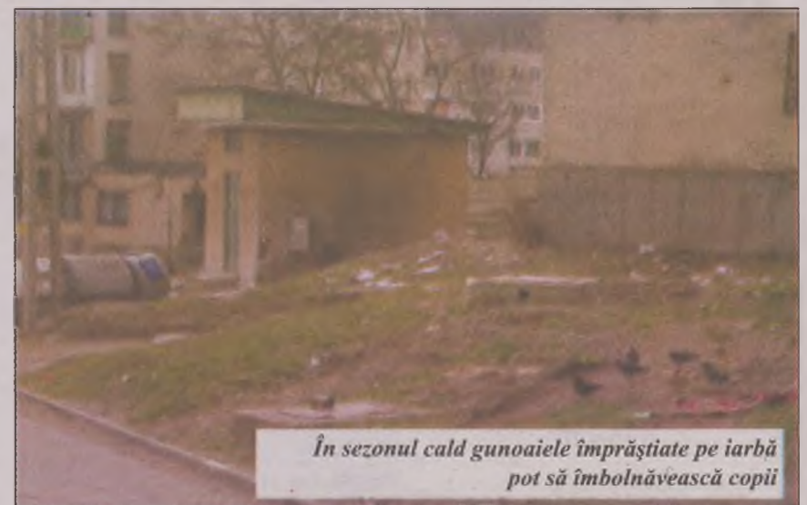
În sezonul cald gunoaiele împrăștiate pe iarbă pot să îmbolnăvească copii