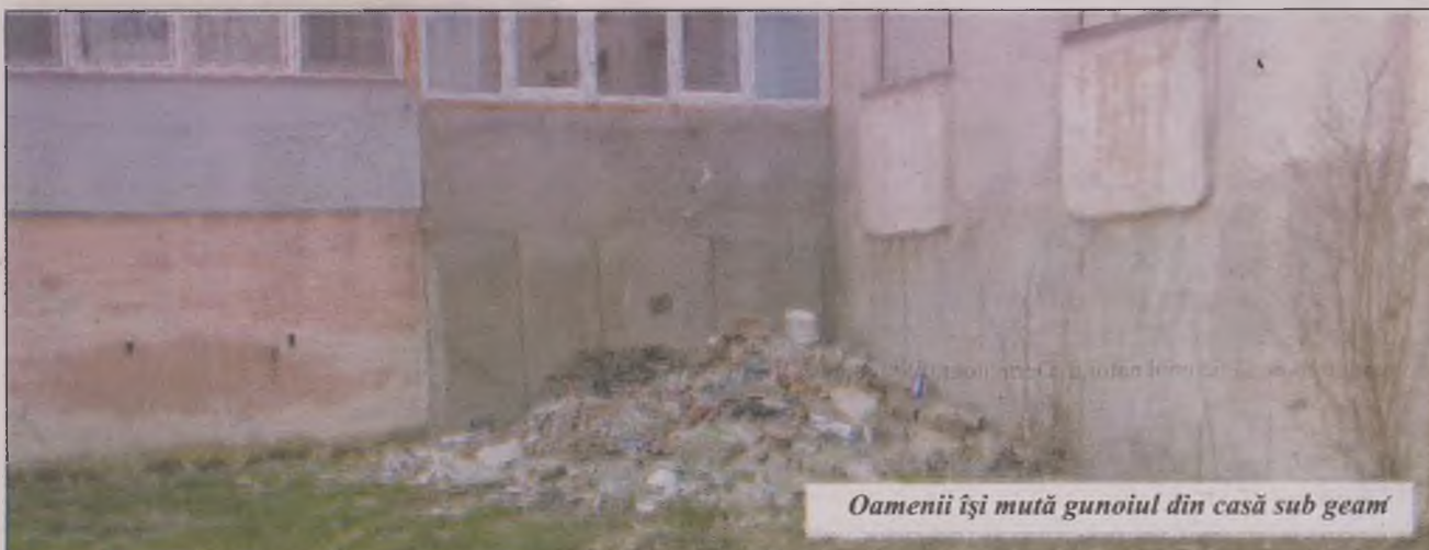
Oamenii își mută gunoiul din casă sub geam