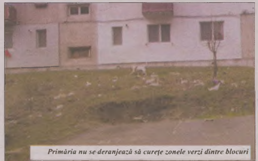
Primăria nu se deranjează să curețe zonele verzi dintre blocuri