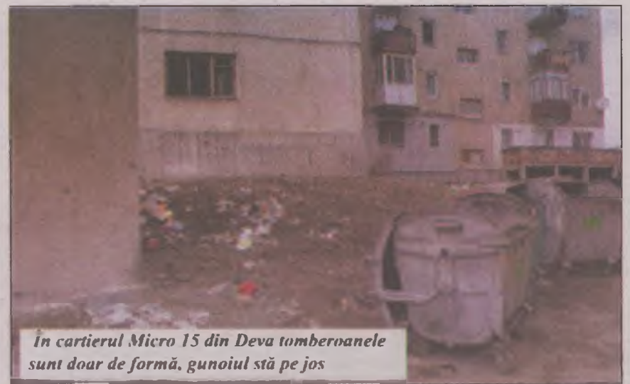
În cartierul Micro 15 din Deva tomberoanele sunt doar de formă, gunoiul stă pe jos