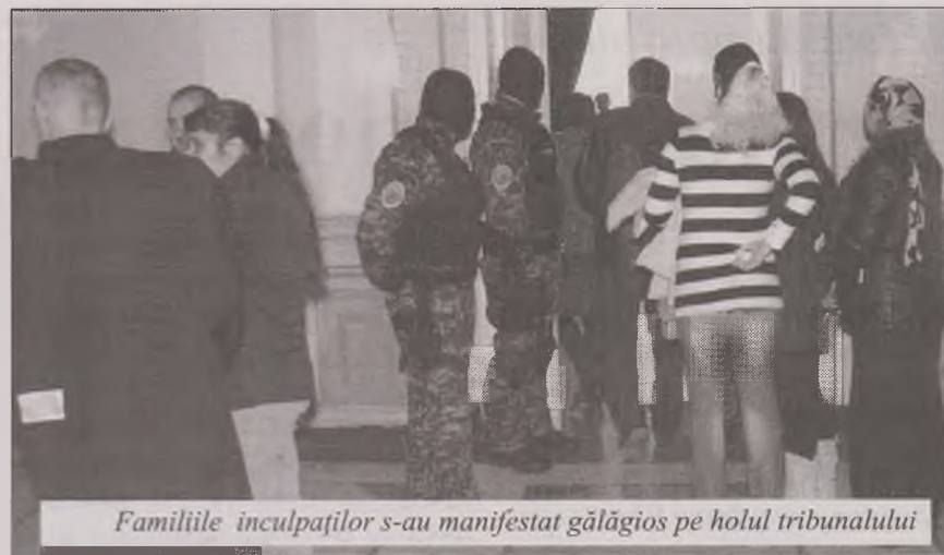
Familile inculpaților s-au manifestat gălăgios pe holul tribunalului

licita rudelor celor încarcerati să facă liniște. "Nu mai avem speranță că vor fi scoși din arest. Nu mai putem avea încredere. Ne e frică pentru pielea noastră", a spus mama unuia dintre încarcerati.