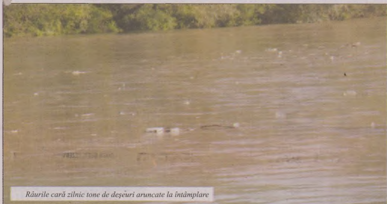
Râurile cară zilnic tone de deșeuri aruncate la întâmplare