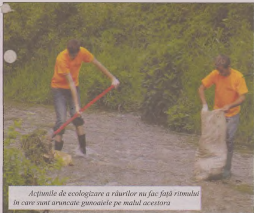
Acțiunile de ecologizare a râurilor nu fac față ritmului în care sunt aruncate gunoaiile pe malul acestora