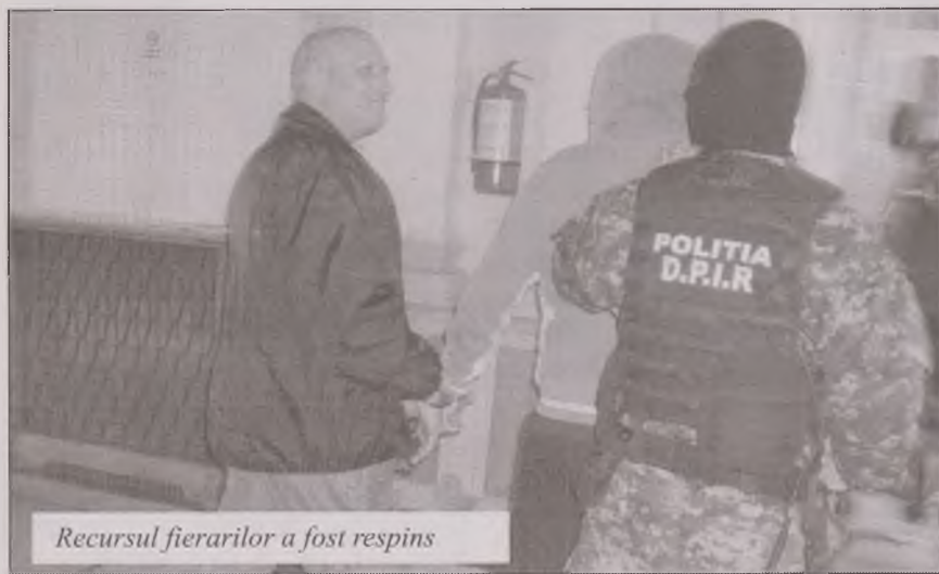
Recursul fierarilor a fost respins

Timp de trei ore rudele celor închiși au așteptat nerăbdători decizia instanței hunedorene, în fața ușii închise a sălii în care s-a desfășurat ședința. De mai multe ori polițiștii din sală au fost nevoiți să iasă pe culoarul Tribunalului Hunedoara pentru a so-