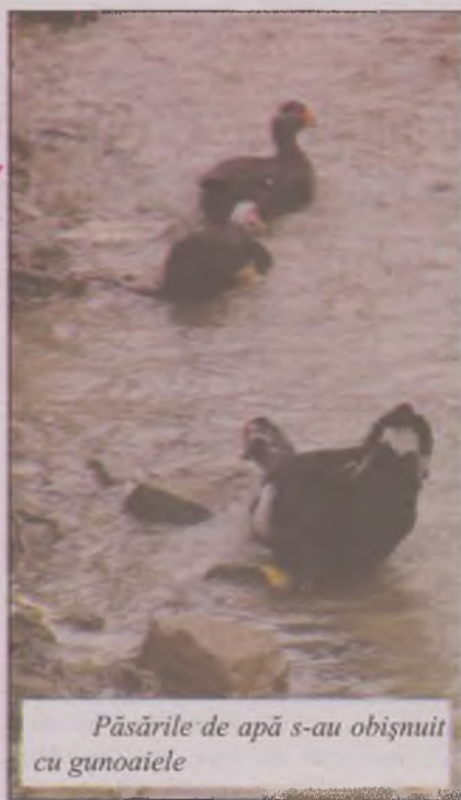
Păsările de apă s-au obișnuit cu gunoaiile