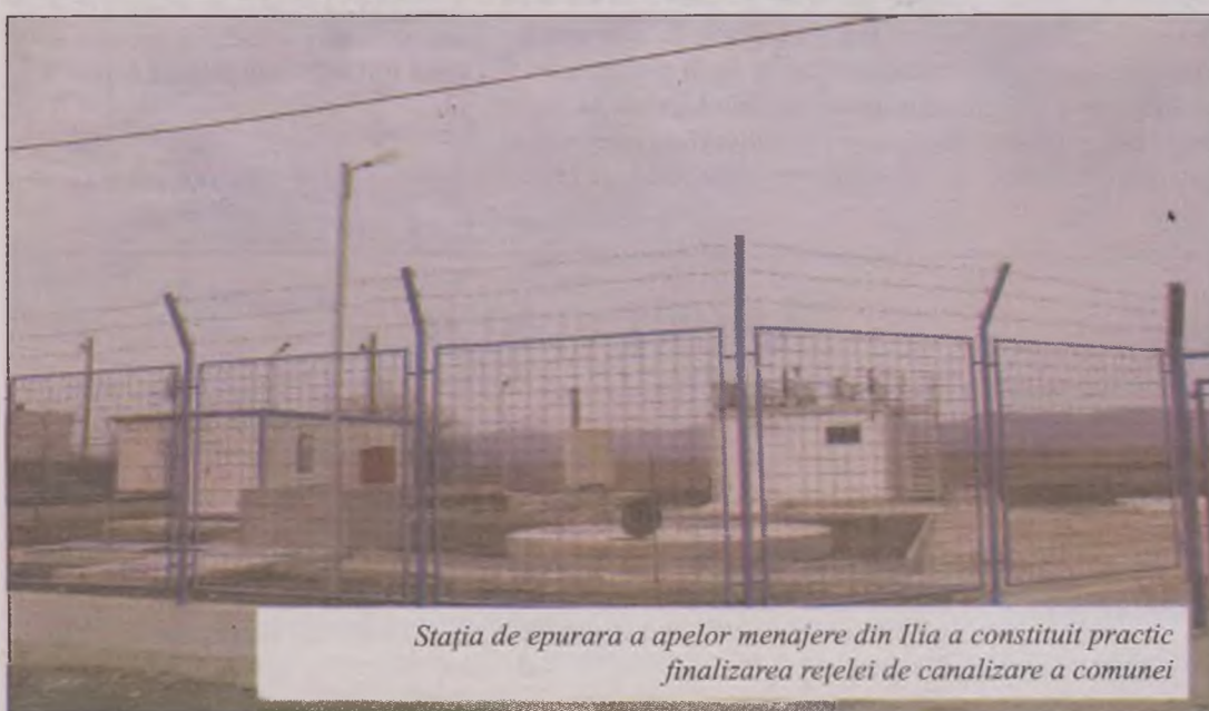
Stația de epurarea a apelor menajere din Ilia a constituit practic finalizarea rețelei de canalizare a comunei