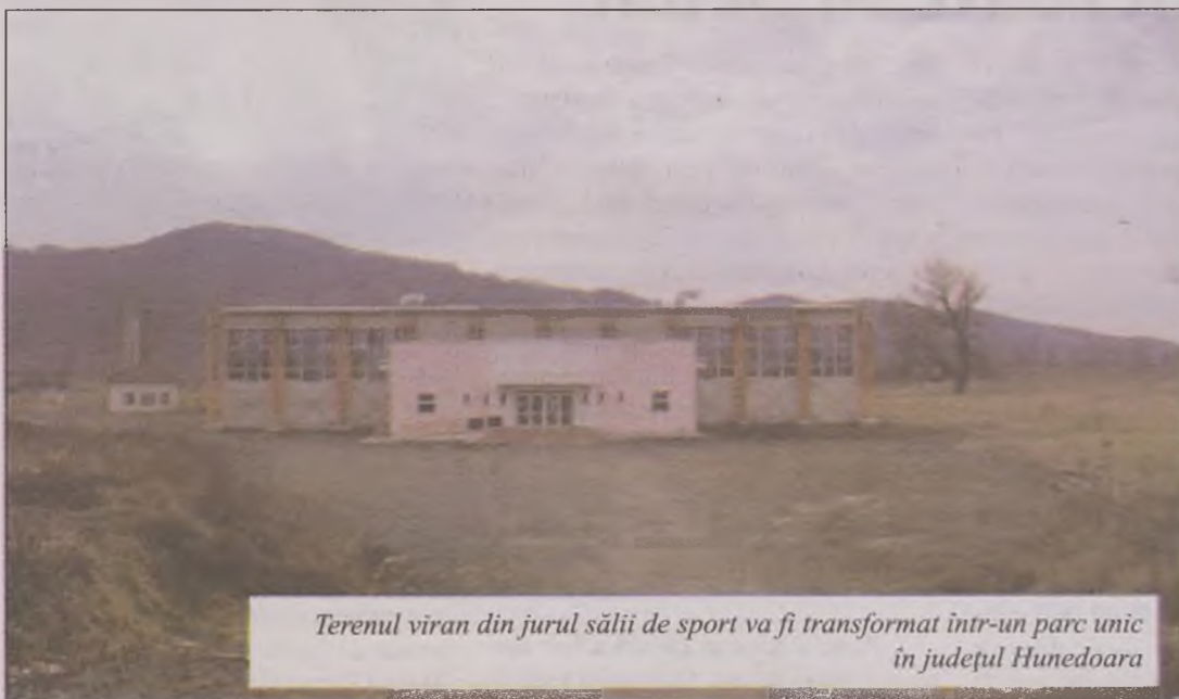
Terenul viran din jurul sălii de sport va fi transformat într-un parc unic în județul Hunedoara