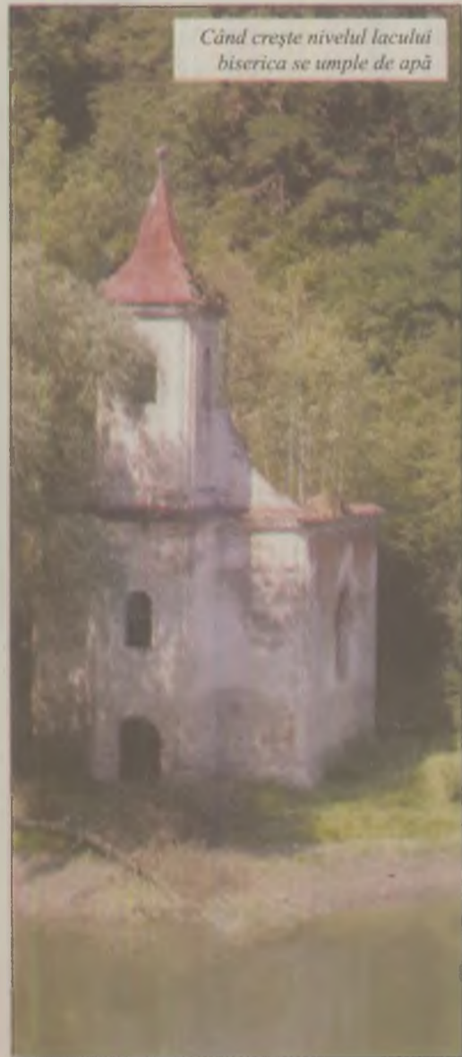
Când crește nivelul lacului biserica se umple de apă

Anii au început să se aștearnă încet-încet peste lac. În perioade de secetă nivelul apei începea să scadă iar turla uneia dintre bisericile aflate la 25 de metri sub