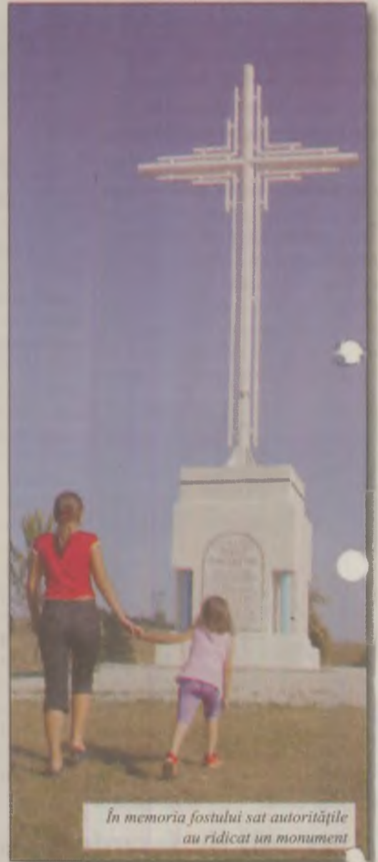
În memoria fostului sat autoritățile au ridicat un monument