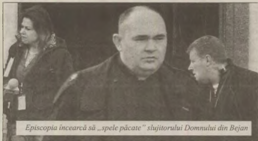
Episcopia încearcă să „spele păcate” slujitorului Domnului din Bejan