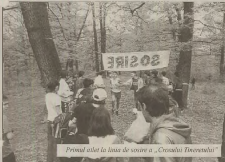
Primul atlet la linia de sosire a „Crosului Tineretului”