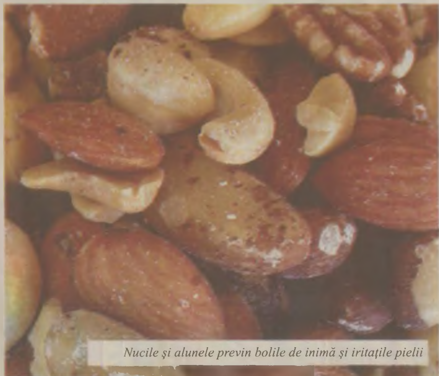
Nucile și alunele previn bolile de inimă și iritațiile pielii

Bananele sunt o sursă bogată în proteine și potasiu, au calități energizante importante. Consumul bananelor ajută în lupta împotriva insomniei, depresiei și problemelor premenstruale. Conțin antioxidanți, beta-caroten, vitamina C, vitamina B6 și ajută la prevenirea bolilor de inimă și la buna funcționare a sistemului nervos. Bananele sunt ușor de digerat și fac poftă de mâncare. De asemenea, diminuează simptomele neplăcute provocate de diaree.