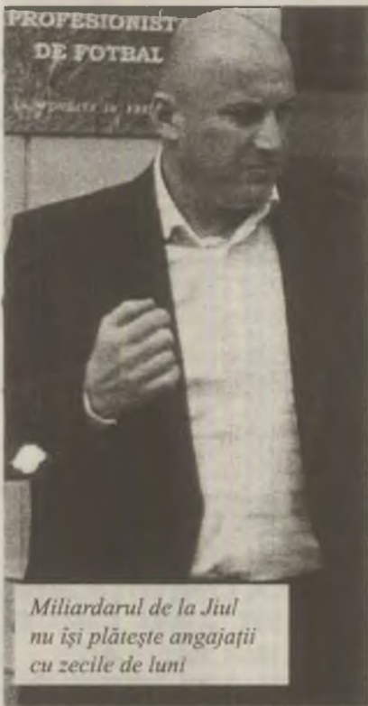
Miliardarul de la Jiul nu își plătește angajații cu zecile de luni