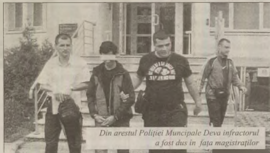
Din arestul Poliției Municipale Deva infractorul a fost dus în fața magistraților