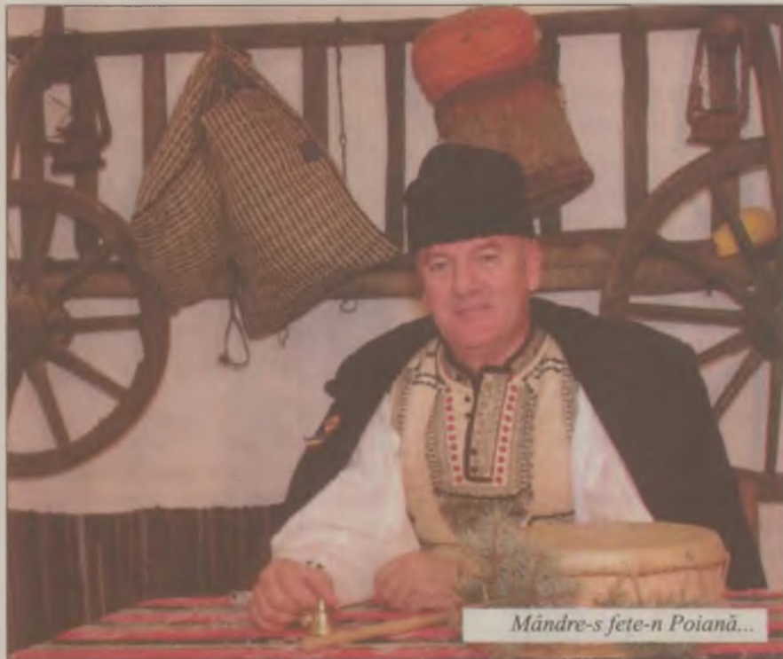
Mândre-s fete-n Poiană...

Zicerile care l-au făcut celebru pe Nelu Ban Fântână, au fost cele ale