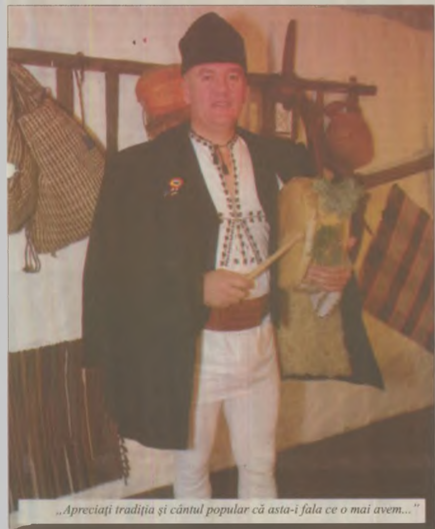
„Apreciați tradiția și cântul popular că asta-i fala ce o mai avem...”