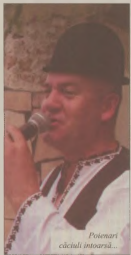
Poienari câciuli întoarsă...

Nelu crede cu tărie că artiștii sunt uniți sufletește, chiar dacă până la un mo-