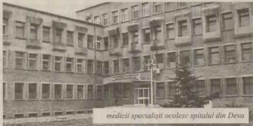
medicii specialiști ocolesc spitalul din Deva

Societate comercială din Deva angajează ospătari, ajutor ospătari, cameristă și ajutor bucătar pentru complex turistic „Steaua Mureșului”. Informații suplimentare la sediul societății din Deva, str. George Enescu, bl. 2, sc. C, ap. 22 și la telefon: 0254/234.448 între orele 8-16.