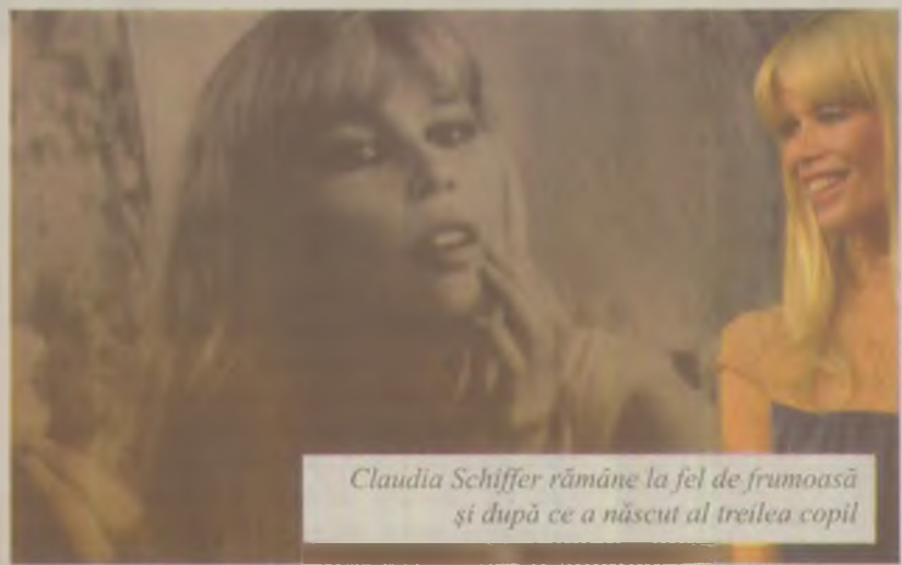
Claudia Schiffer rămâne la fel de frumoasă și după ce a născut al treilea copil

Claudia Schiffer, descoperită într-o discotecă din orașul Düsseldorf din vestul Germaniei în 1987, va împlini 40 de ani pe 25 august. Grație compatriotului ei, Karl Lagerfeld, directorul artistic al casei Chanel, Claudia Schiffer și-a câștigat celebritatea pe plan mondial, după ce a devenit imaginea renumitei case de modă pariziene.