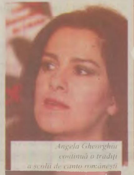
Angela Gheorghiu continuă o tradiție a școlii de canto românești

Totodată, corul "Only Men Aloud" a primit premiul pentru cel mai bun album al anului - "Band of Brothers", la o categorie unde a concurat și papa Benedict al XVI-lea, în timp ce muzica filmului "Revolutionary Road", de Sam Mendes, cu Kate Winslet în rolul principal, a primit premiul pentru coloana sonoră a