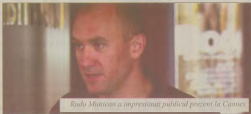
Radu Muntean a impresionat publicul prezent la Cannes

"Totul sună destul de banal pentru un film de artă, dar, pentru că geniul de regizor prezintă povestea într-o manieră proaspătă, Muntean poate fi inclus în constelația valorilor", mai apreciază LA Times, care subliniază că în prezentarea lui Muntean "nu există isterie de tipul «vorbelor de alint/