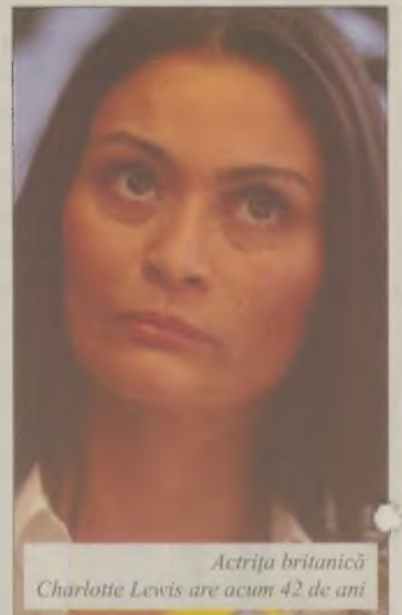
Actrița britanică Charlotte Lewis are acum 42 de ani

"Cuvintele pe care le-am folosit sunt cuvintele pe care le-am folosit", a spus Allred, când a fost întrebată de-