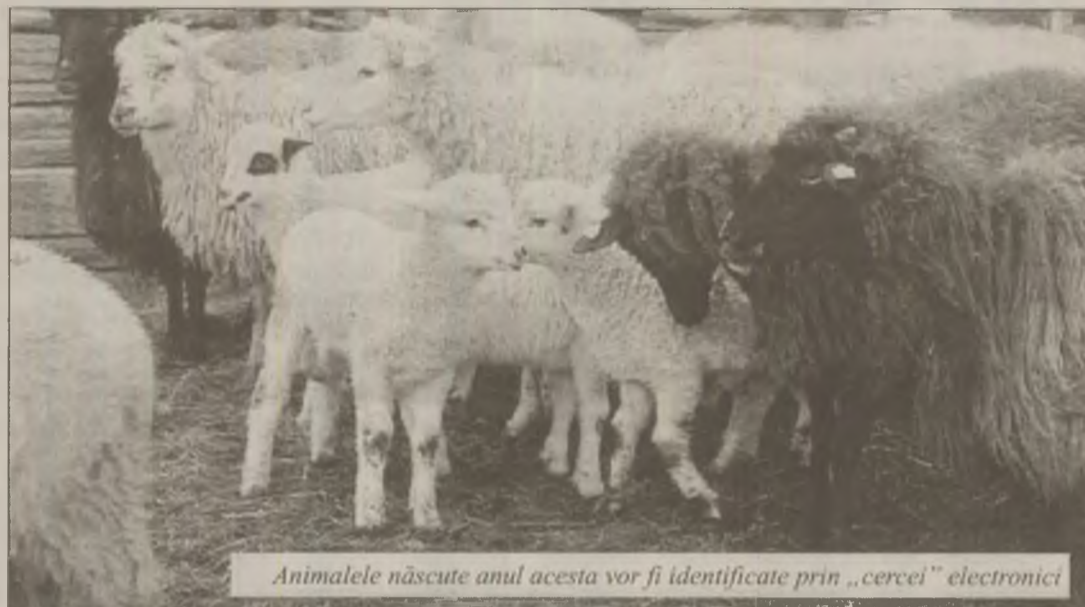
Animalele născute anul acesta vor fi identificate prin „cercei” electronici

În acest an acțiunea de identificare și înregistrare a animalelor este încă finanțată de Autoritatea Națională Sanitar-Veterinară și pentru Siguranța Alimentelor (ANSVSA). Manopera privind identificarea și înregistrarea bovinelor costă 16,0 lei per cap de animal, a ovinelor și caprinelor (două crotalii) costă 3,5 lei per cap de animal, iar cu o singură crotalie costă 2,9 lei per cap de animal. În ceea ce privește manopera por-