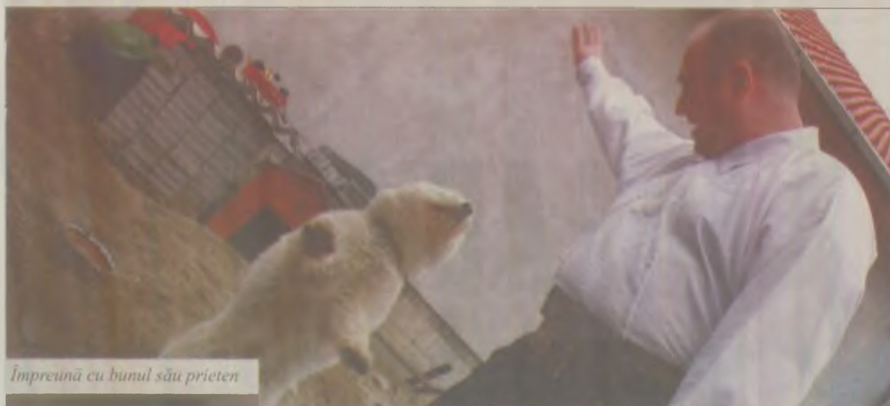
Împreună cu bunul său prieten