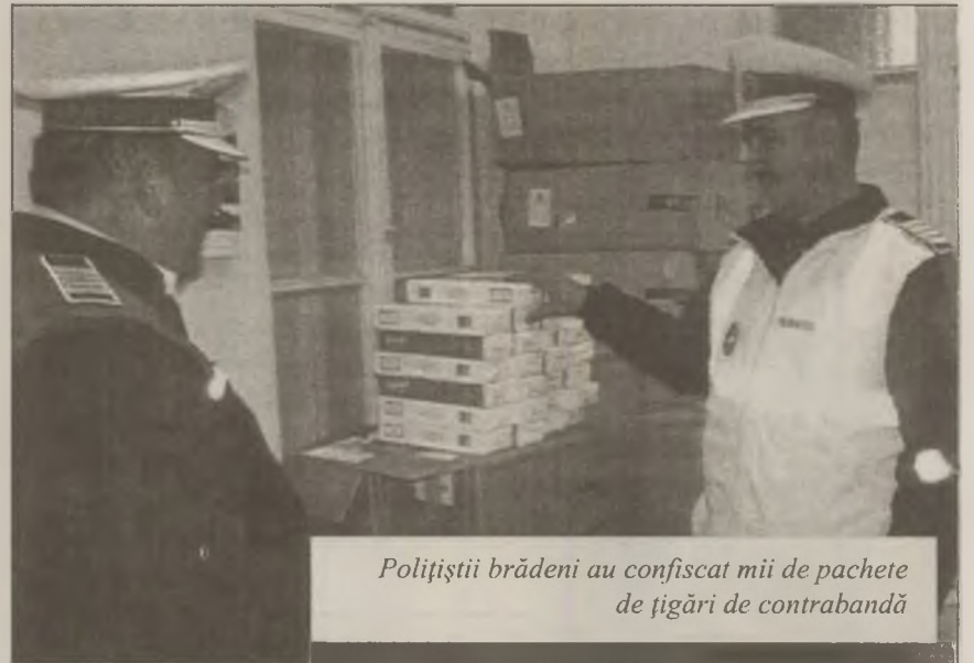
Polițiștii brădeni au confiscat mii de pachete de țigări de contrabandă