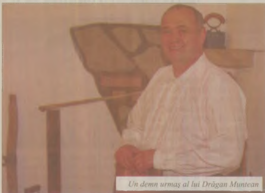
Un demn urmaș al lui Drăgan Muntean