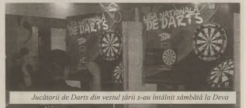
Jucătorii de Darts din vestul țării s-au întâlnit sâmbătă la Deva

Cei mai buni jucători de Darts din vestul țării s-au întrecut sâmbătă la Deva. La concurs s-au strâns peste patruzeci de participanți din Timișoara, Cluj, Lugoj, Arad, Reghin și Deva. Competiția a fost organizată de Asociația Sportivă Darts Club Banat Crișana din Timișoara și s-a desfășurat în complexul comercial Deva Mall.