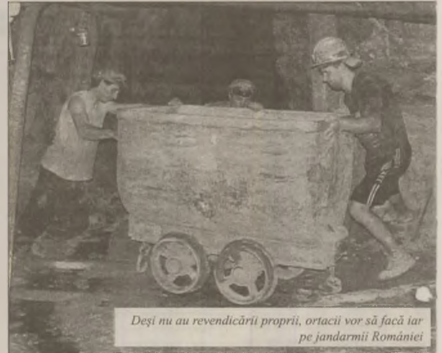
Deși nu au revendicării proprii, ortacii vor să facă iar pe jandarmii României