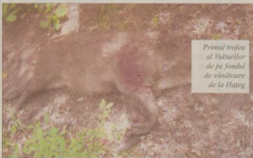
Primul trofeu al Vulturilor de pe fondul de vânătoare de la Hațeg