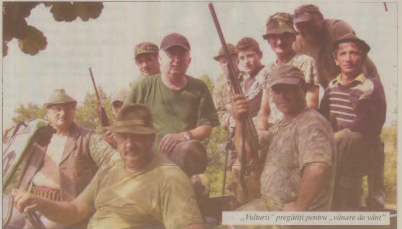
„Vulturii” pregătiți pentru „vânare de vânt”