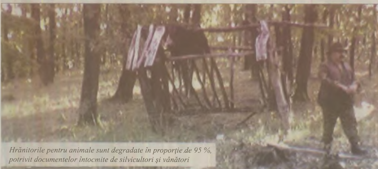
Hrăniturile pentru animale sunt degradate în proporție de 95 %, potrivit documentelor întocmite de silvicultori și vânători