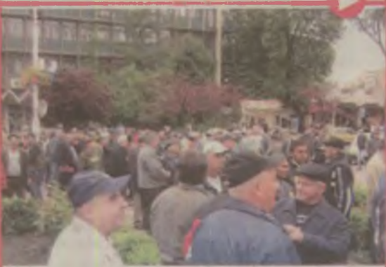
Foștii minieri au protestat în Valea Jiului