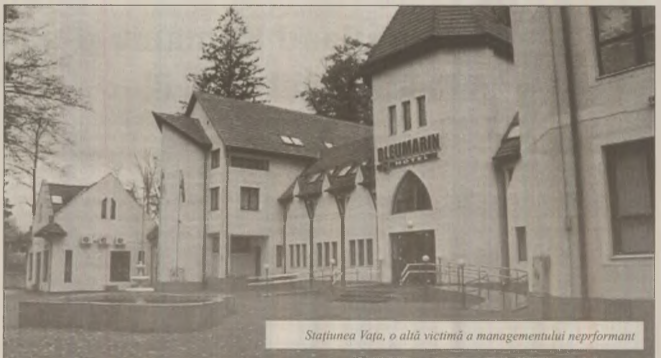
Stațiunea Vața, o altă victimă a managementului neperformant