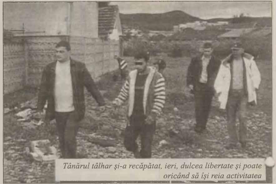
Tânărul tâlhar și-a recăpătat, ieri, dulcea libertate și poate oricând să își reia activitatea