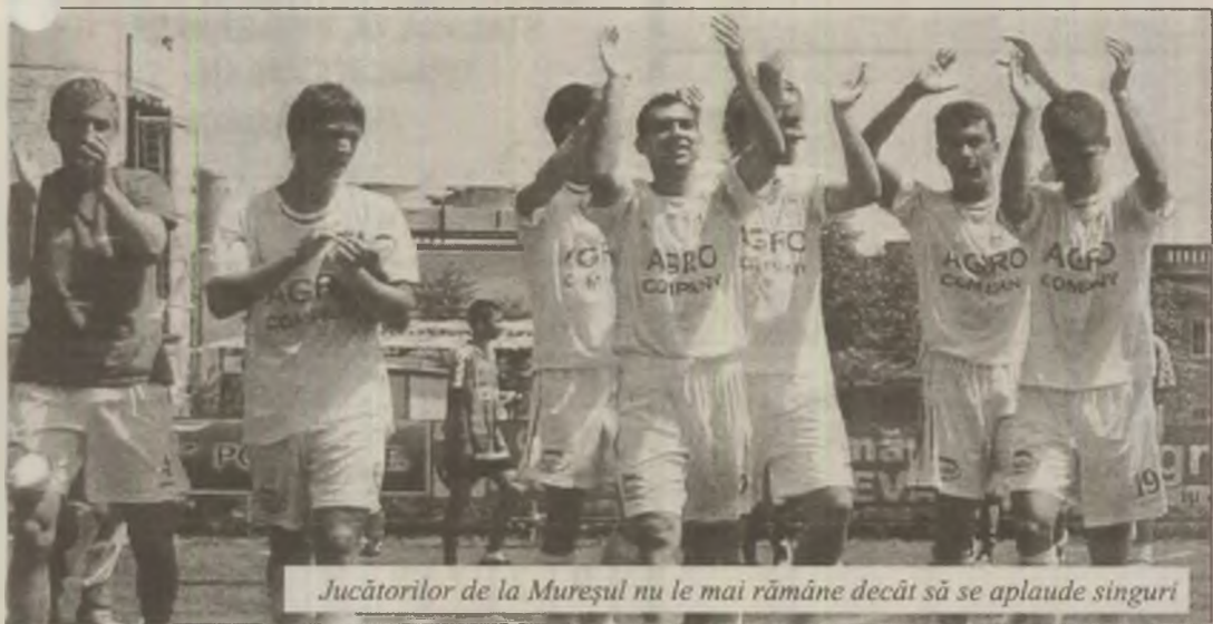
Jucătorilor de la Mureșul nu le mai rămâne decât să se aplaude singuri