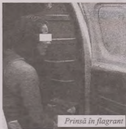
Prinsă în flagrant

În urma acestei acțiuni a fost prinsă în flagrant, în zona Sântuhalm,