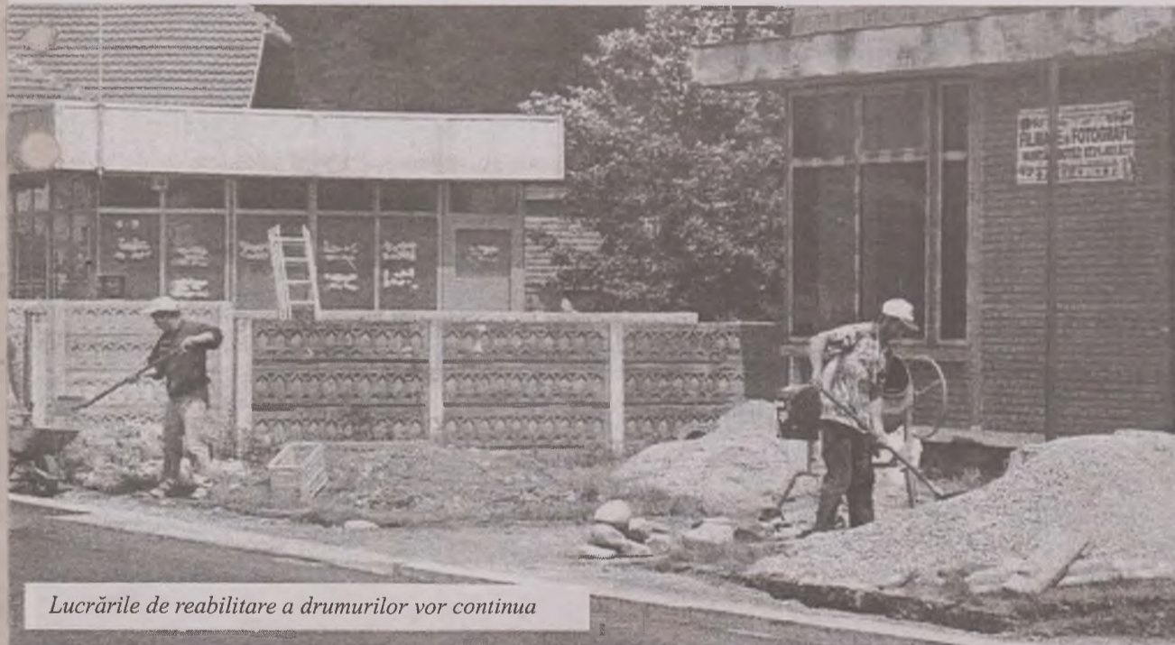
Lucrările de reabilitare a drumurilor vor continua

Viitorul stadion se vrea a fi foarte modern, cu vestiare, dușuri și tribună.