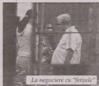
La negociere cu „fetițele”

Totodată, polițiștii deveni au depistat mai multe prostituate, care își fac veacul pe marginea Drumului Național 7, care atrăgeau „clienți”, din rândul conducătorilor auto. Acestea au fost sancționate contravențional.