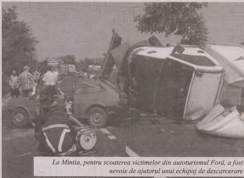
La Mintia, pentru scoaterea victimelor din autoturismul Ford, a fost nevoie de ajutorul unui echipaj de descarcerare