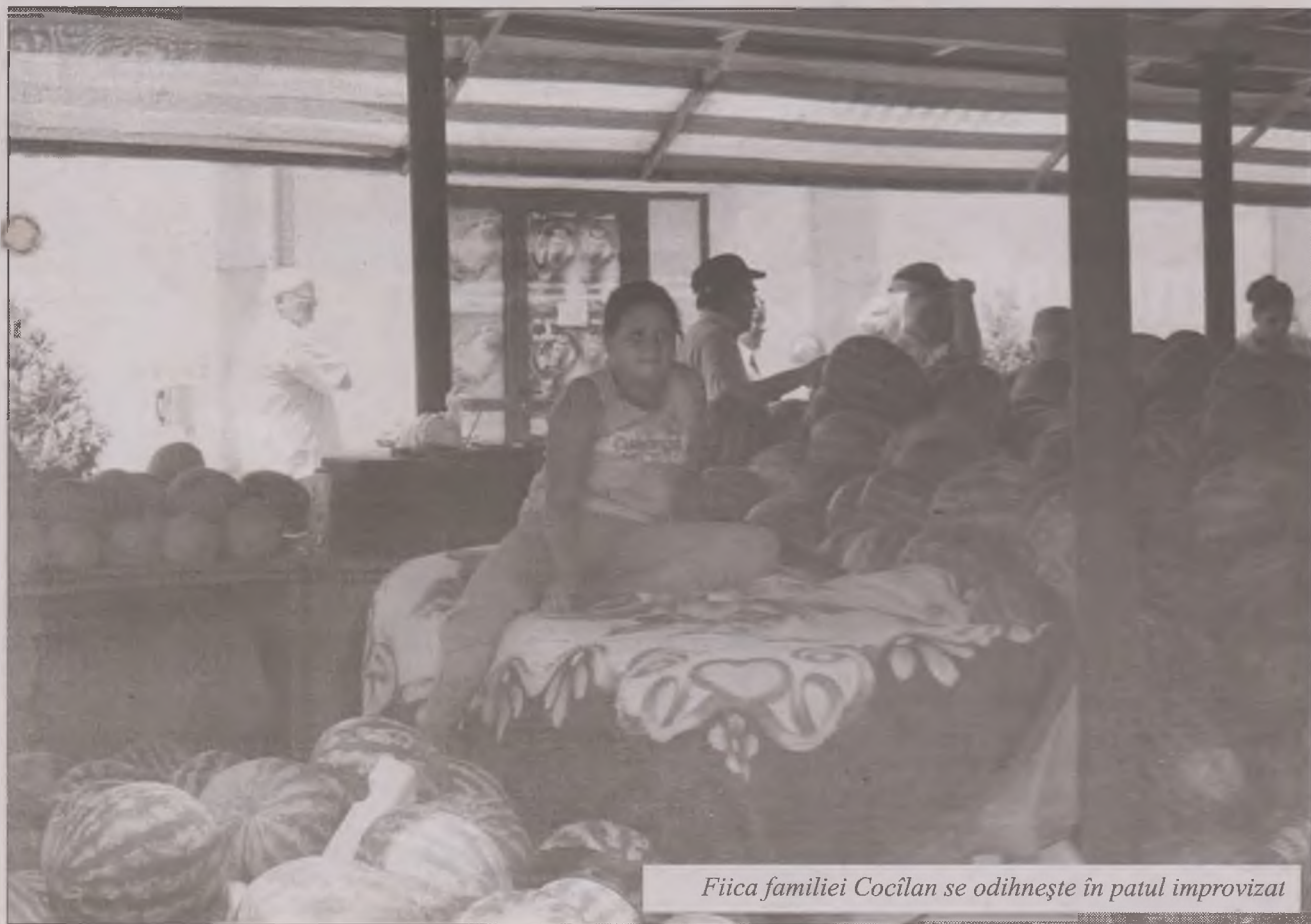
Fiica familiei Cocîlan se odihnește în patul improvizat