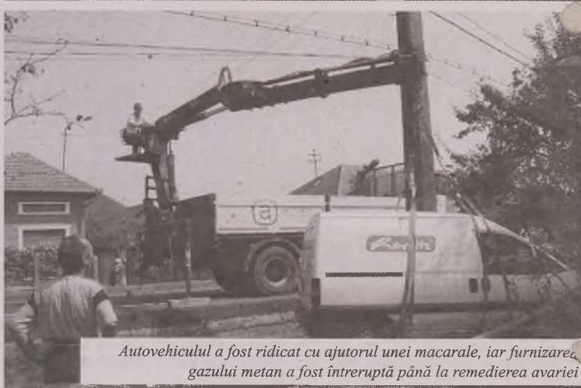
Autovehiculul a fost ridicat cu ajutorul unei macarale, iar furnizarea gazului metan a fost întreruptă până la remedierea avariei