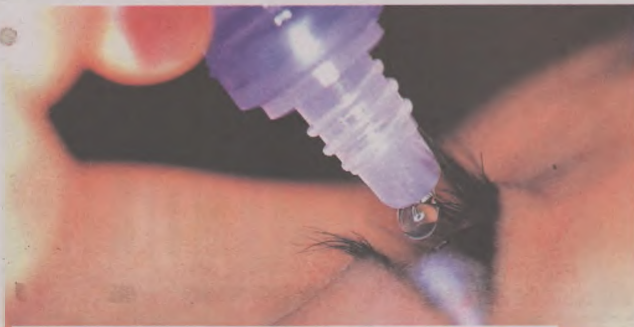
Picăturile oculare trebuie administrate fără ca globul ocular să fie atins de picuratorul recipientului

expunerile la alergeni (polen, praf, lentile de contact). Utilizarea picăturilor oculare este tratamentul cel mai frecvent folosit în eradicarea conjunctivitelor, de aceea este foarte important ca aplicarea acestuia să se facă corect. Este obligatorie citirea cu atenție a prospectului medical înainte aplicării tratamentului. Trebuie evitată atingerea directă a conjunctivei cu picuratorul recipientului, pentru a evita contaminarea acestuia cu agentul infecțios (bacterie sau virus). După aplicarea soluției în unghiul ocular median (deasupra sacului lacrimal), se închid pleoapele și se mențin ochii închiși pentru 1-2 minute, pentru a favoriza absorbția locală a medicamentului. De obicei, sunt indicate 3-4 aplicații locale în fiecare zi pentru o perioadă de 5-7 zile, în funcție de tipul produsului utilizat. Trebuie să se rețină că recipientul cu soluție oftalmică este folosit de o singură persoană și nu trebuie utilizat în comun, de asemenea acesta nu mai poate fi reutilizat cu o altă ocazie, termenul de valabilitate al acestuia fiind de aproximativ 30 de zile, după prima utilizare.