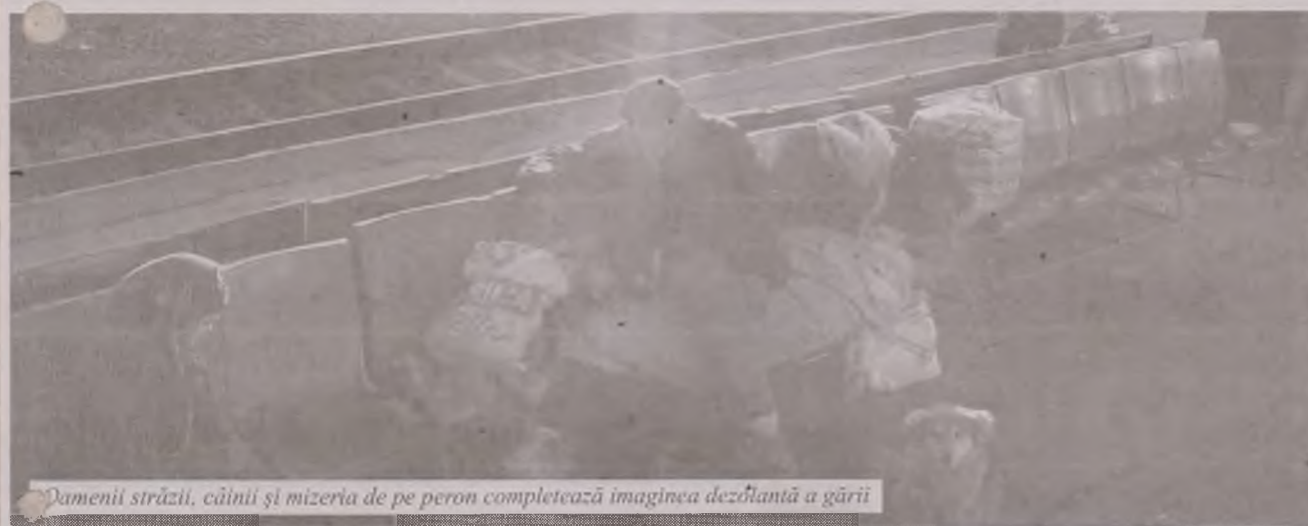
Oamenii străzii, câinii și mizeria de pe peron completează imaginea dezolantă a gării

Odată una din cele mai frumoase și moderne gări din județ, gara din Deva a ajuns acum unul din locurile în care orice călător nu vrea să stea mai mult de cinci minute în așteptarea trenului. Scaune rupte, haite de câini, oameni ai străzii care își au culcușul în sălile de așteptare sau în vagoanele părăsite. Mirosuri greu de suportat și mizerie la tot pasul. Acesta este peisajul care întâmpină pe oricine poșește în gara reședinței de județ.