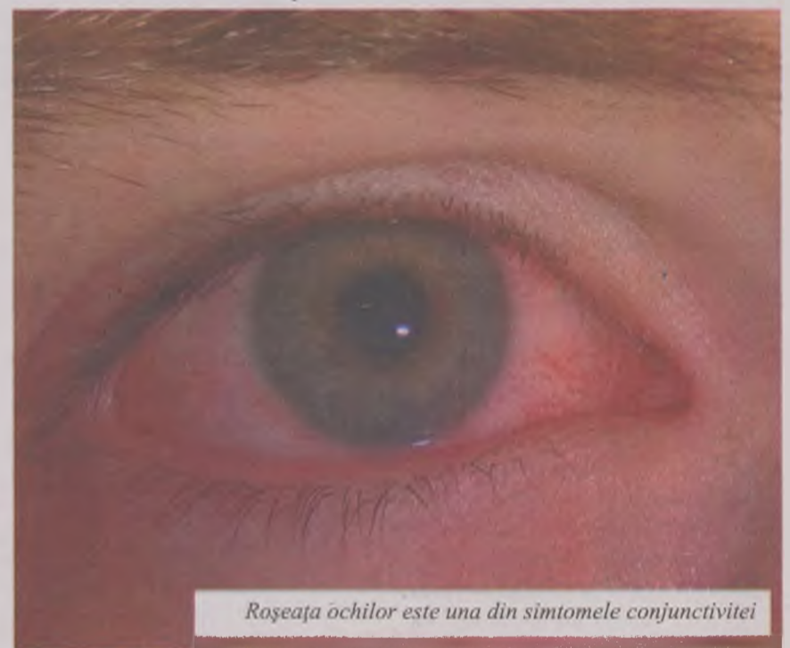
Roșeața ochilor este una din simptomele conjunctivitei

Conjunctivita determinată de iritații poate să apară de la contactul ochilor cu substanța chimică sau de la un corp străin. Iritația este mărită de încercările de a scoate corpul din ochi și de frecarea ochiului cu