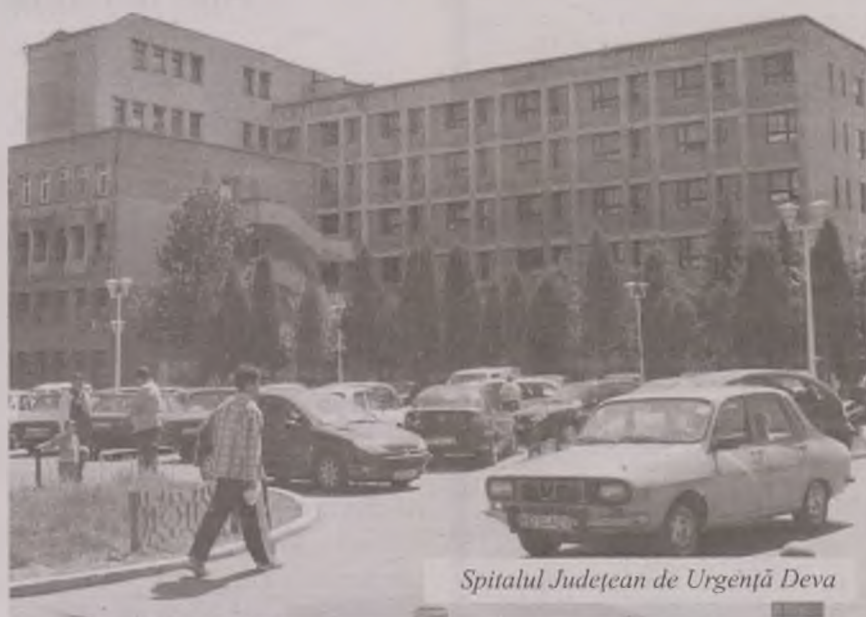
Spitalul Județean de Urgență Deva