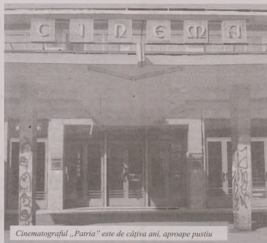
Cinematograful „Patria” este de câțiva ani, aproape pustiu

Majoritatea tinerilor n-au mai călcat pragul cinematografului din Deva de ani buni. „Îmi aduc aminte că atunci când eram la școală veneam cu clasa și cu doamna învățătoare să urmărim filme de animație. Și acum mi-a rămas întipărit „101 dalmajeni” văzut aici la cinema. Fără să exagerez nu cred că am mai fost la trei filme de atunci. Nici nu prea mai convenabil, atâta vreme cât acasă am cele mai noi filme, la o calitate suficient de bună, pe gratis. Iar dacă, țin cu tot dinadinsul să văd la cinema un film ca „Avatar” de exemplu, fac tot posibilul să merg să îl văd la Timișoara, la