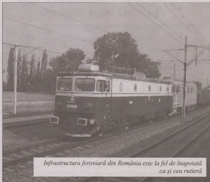
Infrastructura feroviară din România este la fel de înapoiată ca și cea rutieră

Proiectul, în valoare de peste 1,36 de miliarde de lei plus TVA este cofinanțat din fonduri de coeziune, bani de la Guvern și un împrumut de la BEI. Astfel o parte din fondurile necesare lucrării, respectiv 355.680.000 euro, au fost accesate prin Programul Operațional Sectorial - Transport 2007 - 2013, iar Guvernul va trebui să aloce suma de 173.320.000 euro. De asemenea, România a încheiat încă în anul