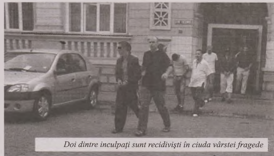
Doi dintre inculpați sunt recidiviști în ciuda vârstei fragede