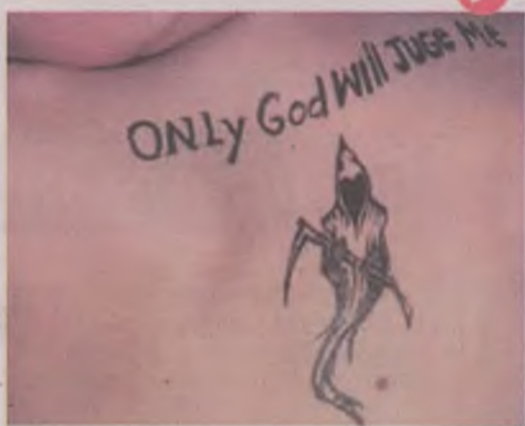
Tatuajele temporare - un pericol pentru sănătatea pielii