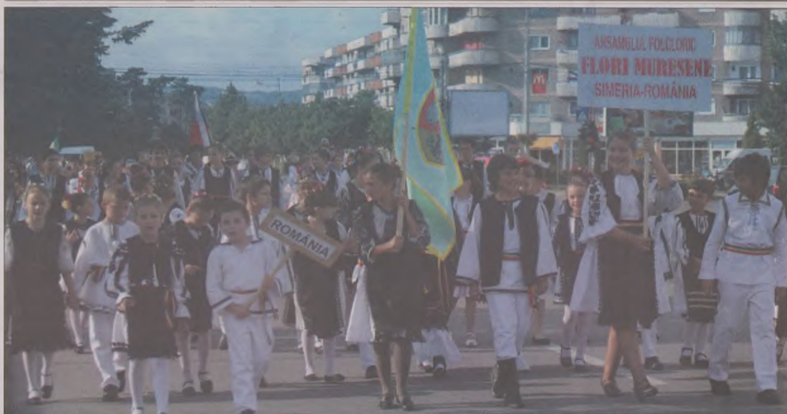
Cea de-a XI-cea ediția a Festivalului Internațional de Folclor pentru copii și tineret „Carpatica” a debutat, ieri seară, în fața Casei de Cultură „Dragan Muntean” din Deva. Zeci de tinere talente atât din România, cât și din țări precum Cehia, Serbia, Turcia, Grecia și Ungaria au defilat în straie populare specifice fiecărei zone, după care au încântat publicul cu recitaluri de muzică folclorică și dansuri populare.

Bârfe despre cum e cu puțință, ce și cum