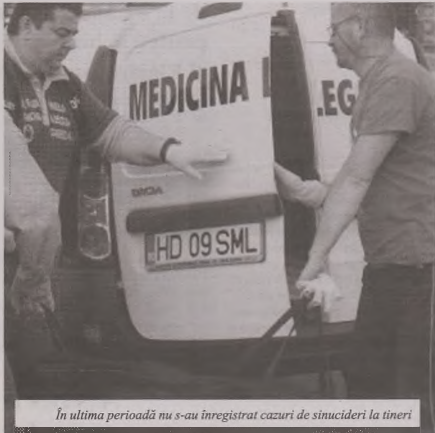
În ultima perioadă nu s-au înregistrat cazuri de sinucideri la tineri

Compania Națională "MINVEST" S.A. DEVA, Piața Unirii nr.9, închiriază 4 birouri situate în sediul companiei la etajele 2 și 3, cu suprafețe de 20 mp fiecare. Solicitățile se depun în scris la secretariatul companiei sau la fax nr. 0254-213641.