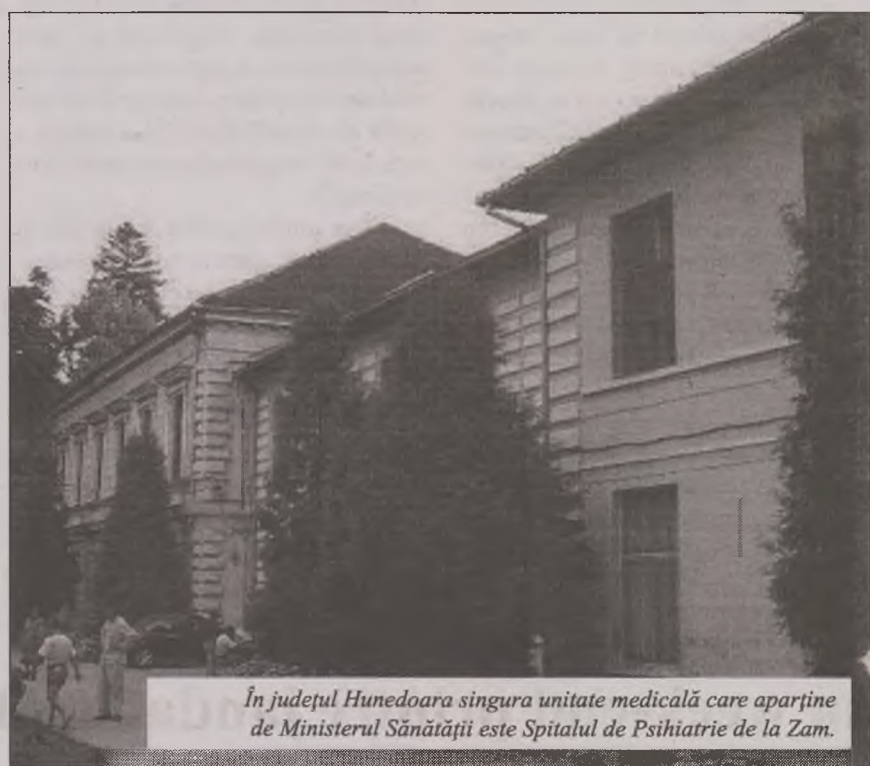
În județul Hunedoara singura unitate medicală care aparține de Ministerul Sănătății este Spitalul de Psihiatrie de la Zam.