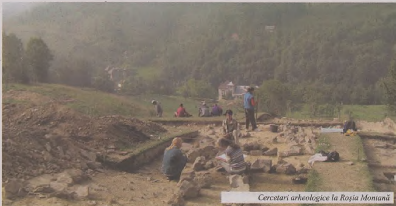
Cercetari arheologice la Roșia Montană