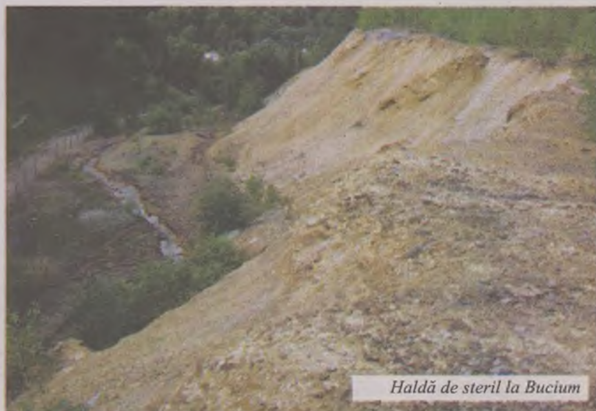
Haldă de steril la Bucium