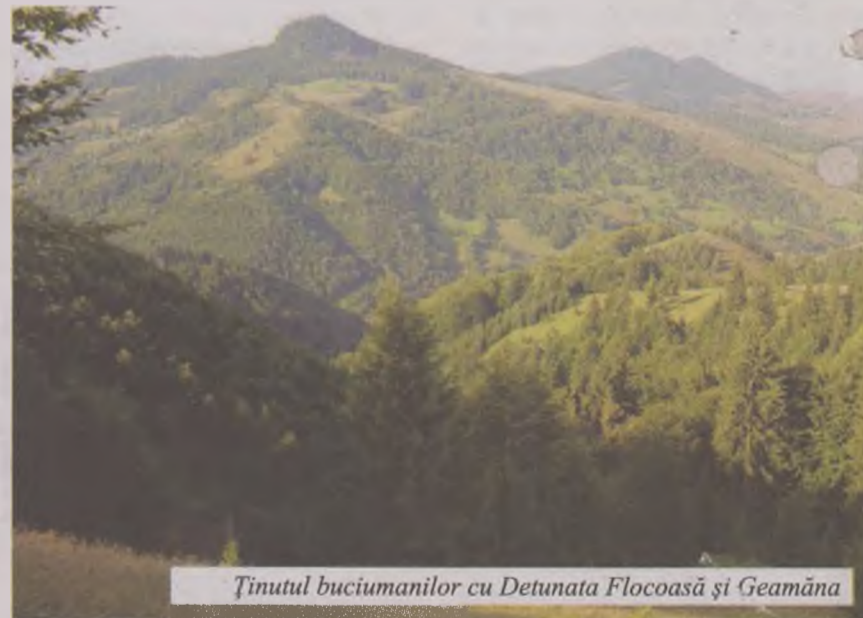
Ținutul buciumanilor cu Detunata Flocoasă și Geamăna