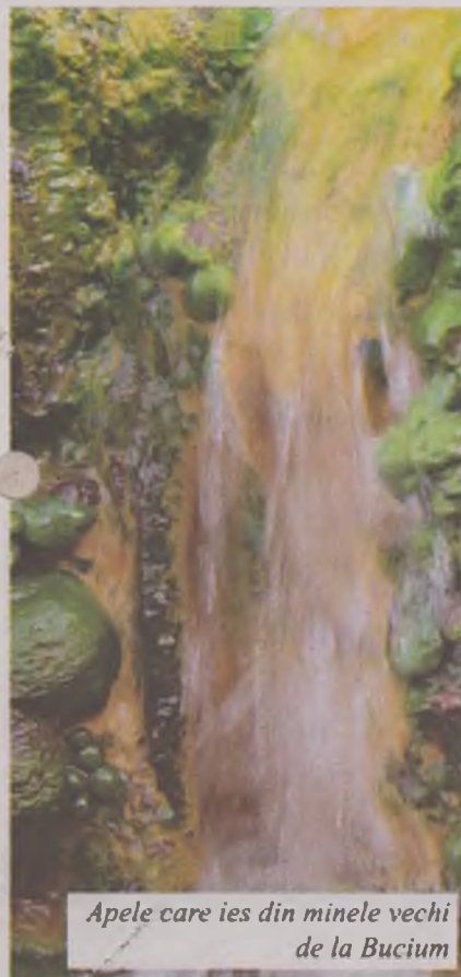
Apele care ies din minele vechi de la Bucium

În locuri înalte și deschise ca și acesta din „Poiana narciselor” trebuie să se fi întâlnit la sărbătorile mari de peste an, așa cum se mai întâlnesc și azi