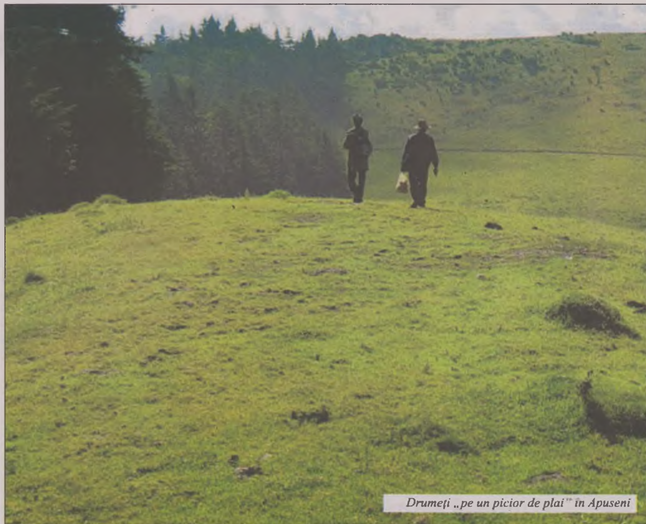
Drumeți „pe un picior de plai” în Apuseni