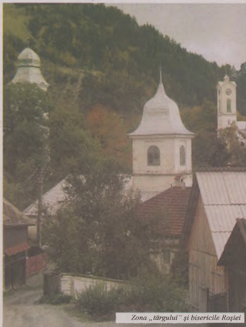
Zona „tărgului” și bisericile Roșiei