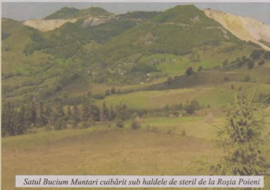
Satul Bucium Muntari cuibărit sub haldele de steril de la Roșia Poieni