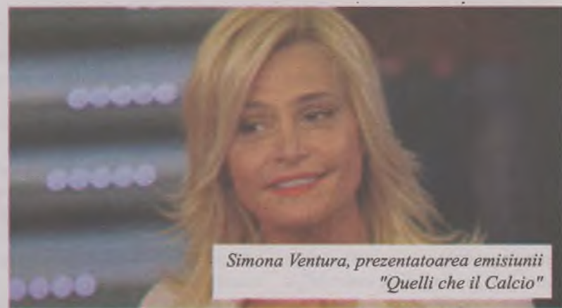
Simona Ventura, prezentatoarea emisiunii "Quelli che il Calcio"

Membrii rețelelor mafioate din Italia își trimit mesaje codificate prin intermediul unei emisiuni dedicate fotbalului. Asta au descoperit recent polițiștii italieni, informează The Telegraph.