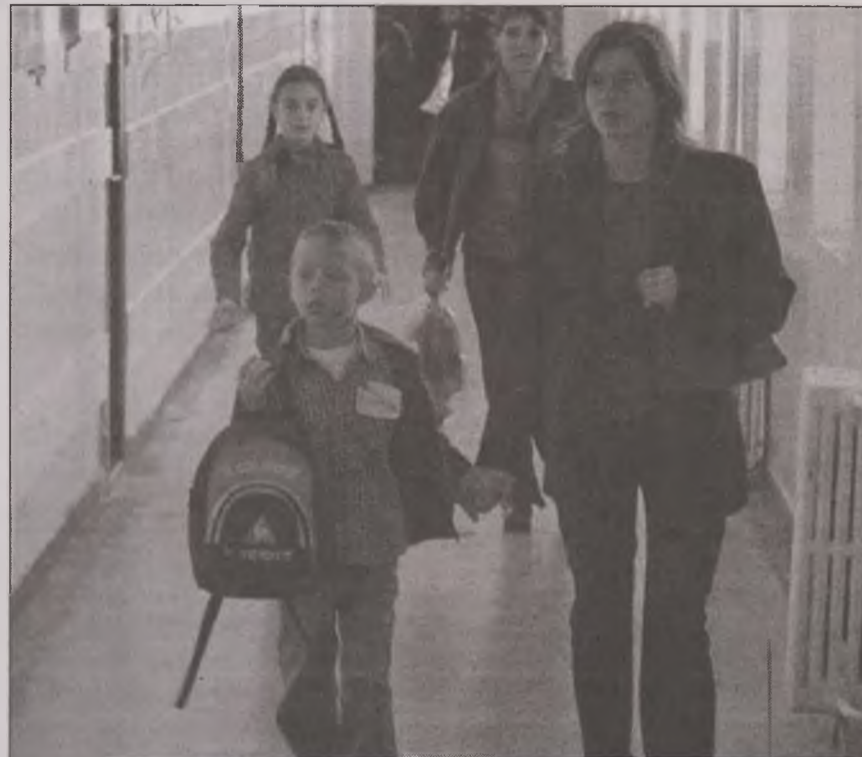
Părinții care până acum își duceau copiii la Școala nr. 10 vor fi nevoiți să îi mute la Școala nr. 9 sau la Școala nr. 12