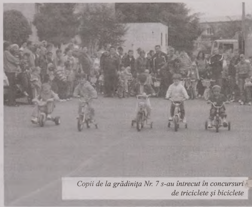
Copii de la grădinița Nr. 7 s-au întrecut în concursuri de triciclete și biciclete