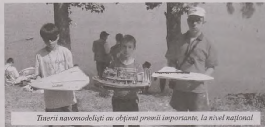
Tinerii navomodeliști au obținut premii importante, la nivel național