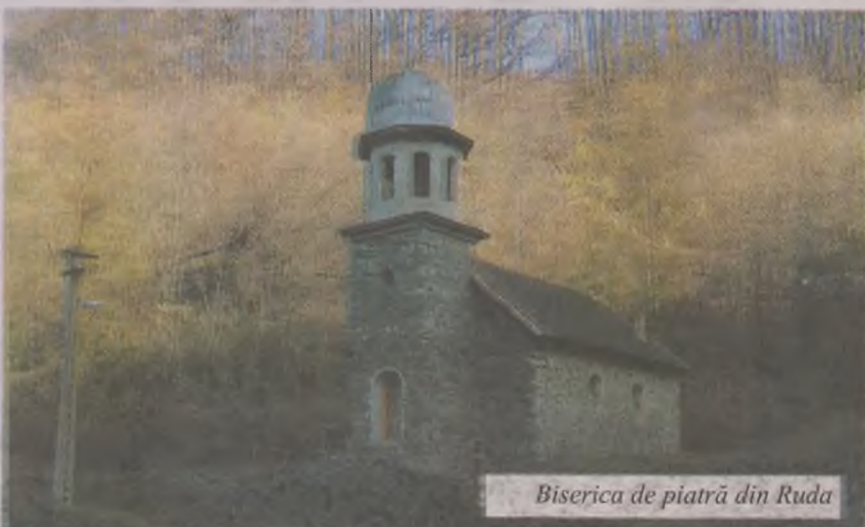
Biserica de piatră din Ruda