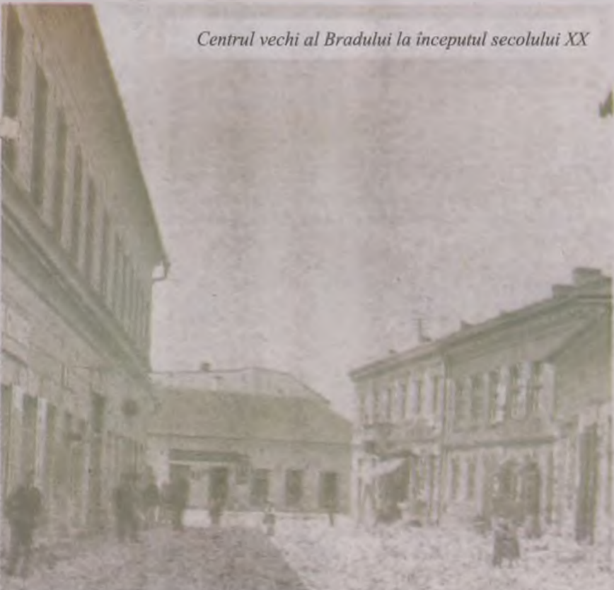
Centrul vechi al Bradului la începutul secolului XX