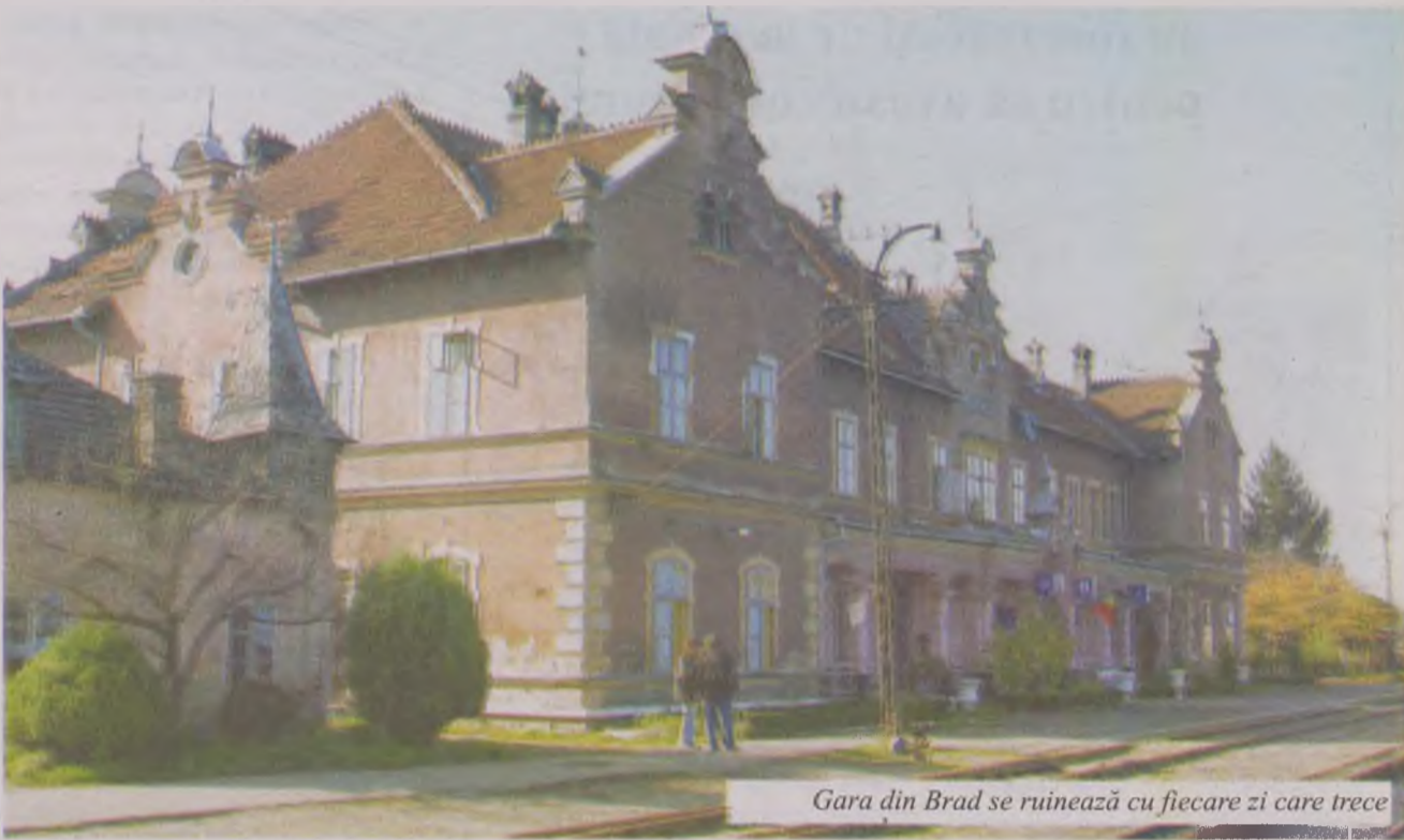
Gara din Brad se ruinează cu fiecare zi care trece

La șase kilometri de Brad, la Ruda Musariu, localitate situată pe malul râului cu același nume se ridicau, în pe-