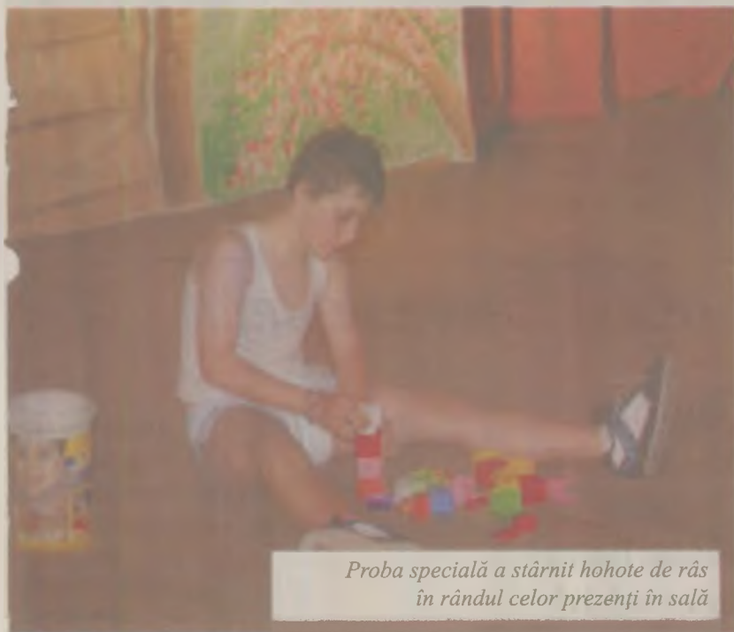
Proba specială a stârnit hohote de râs în rândul celor prezenți în sală