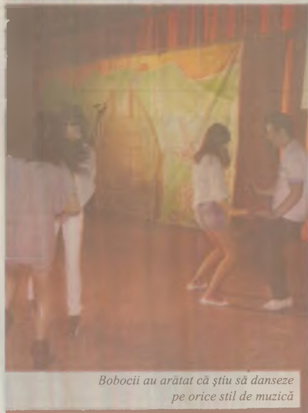
Bobocii au arătat că știu să danseze pe orice stil de muzică