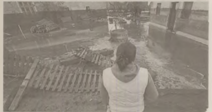
din Kolontar pot alege între apartamentele care vor fi construite într-un complex rezidențial din zona nepoluată din sat sau apartamente aflate în proprietatea statului oricare parte a Ungariei.

Dobson a precizat că autoritățile nu vor obliga pe nimeni să revină în satul distrus, chiar dacă nu toate locuințele au fost avariate de deversarea de noroi. Locuitorii