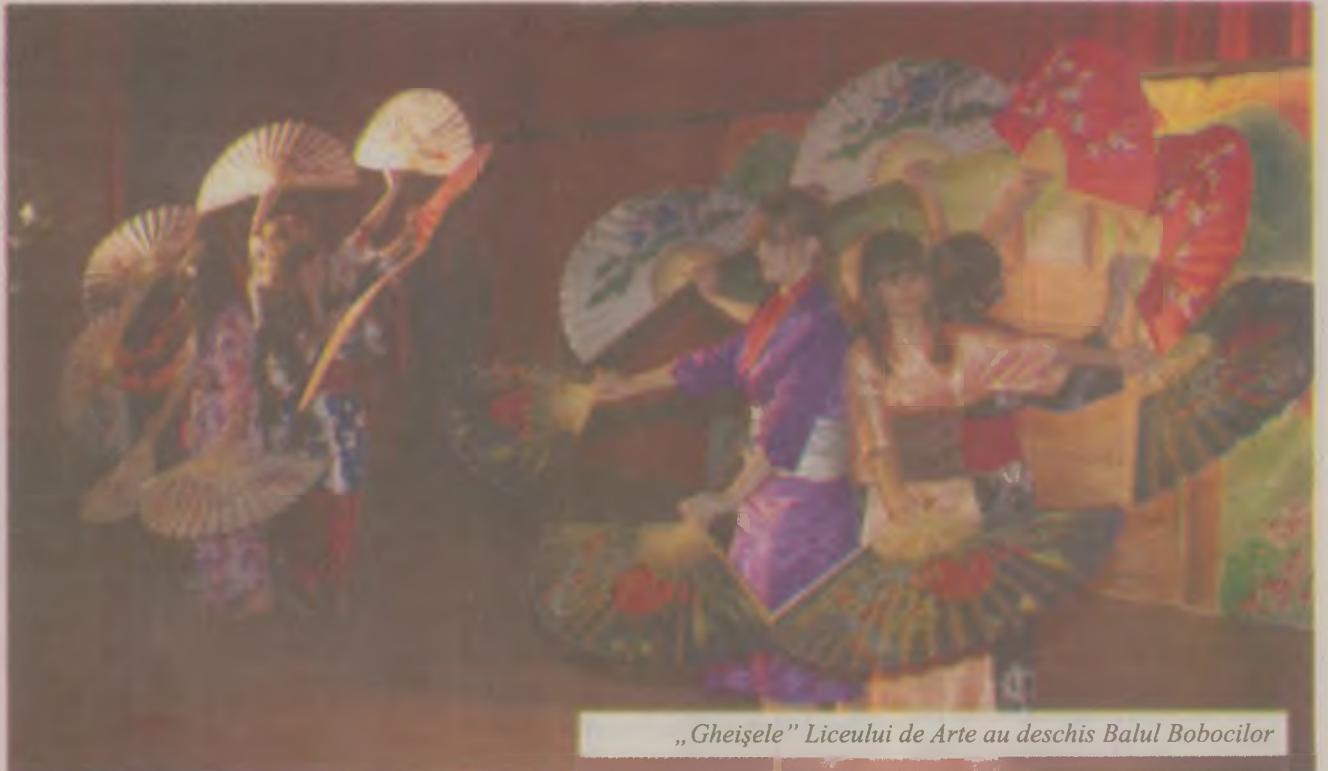
„Gheişele” Liceului de Arte au deschis Balul Bobocilor

„Bobocii” au avut de trecut de o serie de probe inedite gândite de către cei ce vor fi în curând absolvenții Liceului de Arte. Cele opt perechi au trebuit să își demonstreze talentele ascunse într-o probă specială, apoi să răspundă la o serie de întrebări „cu tâlc”, pentru ca la final să danseze așa cum știu mai bine pentru a impresiona juriul format din profesori și elevi din clasa a 12-a. Organizatorii nu au vrut să lase nici un detaliu să le scape, astfel că unul din cei opt băieți participanți a fost deghizat întreaga seară în „moartea de la Hiroshima”, pentru a aduce aminte tuturor de ceea ce s-a întâmplat acum mai bine