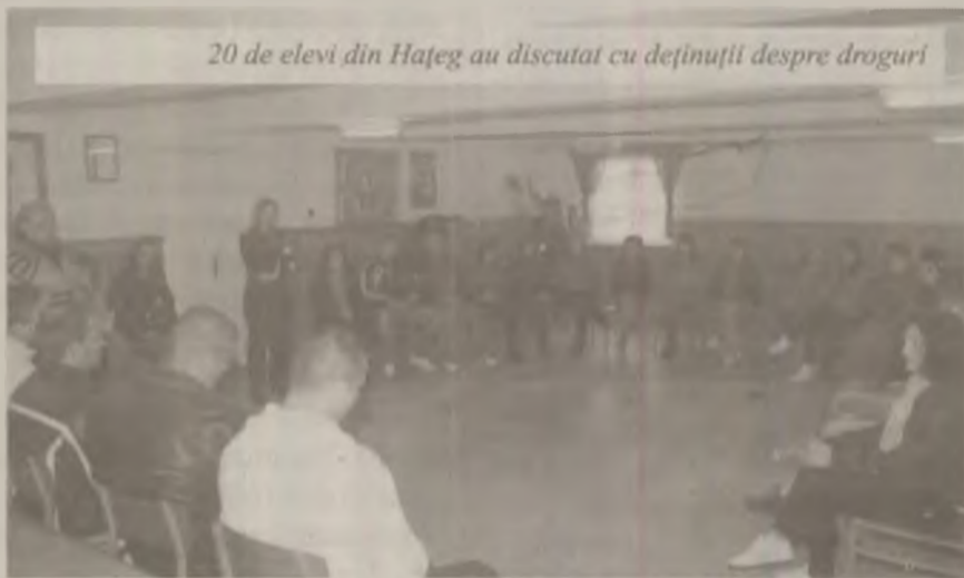
20 de elevi din Hațeg au discutat cu deținuții despre droguri