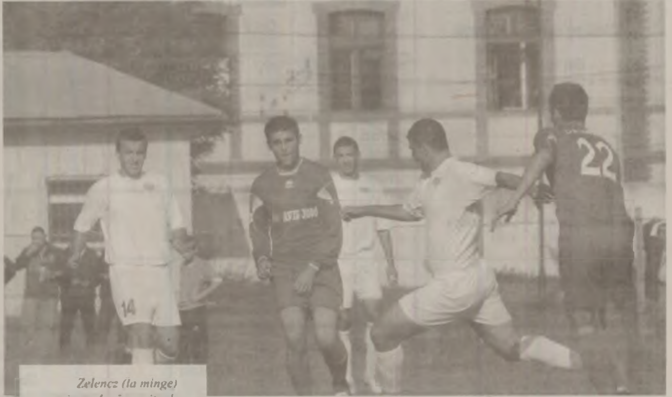
Zelencz (la minge) a ajuns, după reușita de vineri, la cel de-al șaselea gol stagional.