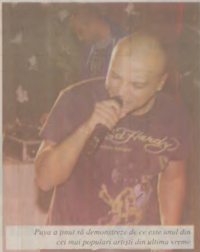
Puya a ținut să demonstreze de ce este unul din cei mai populari artiști din ultima vreme