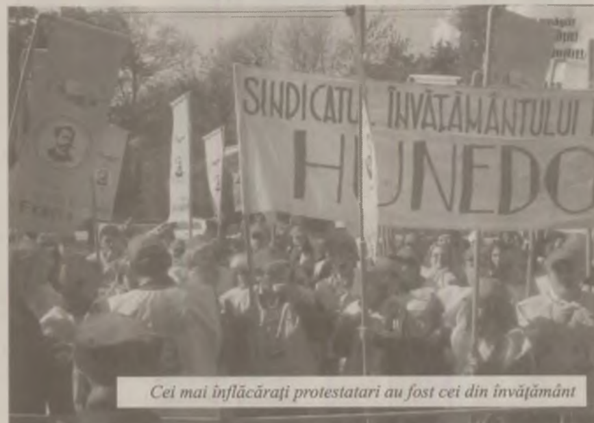
Cei mai înflăcărați protestatari au fost cei din învățământ

O delegație formată din liderii de sindicat din industrie, învățământ și sănătate a fost primită în sediul partidului de guvernământ pentru a purta o