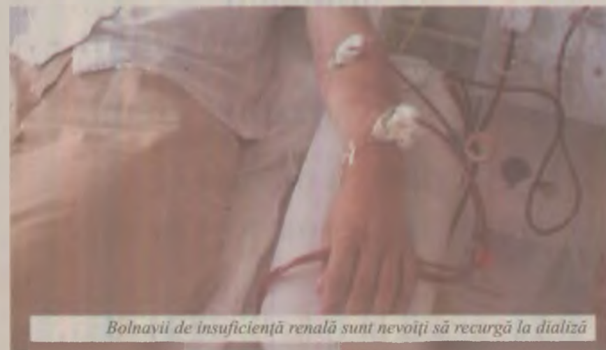
Bolnavii de insuficiență renală sunt nevoiți să recurgă la dializă

evitarea situațiilor care pot determina afectare renală sau agravarea suferinței renale. De altfel, un alt scop al tratamentului bolilor renale cronice este de a controla cauza suferinței. Dacă pacientul are diabet zaharat sau hipertensiune arterială, atunci tratamentul este ținut pe una din aceste condiții, ce duc la deteriorare renală. Medicul curant ar trebui să investigheze și alte posibile cauze ale deteriorării funcției renale, ca obstrucții ale tractului urinar sau folosirea pe termen lung a antialgicelor, precum antiinflamatoarele nesteroidiene sau a antibioticelor.