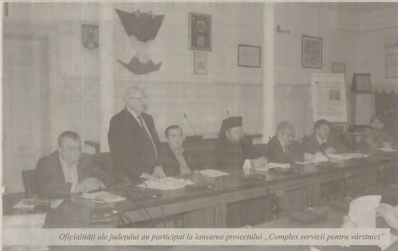
Oficialități ale județului au participat la lansarea proiectului „Complex servicii pentru vârstnici”