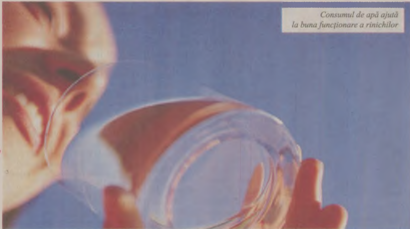
Consumul de apă ajută la buna funcționare a rinichilor

- intoxicația cu plumb; - utilizarea cronică a unor