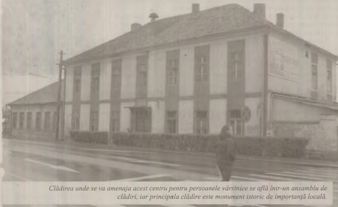
Clădirea unde se va amenaja acest centru pentru persoanele vârstnice se află într-un ansamblu de clădiri, iar principala clădire este monument istoric de importanță locală.

S-a lansat proiectul „Complex de servicii pentru vârstnici”, la Orăștie. Proiectul face parte din Programul Operațional Regional (POR) și a fost semnat în 30 iulie 2010. Acest centru va fi înființat cu scopul de a îmbunătăți sistemul de protecție a persoanelor vârstnice din municipiu. Valoarea totală a proiectului este de peste 3.400.000 de lei, din care aproximativ 2.600.000 de lei provin din asistența financiară nerambursabilă din cadrul POR.