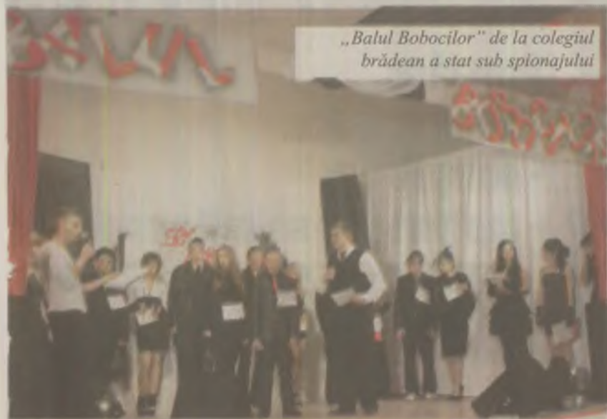
„Balul Bobocilor” de la colegiul brădean a stat sub spionajului