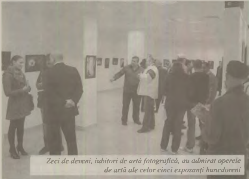
Zeci de deveni, iubitori de artă fotografică, au admirat operele de artă ale celor cinci expozați hunedoreni