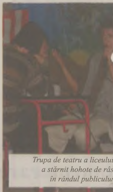
Trupa de teatru a liceului a stârnit hohote de râs în rândul publicului