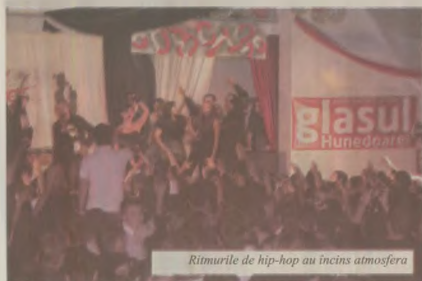
Ritmurile de hip-hop au încins atmosfera