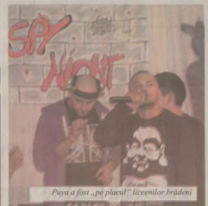
Puya a fost „pe placul” liceenilor brădeni