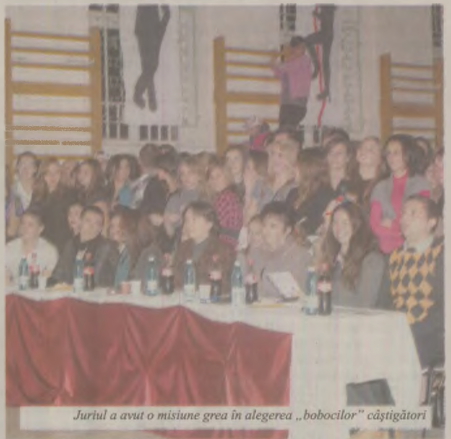
Juriul a avut o misiune grea în alegerea „bobocilor” câștigători