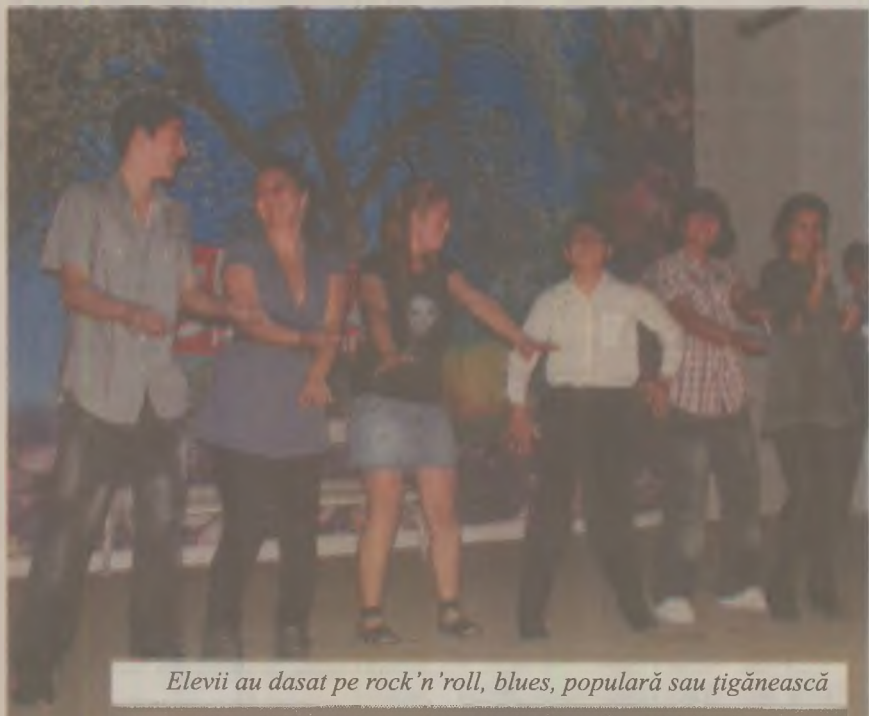
Elevii au dansat pe rock'n'roll, blues, populară sau țigănească