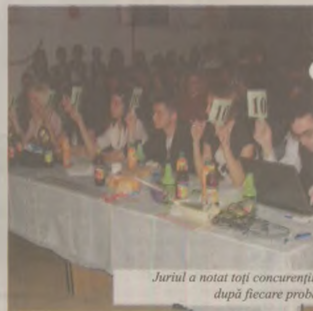
Juriul a notat toți concurenții după fiecare probă