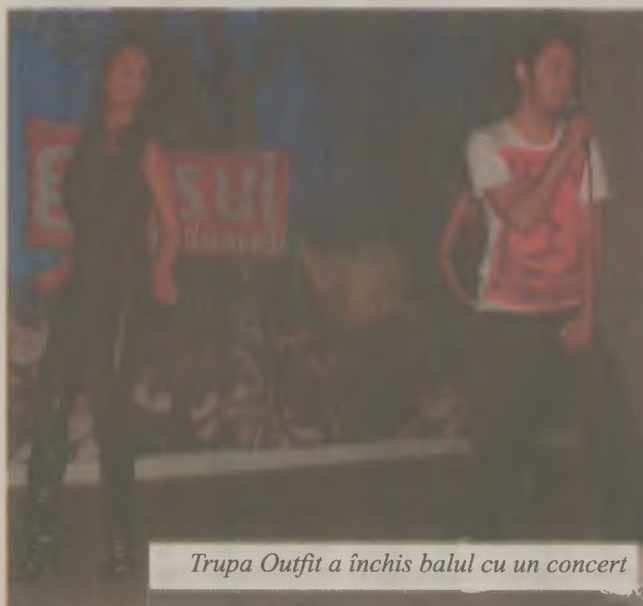
Trupa Outfit a închis balul cu un concert