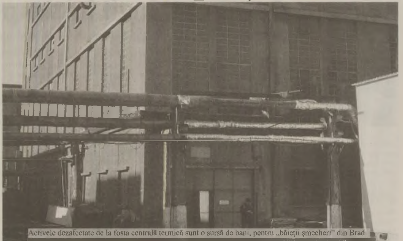
Activele dezafectate de la fosta centrală termică sunt o sursă de bani, pentru „băieții șmecheri” din Brad