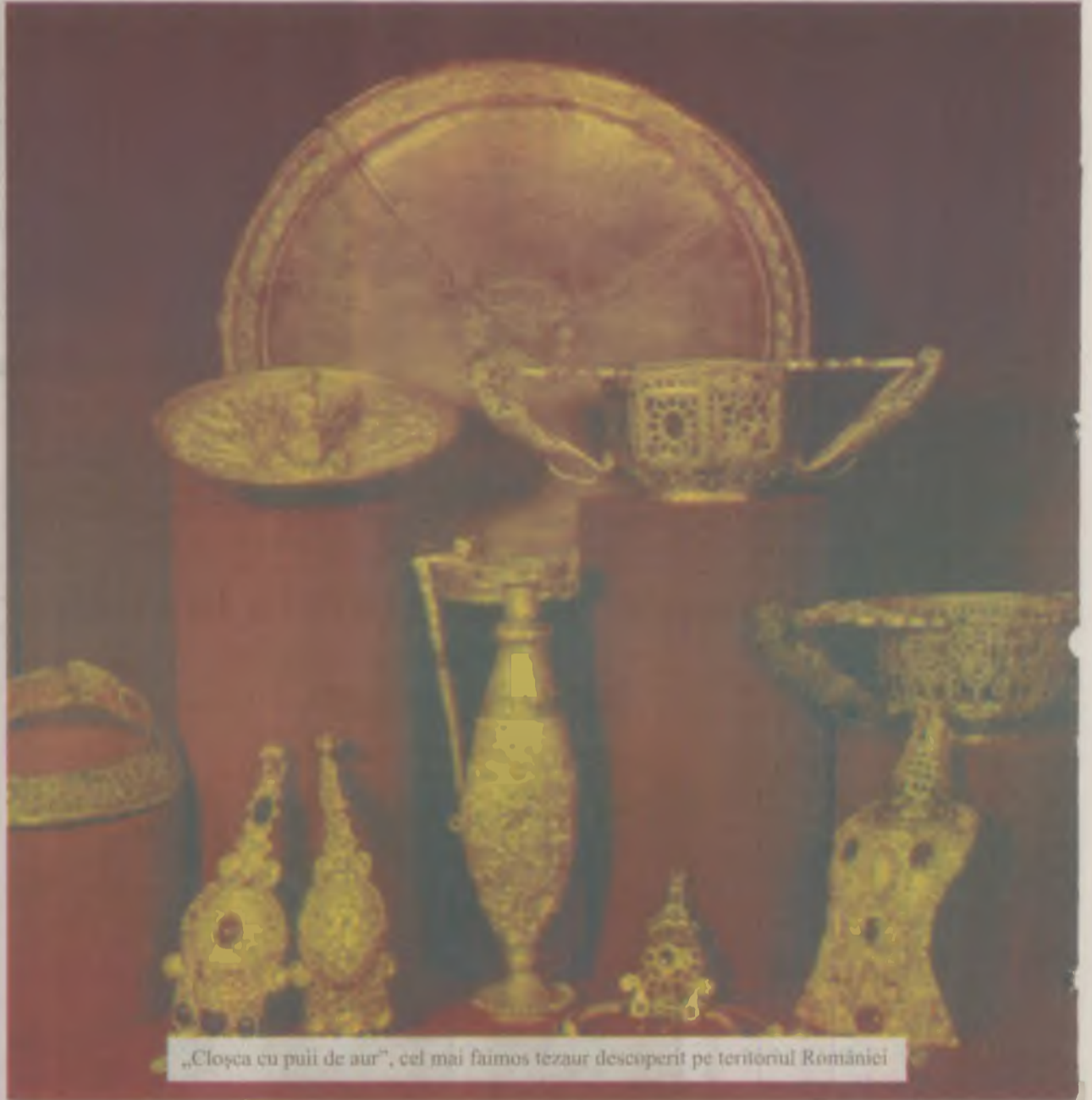
„Cloșca cu pui de aur”, cel mai faimos tezaur descoperit pe teritoriul României

Cel mai important tezaur descoperit în Banat, la Sănnicolau Mare se află tot la muzeul vienez. Tezaurul datează din evul mediu timpuriu și cuprinde 23 de obiecte din aur, în greutate totală de