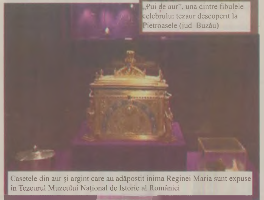
Casetele din aur și argint care au adăpostit inima Reginei Maria sunt expuse în Tezaurul Muzeului Național de Istorie al României