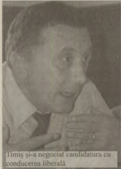
Timiș și-a negociat candidatura cu conducerea liberală

Candidatura lui Timiș pentru postul de deputat a fost „contestată” și de președintele PNL, Crin Antonescu. Prezent la Hațeg, pentru lansarea candidaturii Marianei Câmpeanu, Antonescu a declarat că statutul partidului prevede posibilitatea autosuspendării doar pentru membrii săi care doresc să ocupe funcții în care apartenența politică este interzisă, nu și pentru cei care doresc să candideze ca independenți, chiar împotriva partidului. Pe de altă parte, surse susțin că președintele Crin Antonescu a mai încercat să-l convingă pe Timiș să renunțe la în-