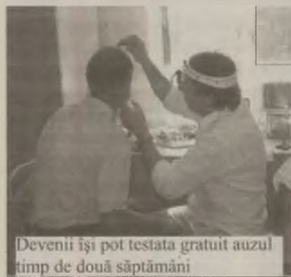
Devenii își pot testa gratuit auzul timp de două săptămâni

Campania se adresează în special persoanelor care au probleme auditive, indiferent dacă folosesc sau nu aparate auditive, fără să conteze modelul acestora. Testele gratuite se vor face în cabinetele de audiologie, ale Audio-optica, iar pacienții care vor fi depistați cu deficiențe de auz vor fi diagnosticați. Devenilor, li se vor face o serie de investigații cum ar fi, audiogramă tonală, vocală, în câmp liber, impedanță (timpanogramă și reflex stapedian) și otoemisiune (pentru copii). „Acest proiect are ca scop identificarea și sprijinirea persoanelor care se confruntă cu probleme auditive. După realizarea testelor gratuite, devenii vor beneficia inclusiv de interpretarea rezultatelor și vor primi cea mai eficientă soluție pentru rezolvarea problemelor auditive cu care se confruntă”, a declarat purtătorul