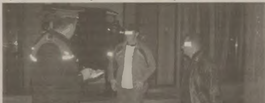
Barurile din Deva au fost luate „la puricat” de polițiști și jandarmi

Un bărbat în vârstă de 33 de ani, din Ilia, urmărit internațional la solicitarea Biroului Central Național Interpol Bruxelles, a fost prins de polițiștii din cadrul Serviciului de Investigații Criminale și cei ai Poliției Comunale Ilia. Pe numele bărbatului, autoritățile din Belgia, au emis mandat european de arestare în data de 3 noiembrie, pentru săvârșirea infracțiunilor de tâlhărie și furt calificat. Bărbatul a fost prezentat Parchetului de pe lângă Curtea de Apel Alba-Iulia, care a emis ordonanță de reținere pe timp de 24 ore, iar Curtea de Apel Alba-Iulia a emis pe numele acestuia mandat de arestare preventivă pentru cinci zile, în vederea predării către autoritățile din Belgia. Bărbatul a fost