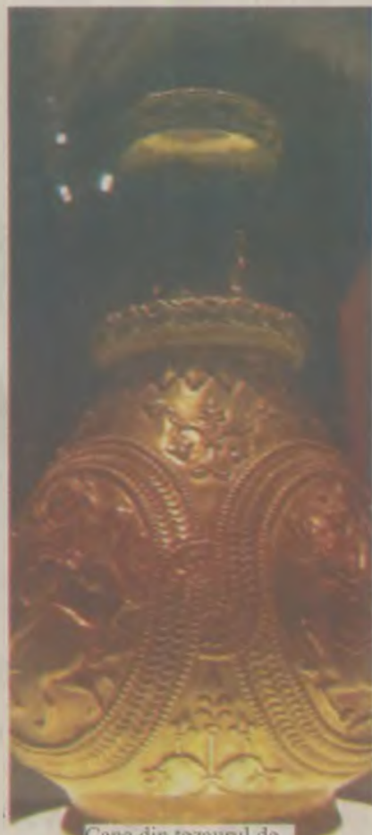
Cana din tezaurul de la Sănnicolau Mare