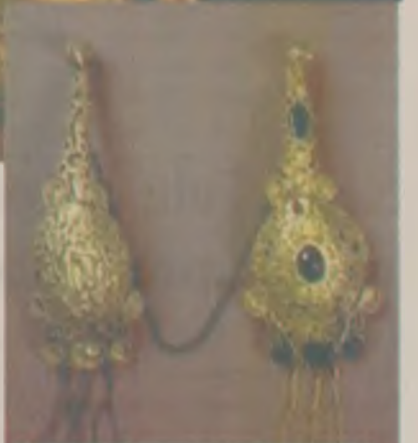
„Pui de aur”, una dintre fibulele celebrului tezaur descoperit la Pietroasele (jud. Buzău)