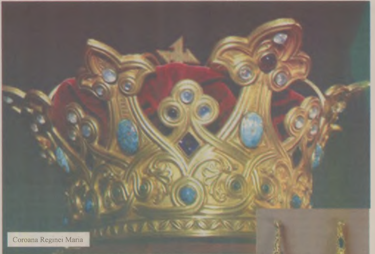
Coroana Reginei Maria