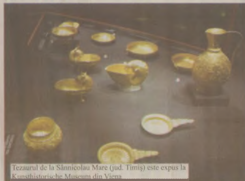
Tezaurul de la Sănnicolau Mare (jud. Timiș) este expus la Kunsthistorische Museum din Viena

ar fi putut aparține unei căpetenii gepide și dovedesc legăturile stabile între populațiile migratoare de origine germanică și romani în perioada târzie a imperiului. Tot în Transilvania, Apahida, lângă Cluj, au fost descoperite întâmplător, în 1889, 1868-1979, în trei morminte principii diferite, piese de podoabă și de ornament care au aparținut unor personaje importante din neamul germanic gepizilor. Chiar dacă aidoma altor tez