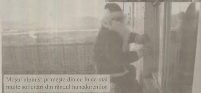
Moșul alpinist primește din ce în ce mai multe solicitări din rândul hunedorenilor

vătat. Moșul este alpinist utilitar, îi place să exploreze natura și a practicat speologia, iar cea mai mare distanță la care a stat „cocoțat” a fost de 220 de metri. Așadar, coborâtul în rapel de la etajul zece al unui bloc turn este floare la ureche. După ce impresarul Moșului a preluat comanda, urmează o inspecție la fața locului, pentru a verifica dacă există un suport solid de care se poate lega coarda pe care Moșul o să coboare. Dacă totul este în regulă, cu câteva ore înainte de mult așteptata vizită, ajutoarele Moșului preiau de la părinți cadourile pentru copii. „De câteva zile au început să sune telefoanele. Este al treilea an în care Moșul nostru se ocupă de astfel de activități. Anul trecut, am avut 15 solicitări pentru ziua de Ajun, de obicei în această zi sunt cele mai multe solicitări. Este un mod inedit de a aduce cadouri celor mici, iar părinții apelează la serviciile noastre, în ciuda crizei. Adesea se adună mai multe familii cu copii la cineva acasă, pentru