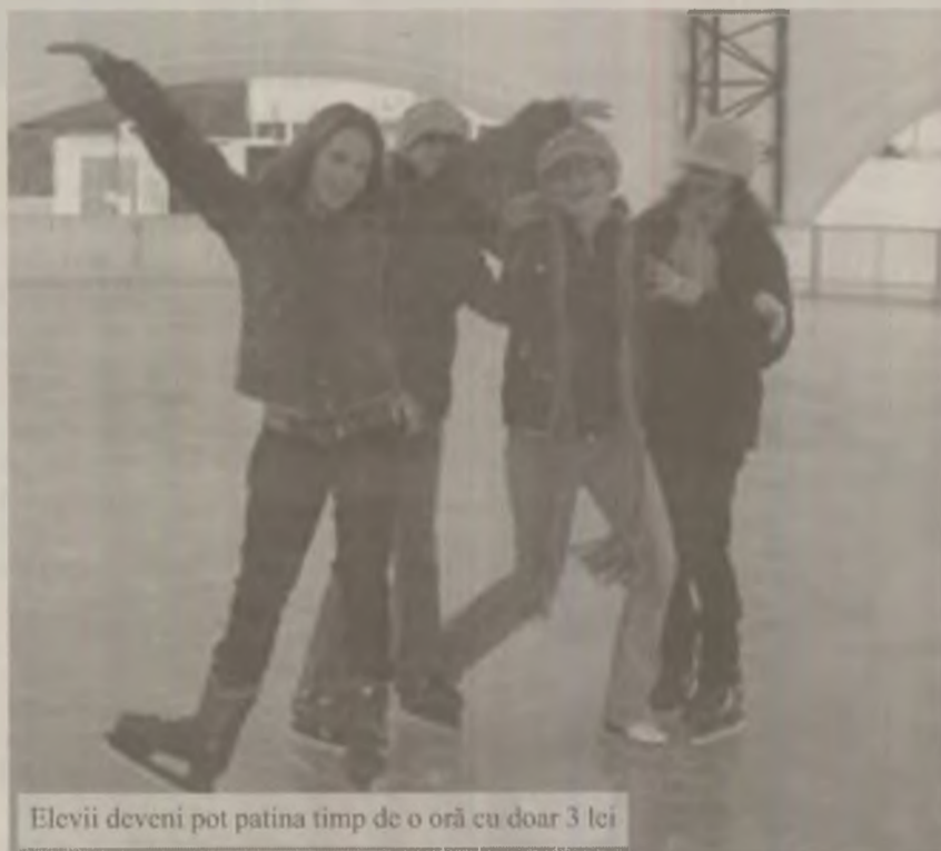
Elevii deveni pot patina timp de o oră cu doar 3 lei

Tichetele eliberate de primărie sunt distribuite elevilor și preșcolărilor prin intermediul unităților de învățământ. Pentru a beneficia de reducere, tot ce trebuie să facă micuții este să solicite educatorilor, învățătorilor sau dirigintilor să fie înscrși pe listele în baza cărora pot beneficia de această reduc-