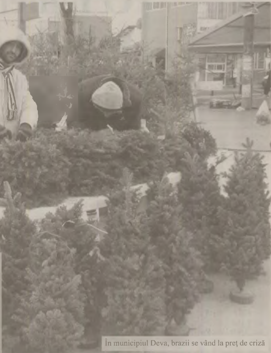
În municipiul Deva, brazii se vând la preț de criză

tămâna aceasta au apărut în piețe și primii comercianți de pomi Crăciun. Brăduleții se comercializează la preț de criză. Vânzătorii spun că față de anul trecut în care au rămas cu marfa nevândută din cauza prețului mult prea piperat pentru buzunarul hunedorenilor,