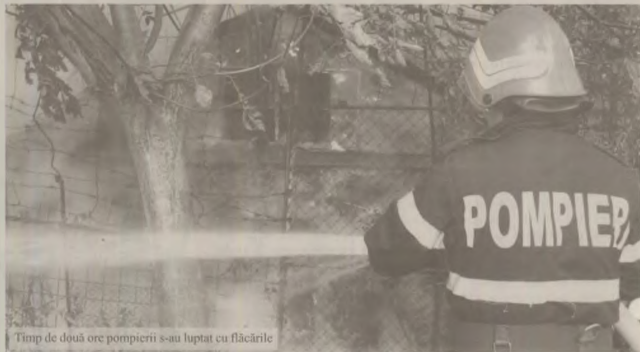
Timp de două ore pompierii s-au luptat cu flăcările

„Pompierii au reușit lichidarea incendiului după aproximativ o oră de muncă și au stabilit că flăcările au izbucnit din cauza utilizării necorespunzătoare a