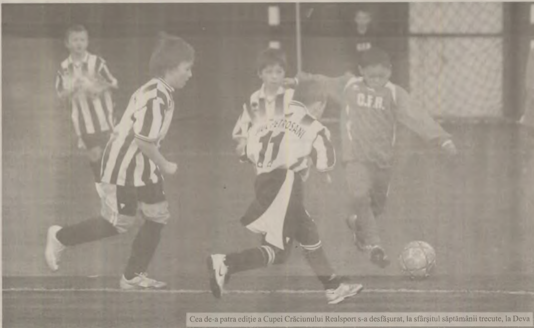
Cea de-a patra ediție a Cupei Crăciunului Realsport s-a desfășurat, la sfârșitul săptămânii trecute, la Deva

În competiția rezervată celor născuți în 1999, micuții de la Unirea Alba Iulia au ocupat prima poziție după ce au marcat 14 goluri și au primit doar două în cele