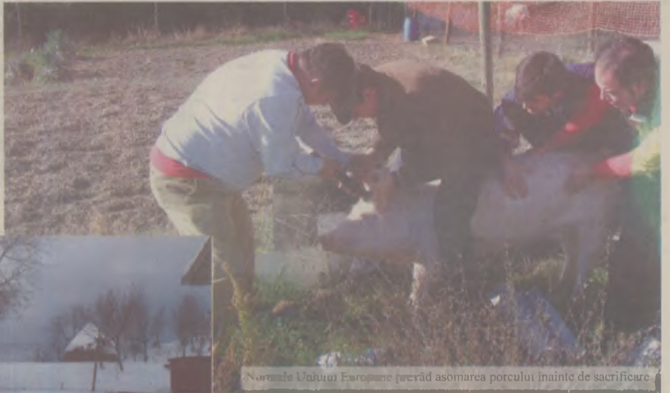
Normele Uniunii Europene prevăd asomarea porcului înainte de sacrificare

fiecare. Măruntăiele și capul de porc se pun la fiert pentru caltaboș și tobă în apa în care s-a fiert orezul. Slănina se sărează, carnea se separă în funcție de preparatul culinar pentru care este destinată: sarmale, fripturi, pomana porcului. Intestinele sunt curățate de gospodine pentru a fi umplute cu cârnaț și caltaboș. În zilele noastre însă, gospodinele preferă să cumpere intestine de la măcelării, iar cele de la porc sunt aruncate. Pe vremuri beșica animalului (vezica urinară) era dată copi-