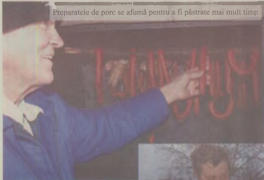
Preparatele de porc se afumă pentru a fi păstrate mai mult timp

Ziua de Ignat în care se taie porcul este un moment de sărbătoare, așteptat cu nerăbdare de toți membrii familiei.