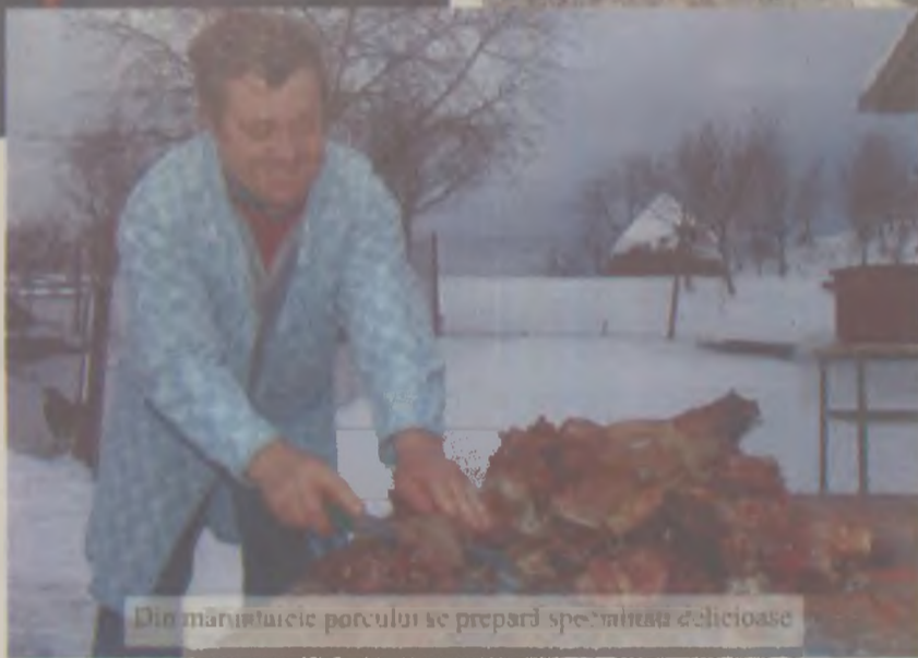
Din măruntaiele porcului se prepară specialități delicioase

Odată cu terminarea părjolirii și spălării