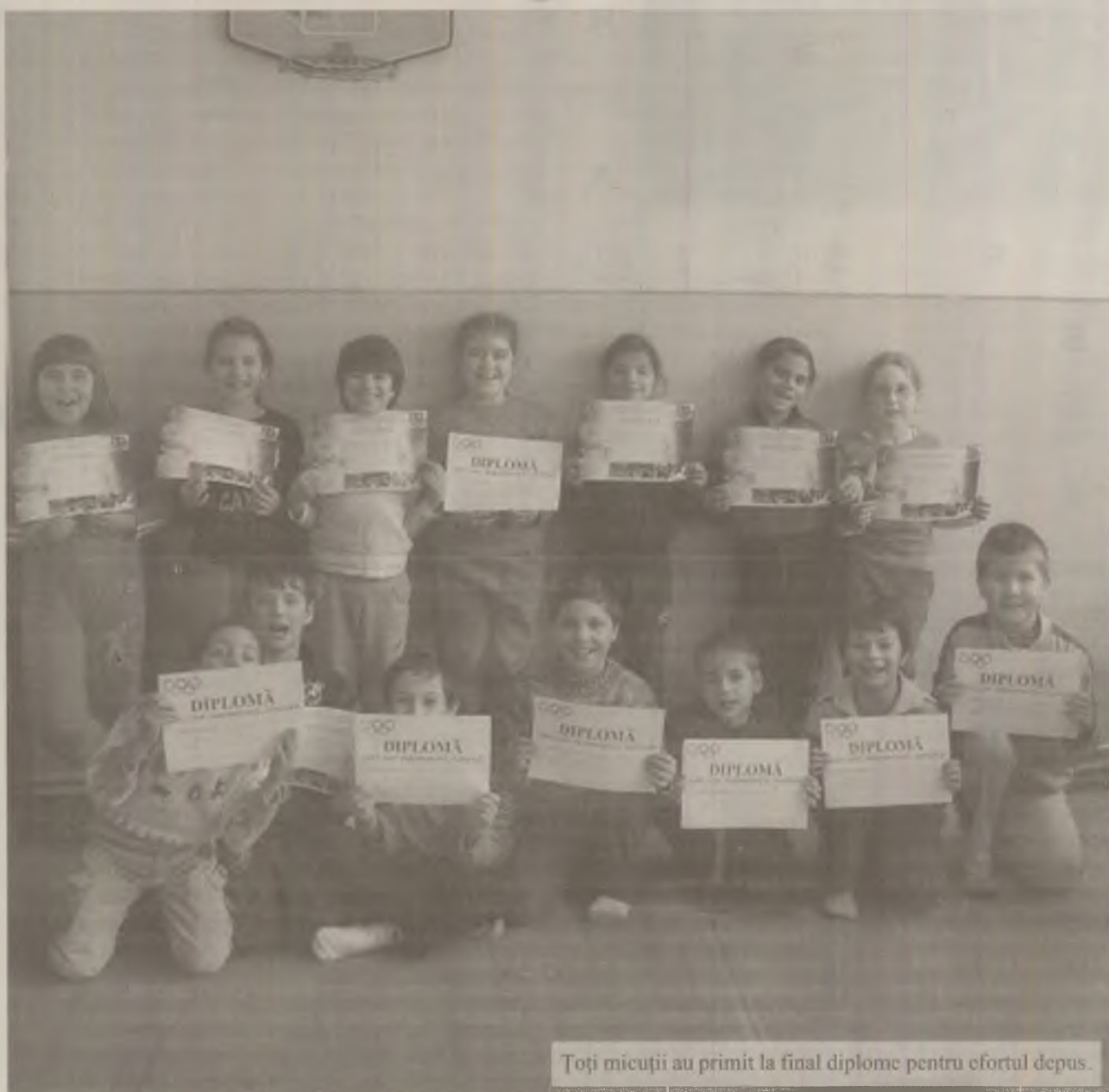
Toți micuții au primit la final diplome pentru efortul depus.